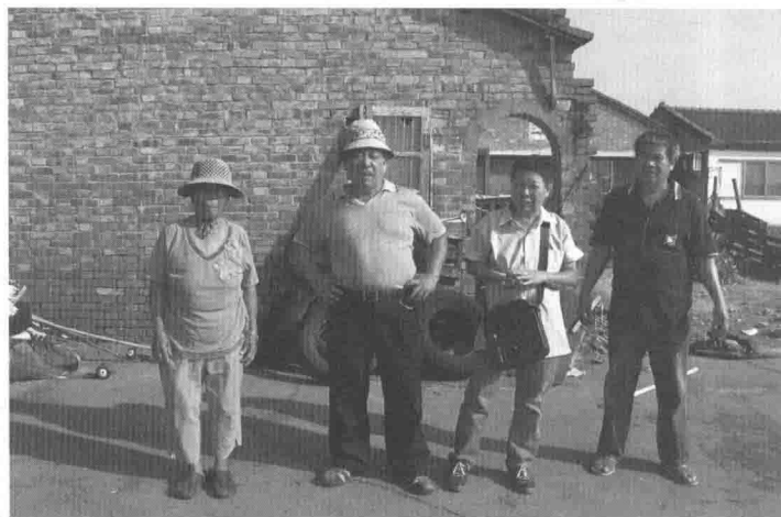
我妈和她的兄弟姐妹的关系淡薄，似乎有种相忘于江湖的感觉。