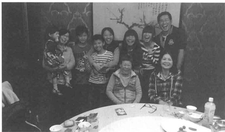
拍片期间拍下我们家第一张全家福。