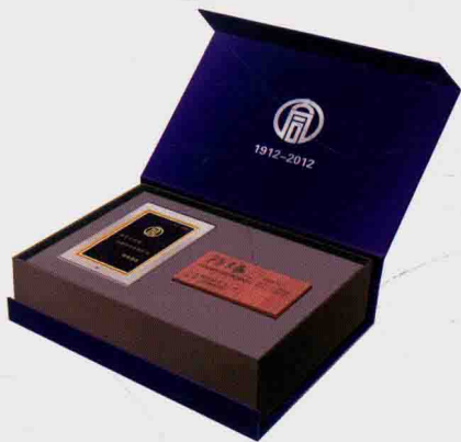
图 1-2 迷你砖与捐赠证书