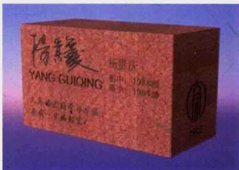
图 1-1 校友砖单体设计稿示意

单块校友砖的设计方案如图 1-1 所示，每一块校友砖将有以下三大元素：①校友自己的中文签名及姓名的英文名；②级别（即入校年份）；③如果校友们感触深厚，还可以添加一句 20 字之内的留言（含标点符号）。留言可以是学生时代的感悟，对母校想说的话，或是对未来校友的寄语，也可以是校友自己的座右铭、人生格言等等。届时学校将根据感悟留言的具体情况在砖上增刻。