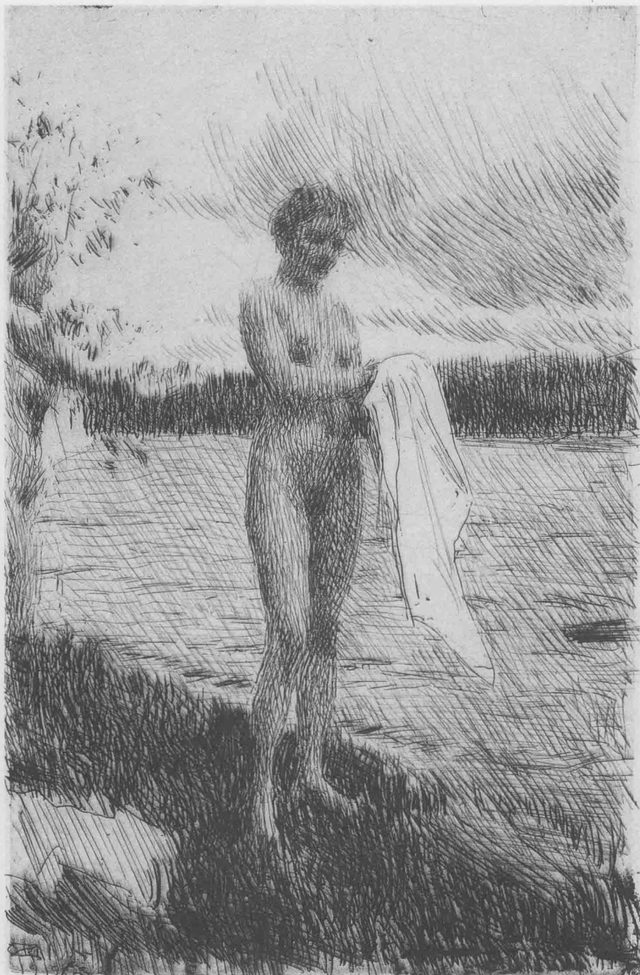
沐浴后 1919年 铜版画