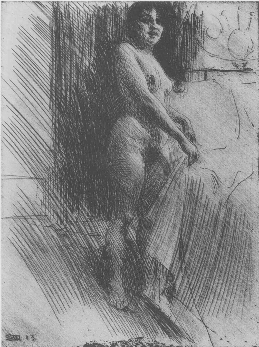
床边的女子 1903年 铜版画