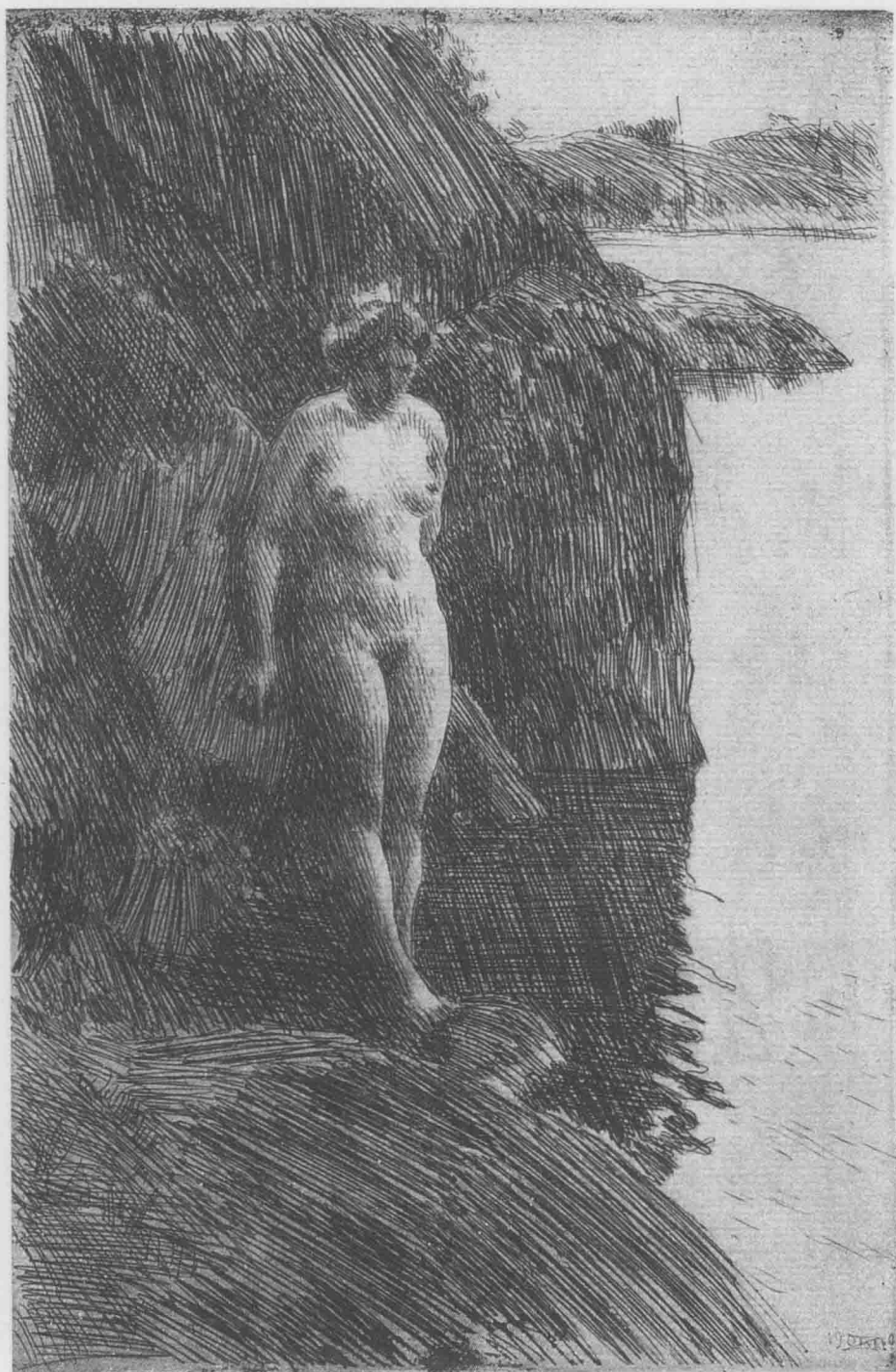
崖边的女人 1902年 铜版画