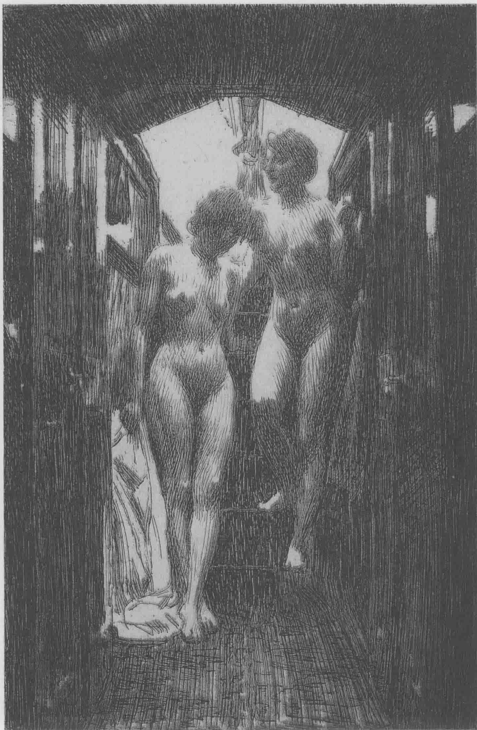
下船舱 1917年 铜版画 29.6cm × 19.6cm