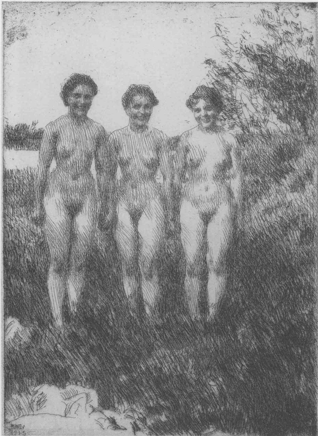
草丛中的三个女人 1913年 铜版画