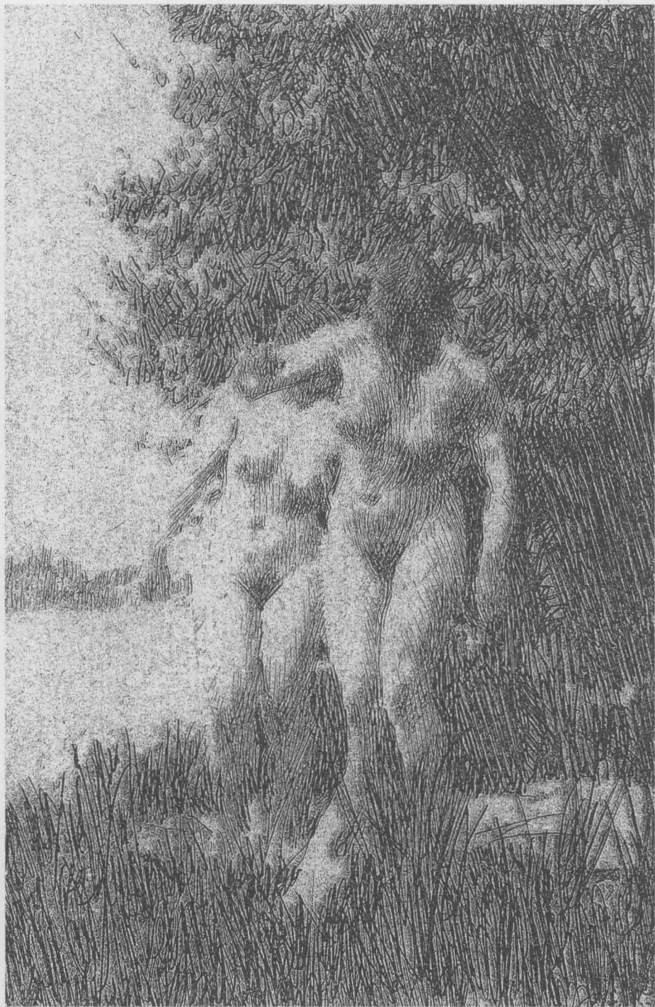
草地上的两个女人 约1903年 铜版画