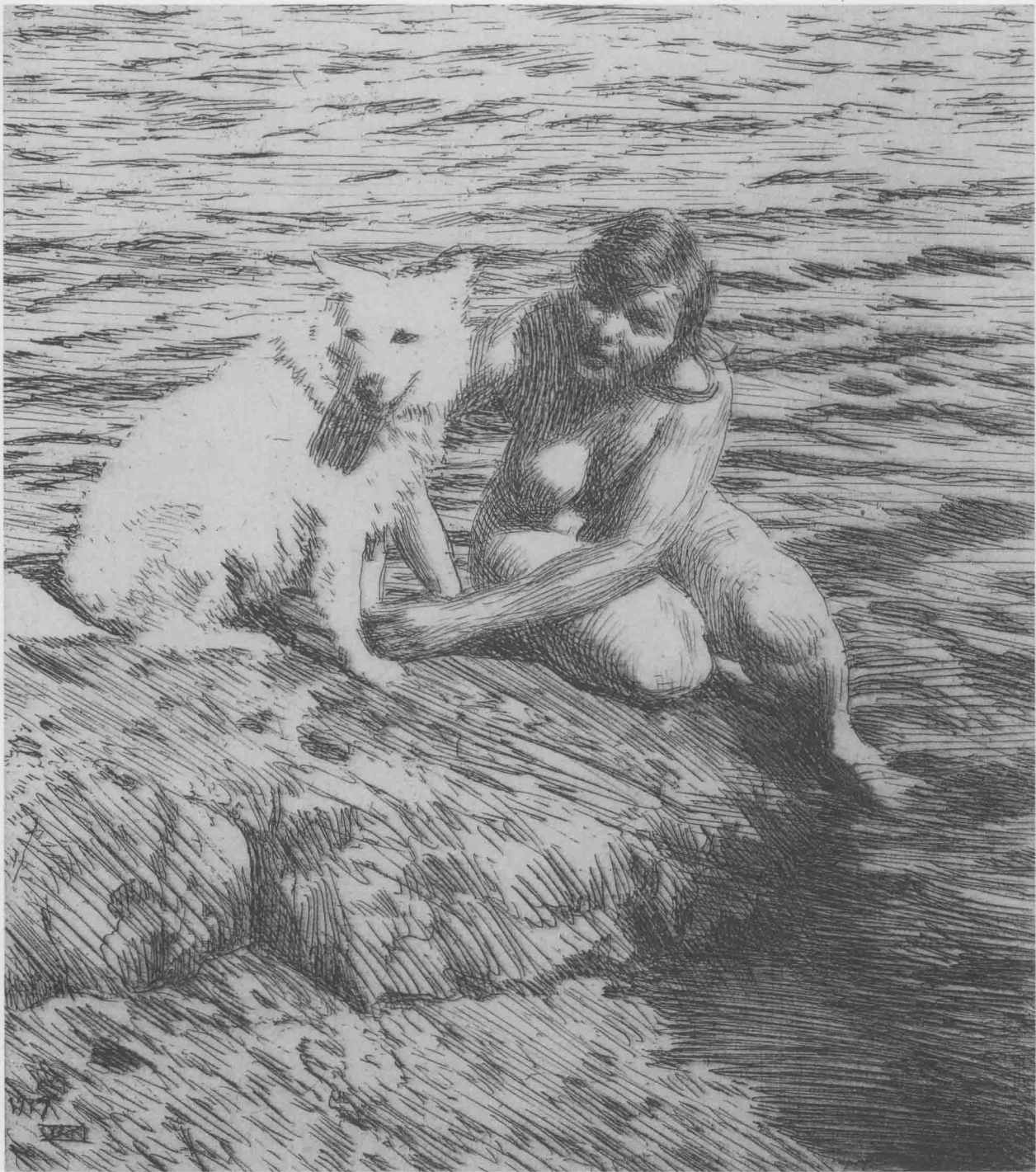
女人与狗 1917年 铜版画