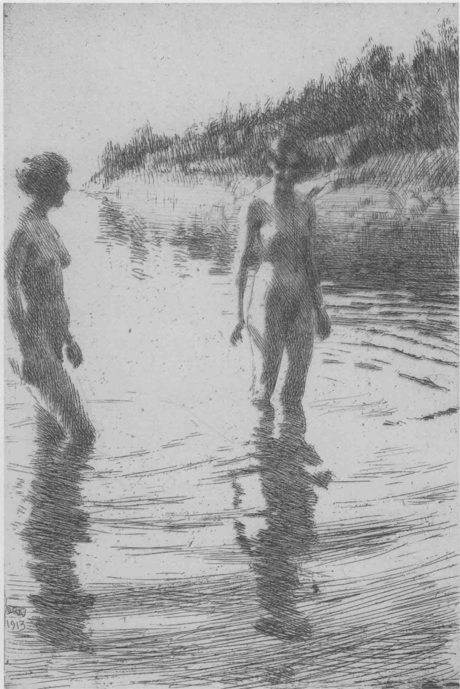
水中的两个女人 1913年 铜版画 29.9cm × 19.8cm