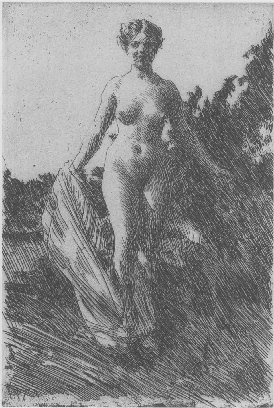
水边的少女 1907年 铜版画