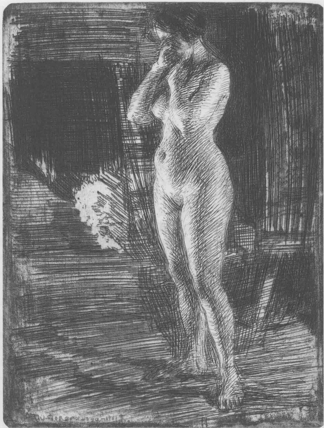
掩面的女人 1901年 铜版画