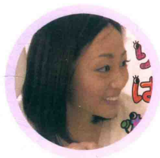
森畑 女性, 学生