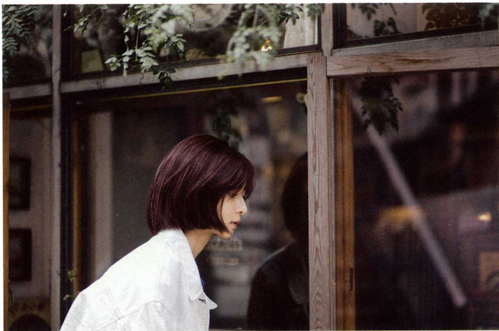
Canon EOS 5D Mark III