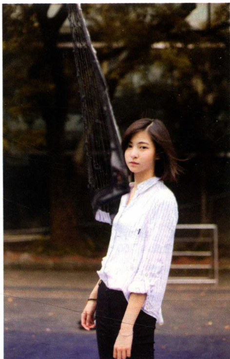
Canon EOS 5D Mark III

特点 一是可以让人物充满画面，占据更大的比例，从而起到突出人物主体的作用。二是长焦距可以带来景深浅的效果，更利于获得虚化的背景与前景，人像背景的虚化也很油润、好看，推荐在室外使用。