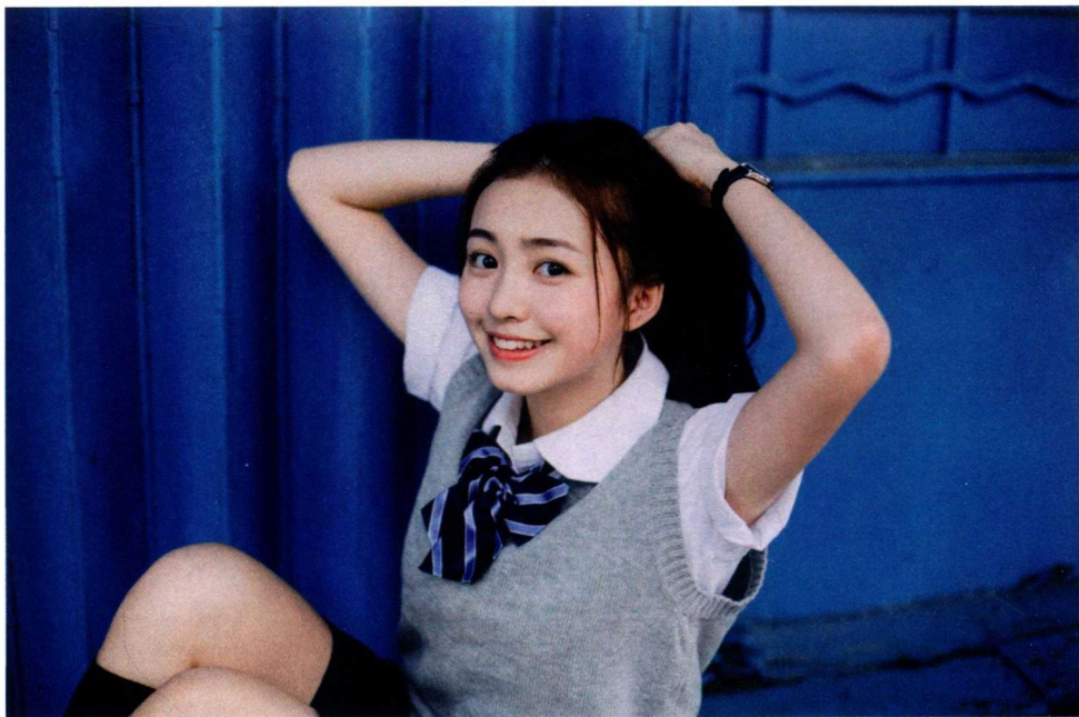
Canon EOS 5D Mark III 焦距50mm 光圈f/2.2 快门1/640s ISO400