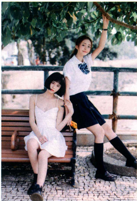
Canon EOS 5D Mark III 焦距50mm 光圈f/2.2 快门1/1000s ISO125

特点 成像质量较好，透视畸变小，光圈绝对口径大，可以展现出人物自然、真实的美感。因为焦距适中，室内室外都可以用。