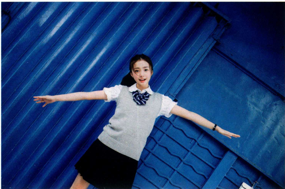
Canon EOS 5D Mark III 焦距50mm 光圈f/2.2 快门1/640s ISO400