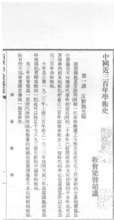
《中国近三百年学术史》 “清华学校讲义”本内文