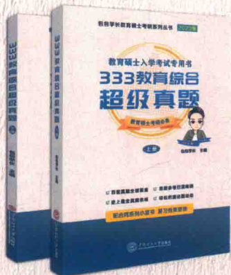
● 333教育综合超级真题 (上、下册)