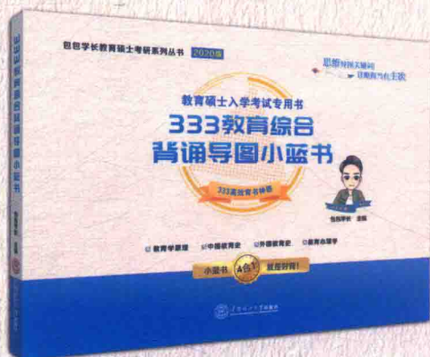
333教育综合背诵导图小蓝书