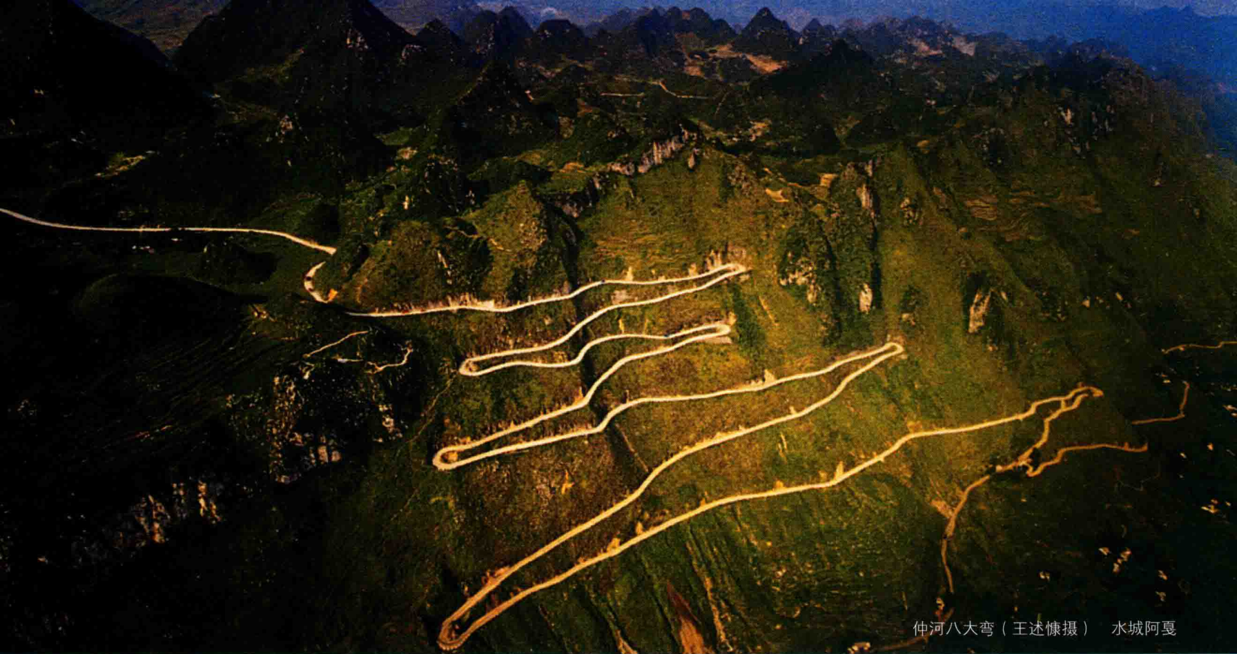
仲河八大弯 水城阿戛