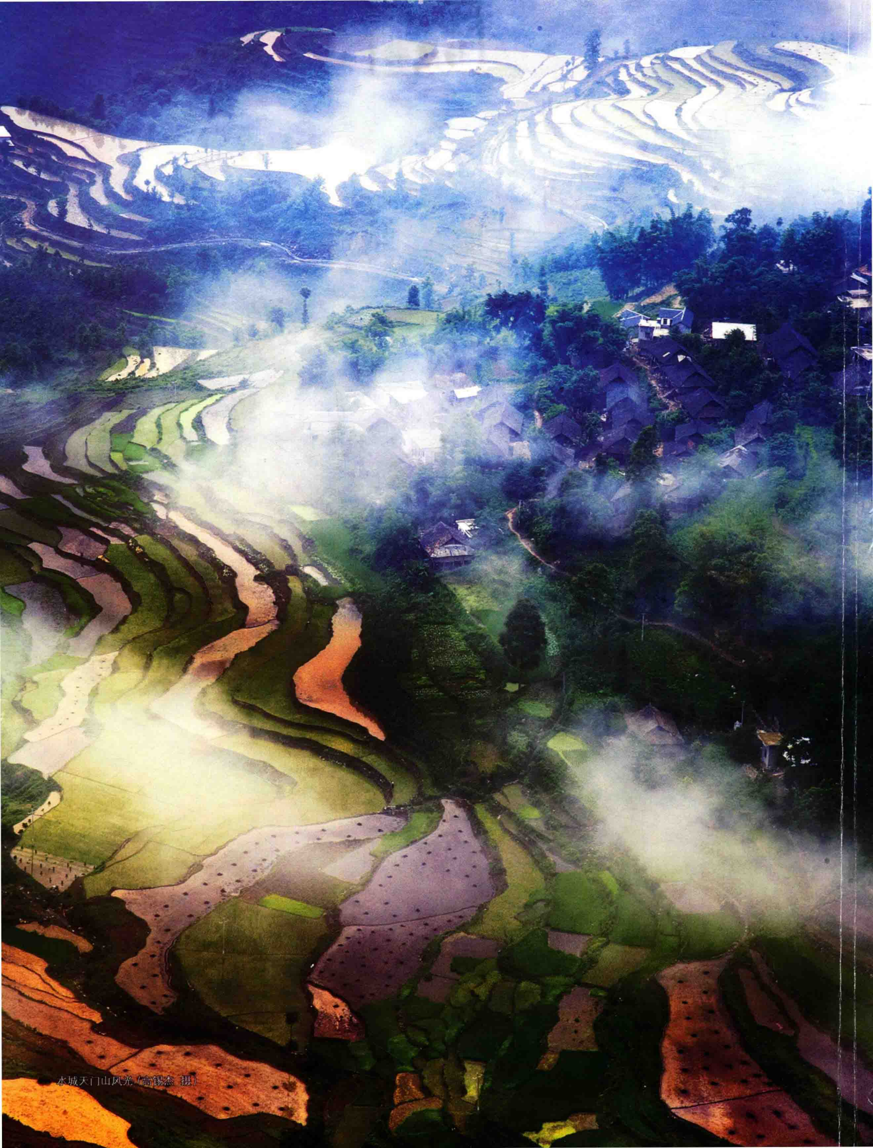
水城天门山风光