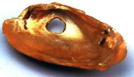
六枝桃花洞穿孔蚌器(贵州省博物馆藏)

市境内出土的众多史前石器中,最具工艺审美价值的当数1954年出土于盘县沙沱的磨制石铤。该石器系一放牛小孩拾得并捐献,通高7.7厘米,厚1.5厘米,刃宽5.2厘米,微弧,两肩对称,宽5厘米,位于高3.8厘米处,约略倾斜。石铤通身磨制,石质坚硬,加工难度大,工艺精细。磨制石铤通体红色,间有少许牙白色,部分透明,润泽