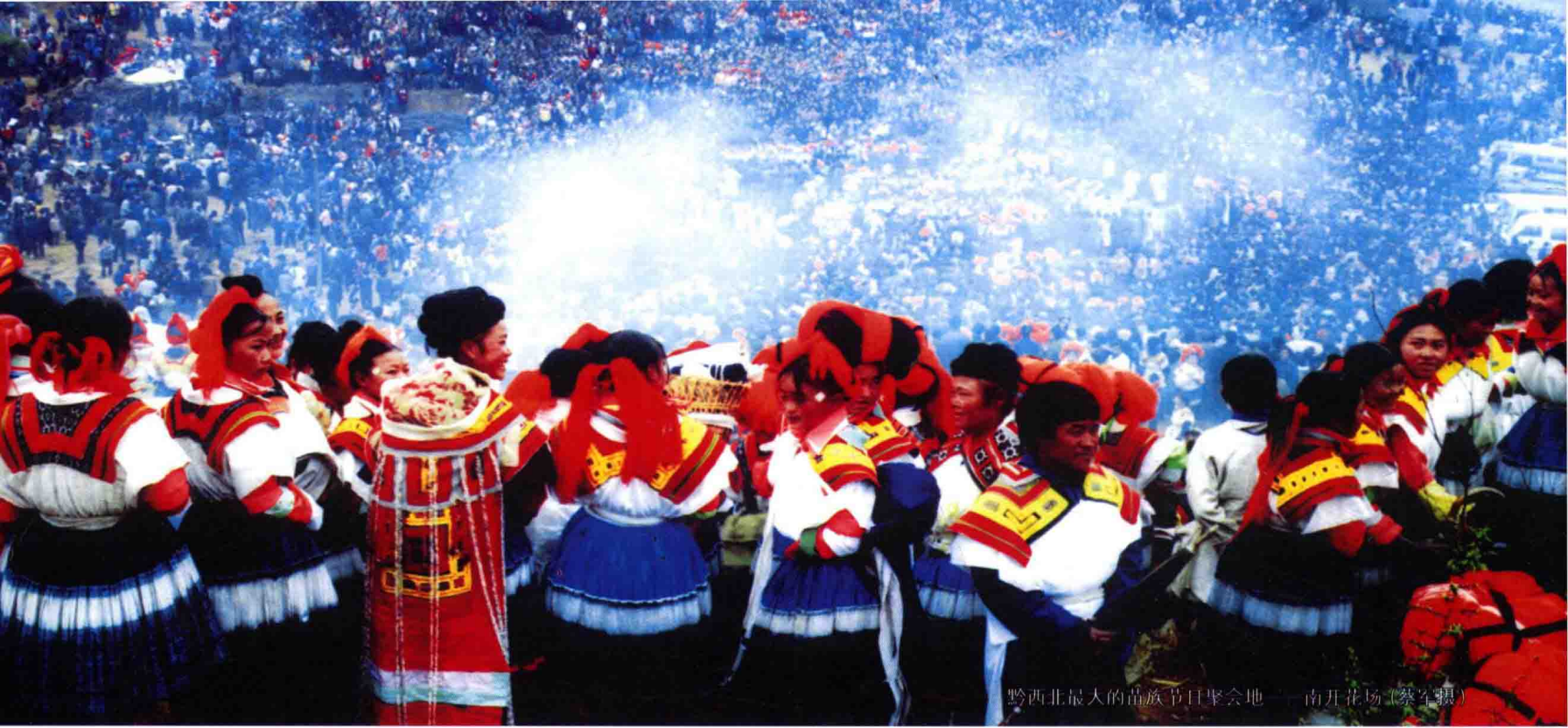
黔西北最大的苗族节日聚会地——南开花场