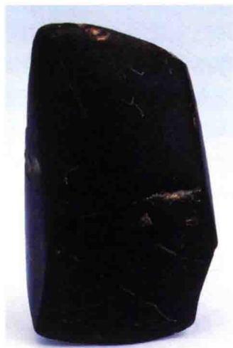
六枝桃花洞石斧(贵州省博物馆藏)