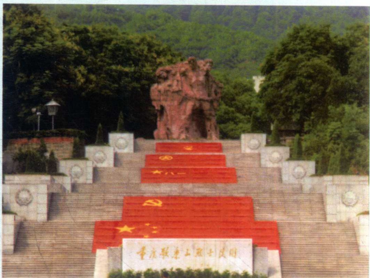
重庆歌乐山革命烈士陵园