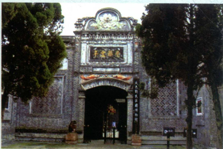
大邑刘氏庄园（老公馆）