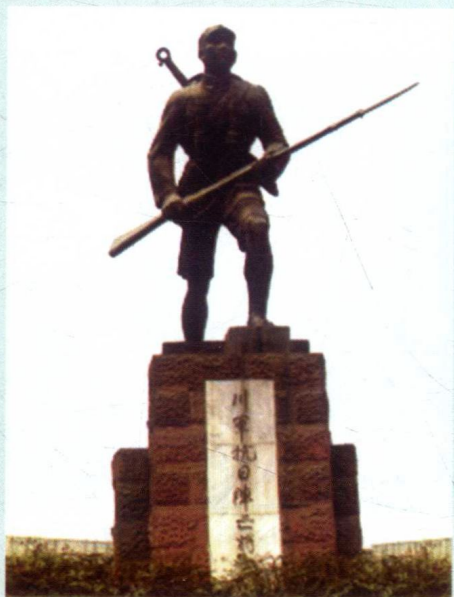
成都“川军抗日阵亡将士纪念碑”（“无名英雄铜像”）