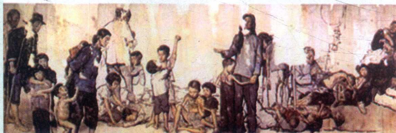
蒋兆和的《流民图》(局部)