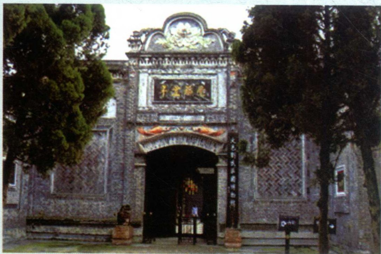
大邑刘氏庄园（老公馆）