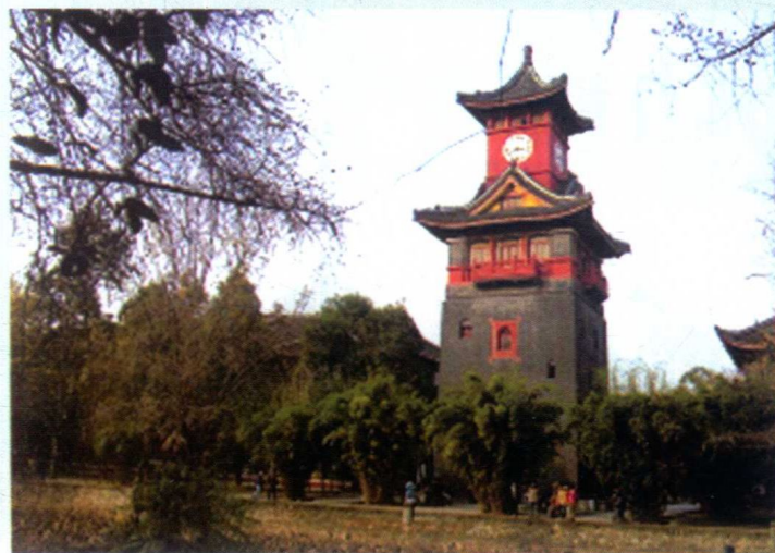
华西协合大学（今四川大学华西医学院）校园内中西合璧建筑风格的钟楼