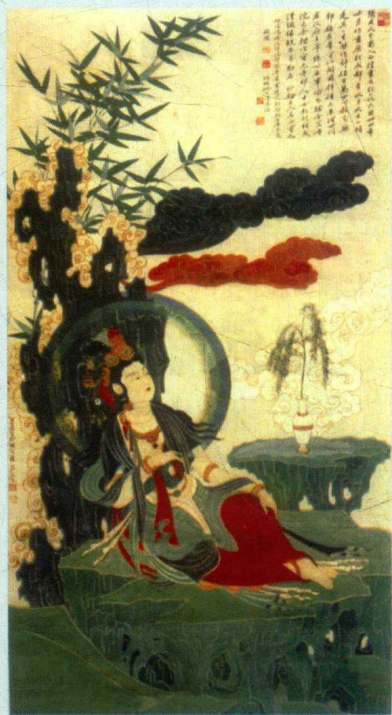
张大千临摹的敦煌壁画《西夏水月观音》