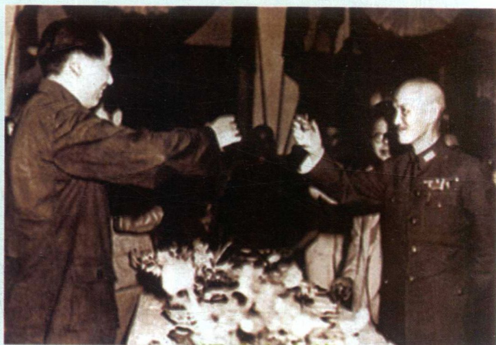
1945年重庆谈判期间的毛泽东与蒋介石