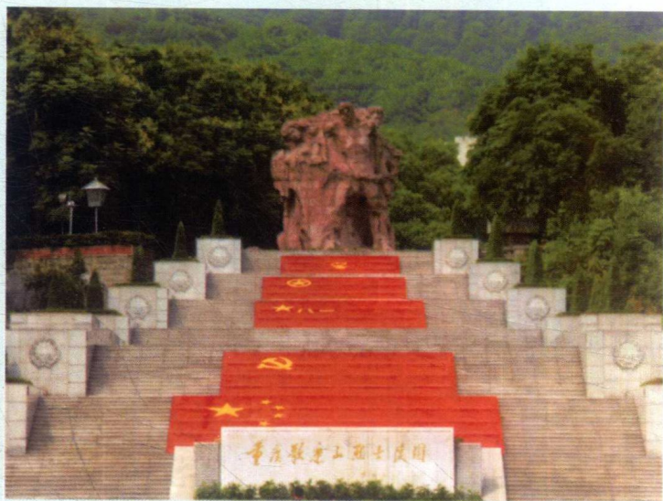
重庆歌乐山革命烈士陵园