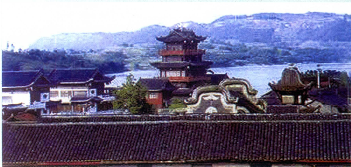
抗战时期大后方的文化中心之一——宜宾李庄古镇