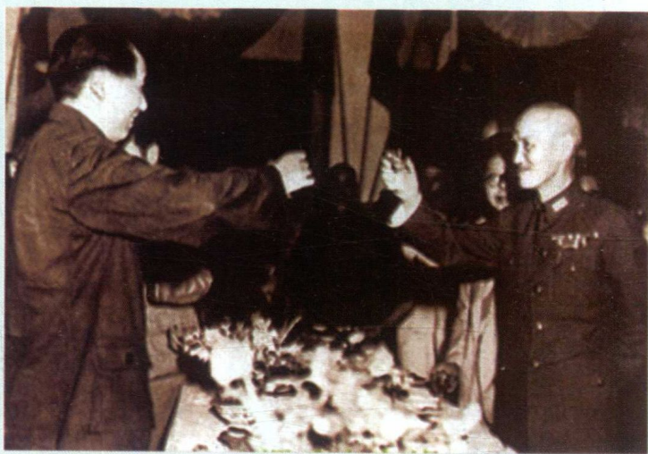
1945年重庆谈判期间的毛泽东与蒋介石