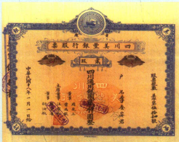
四川美丰银行股票