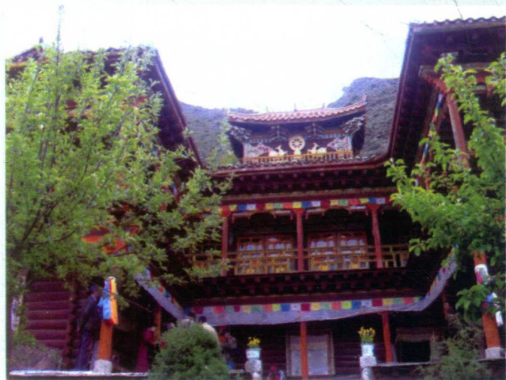
藏传佛教格鲁派寺院——甘孜白利寺