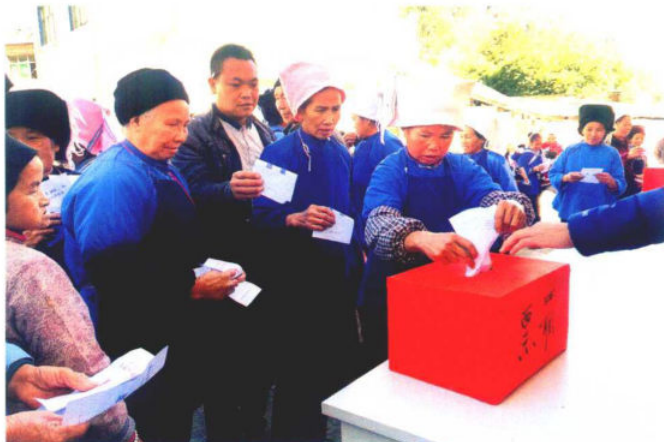
2016年11月10日是惠水县县镇两级人大换届选举日，惠水县各选区分别举行县镇人大代表选举。图为雅水镇大龙村选举现场