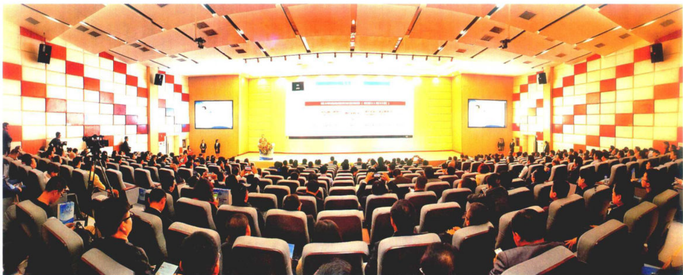
2016年12月12日，资本市场助推脱贫攻坚百鸟河大会在惠水县举行。图为大会现场