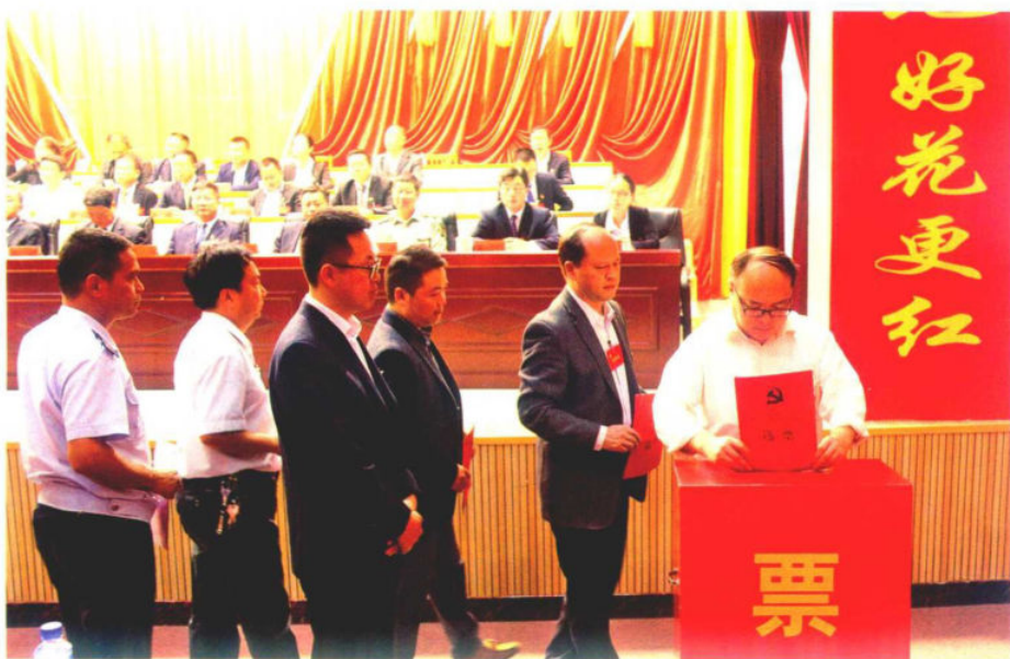
党代表投下庄严的一票