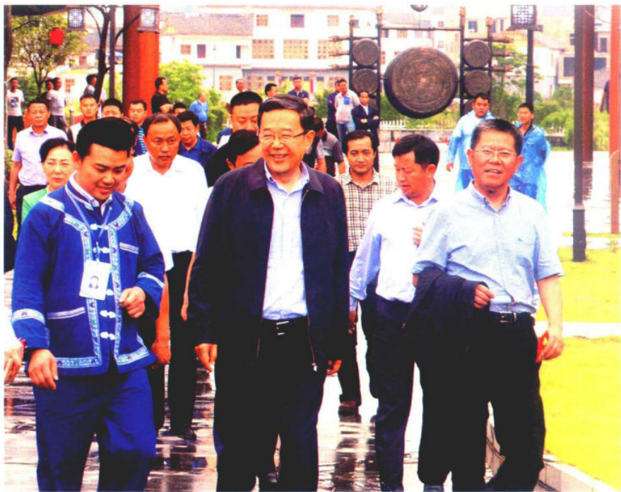
2016年5月13日，贵州省长孙志刚（中）考察惠水好花红电商一条街