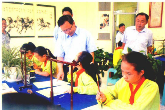
2016年6月29日，“贵州省教育工程现场调度会”在惠水召开。图为贵州省教育厅厅长王凤友（中）在惠水县县长王文旭（右一）陪同下到濠江实验小学现场观摩，了解惠水县义务教育工程建设情况