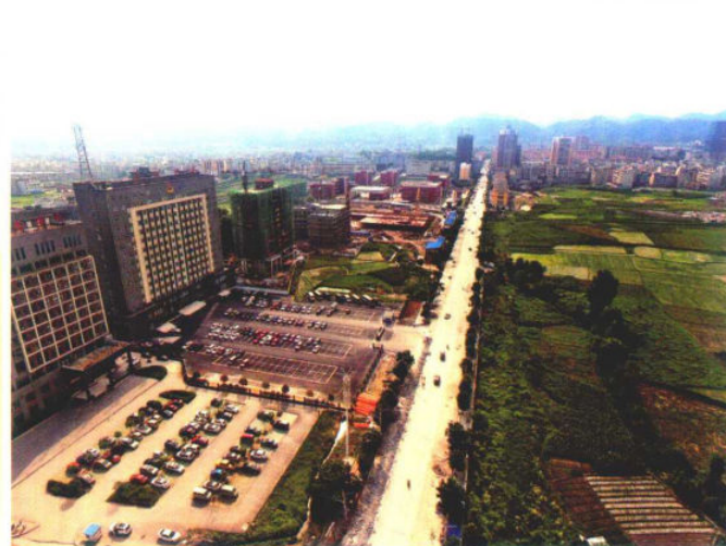
纸酒大道改造工程