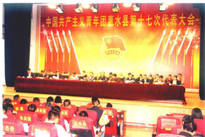
2016年4月26日，共青团惠水县第十七次代表大会召开。图为大会会场（团县委）