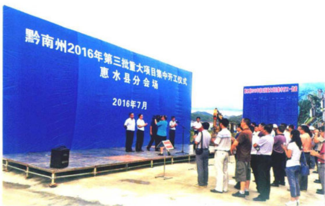
2016年7月6日，惠水县举行2016年第三批重大项目集中开工仪式