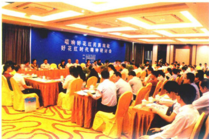
2016年6月4日，“唱响好花红民族绚歌·好花红时代精神研讨会”在惠水县召开