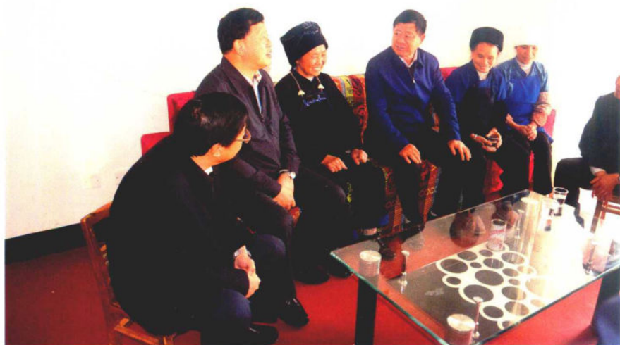
2016年4月8日-9日，全省第一次项目建设现场观摩会第二观摩组走进惠水。图为贵州省政协主席王富玉（左四）在惠水经开区易地扶贫搬迁安置点与搬迁农户交谈，了解生产生活情况