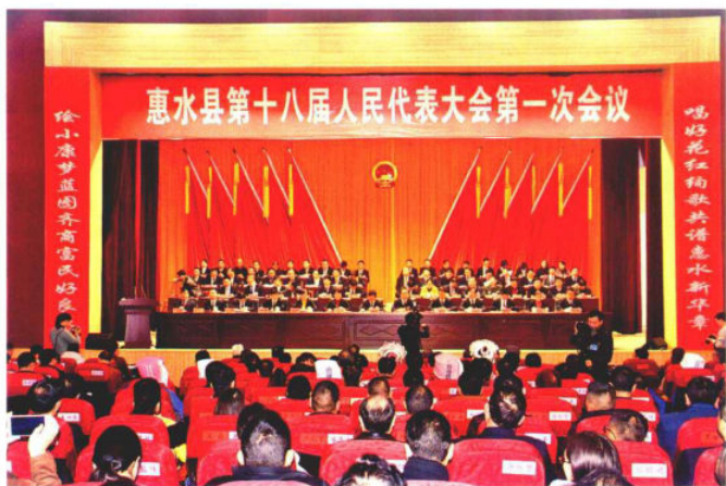
2017年1月6日，惠水县第十八届人民代表大会第一次会议召开。图为会场（县人大办）