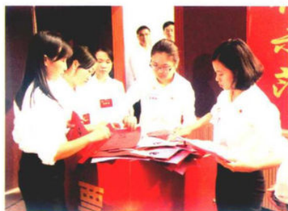
工作人员检查选票