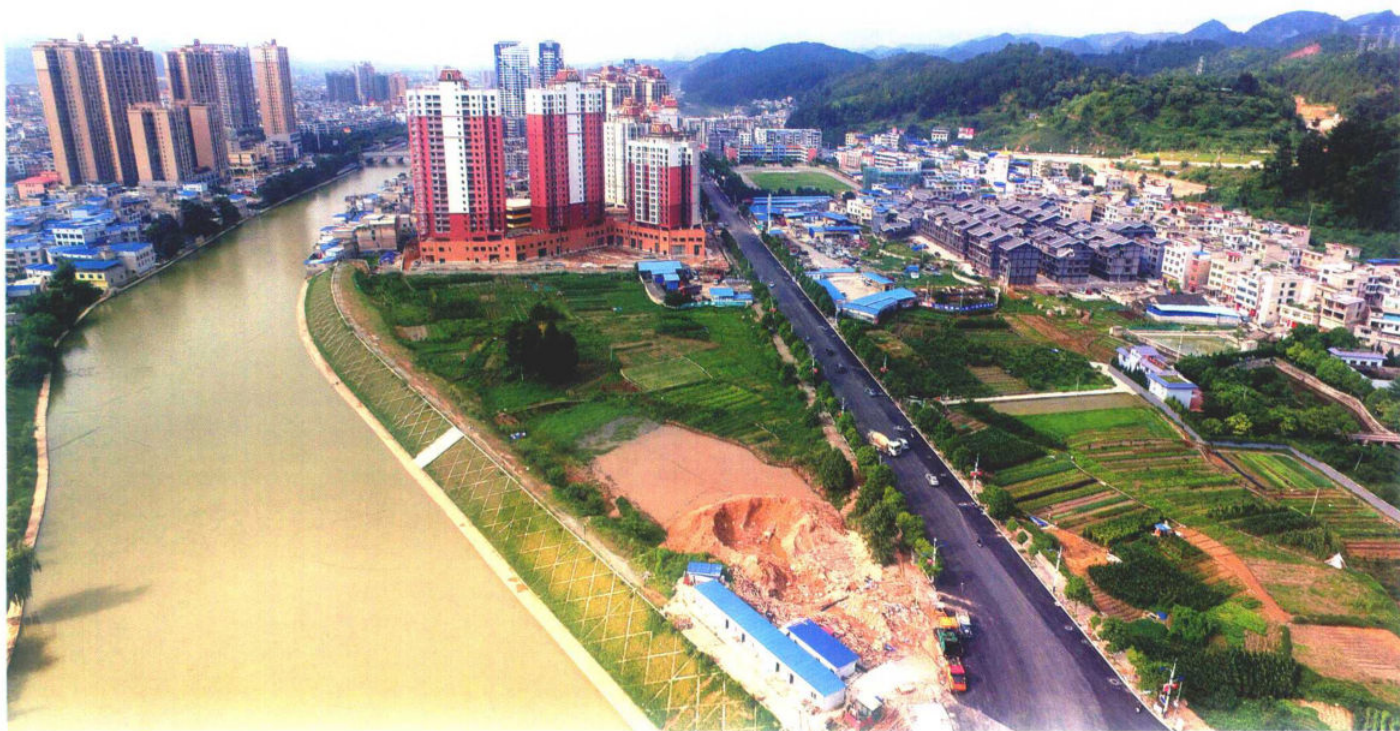
白果大道改造工程