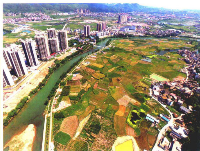
建设中的米丹湿地公园