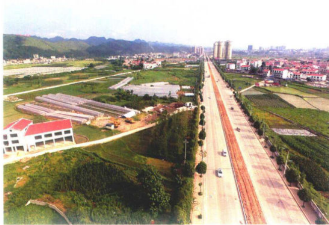
惠高大道改造工程