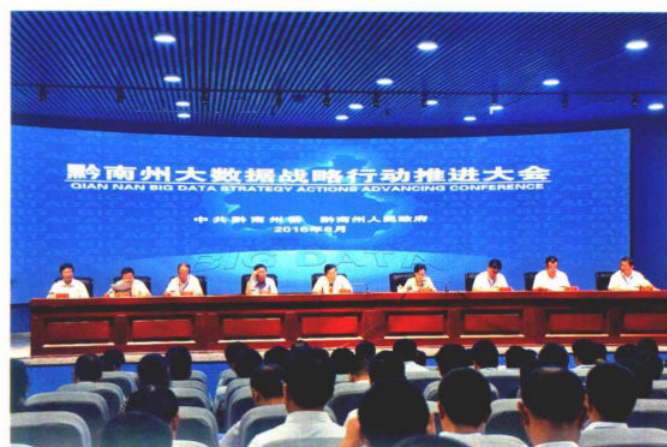
2016年8月26日，黔南州大数据战略行动推进大会在惠水百鸟河数字小镇召开