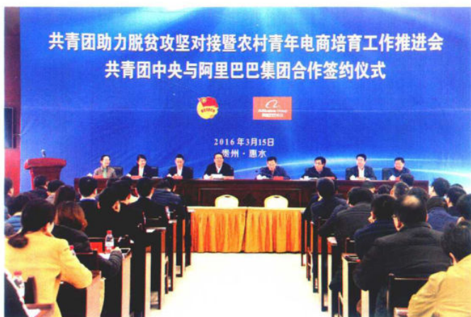
2016年3月15日，共青团助力脱贫攻坚对接暨农村青年电商培育工作推进会在惠水县召开。图为共青团中央与阿里巴巴集团举行合作签约仪式