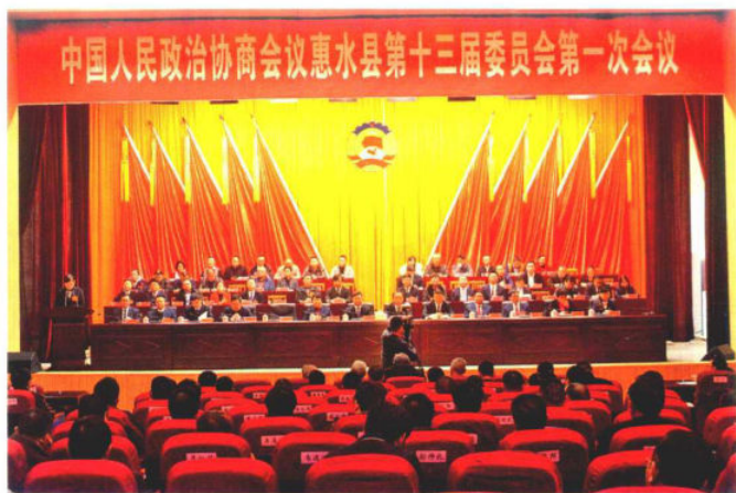
2017年1月5日，政协惠水县第十三届委员会第一次会议召开。图为会场（县政协办）