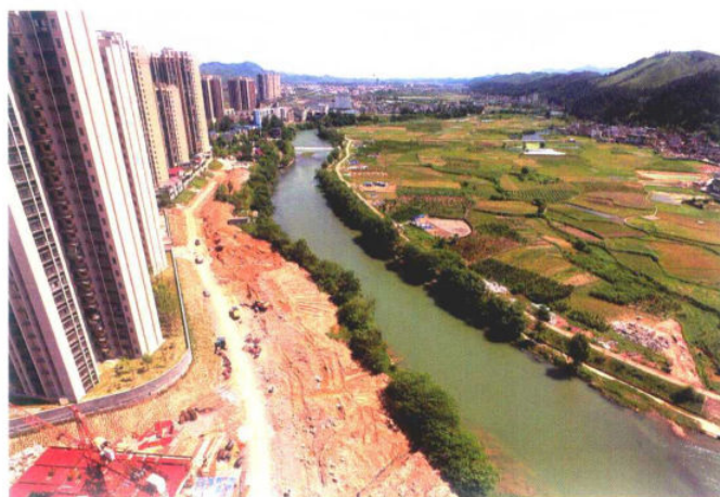
建设中的河滨路朝顺段项目