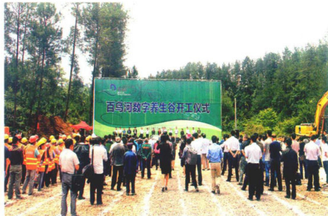
2016年5月14日，闻康集团中医药大健康养生谷项目开工仪式在百鸟河数字小镇举行