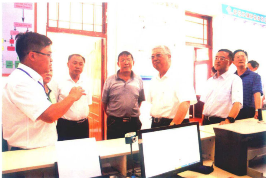
2016年6月23日，民政部部长李立国（右三）在贵州省副省长陈鸣明（右二）陪同下到惠水县好花红镇好花红村实地调研留守儿童相关工作情况