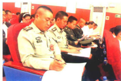
驻惠部队党代表认真阅读报告