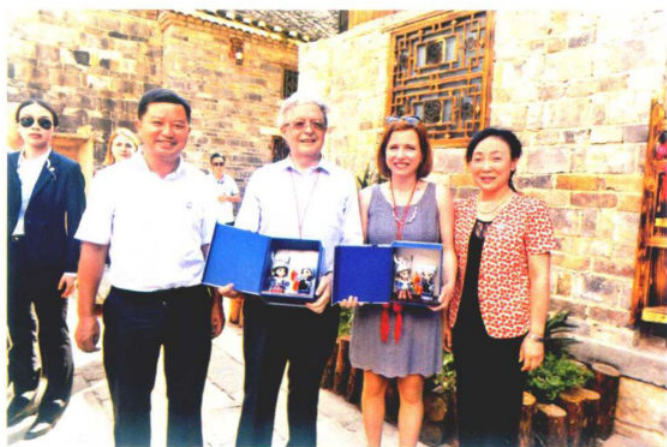
2016年7月9日，来黔出席生态文明贵阳国际论坛2016年年会的瑞士国民院议长克里斯塔·马克瓦尔德到好花红镇好花红村考察少数民族地区经济文化建设情况。图为克里斯塔·马克瓦尔德（右二）与黔南州长向红琼（右一）、惠水县委书记万庆华（左一）合影