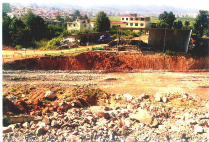
惠安大道建设现场（县扶贫开发局）