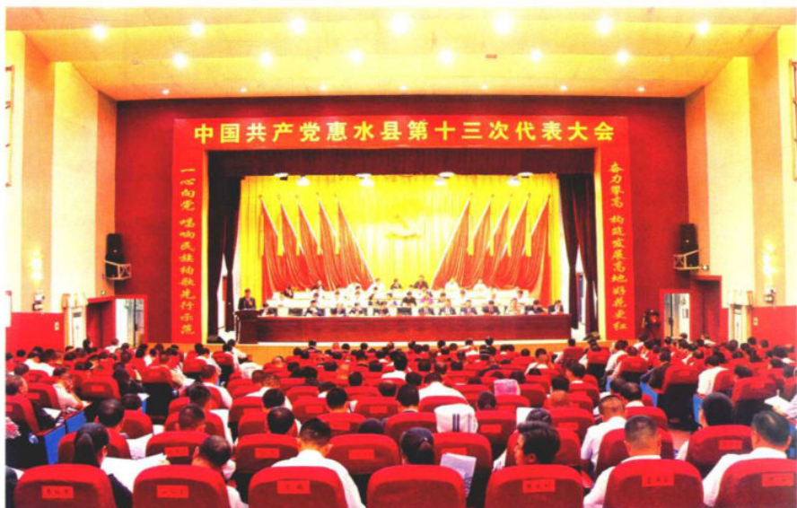
2016年10月26日，中国共产党惠水县第十三次代表大会召开。图为大会现场