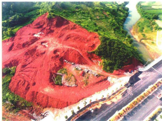
建设中的贵州财经大学商务学院安置区