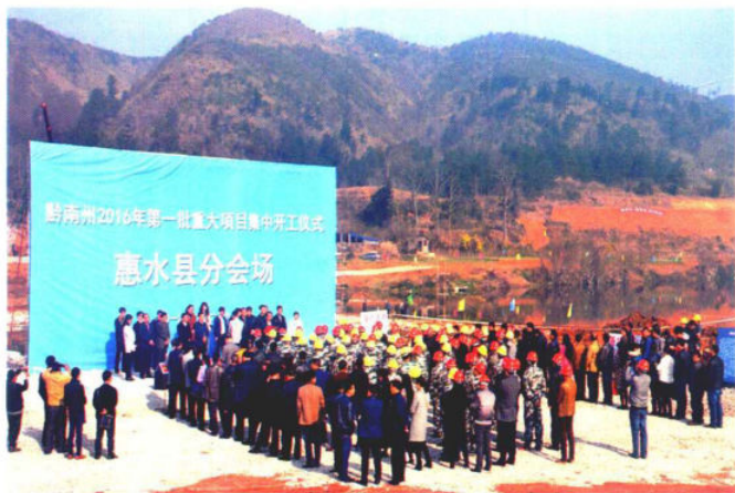
2016年2月29日，惠水县举行第一批重大项目开工集中仪式