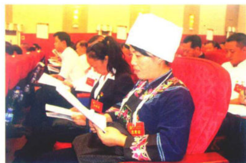
参会少数民族党代表认真听取报告