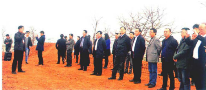
2016年3月3日，黔南州农业扶贫工作现场推进会走进惠水县分会场好花红镇。图为黔南州各县市参会人员听取情况介绍（好花红镇）