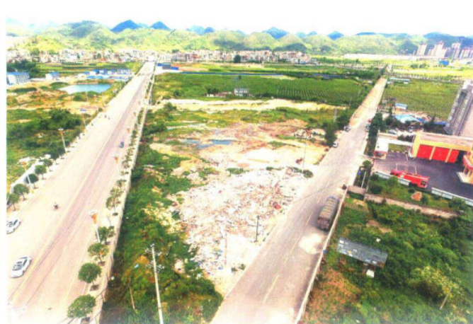
即将开工建设的县人民法院审判中心项目