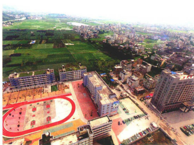
县委党校基础设施项目