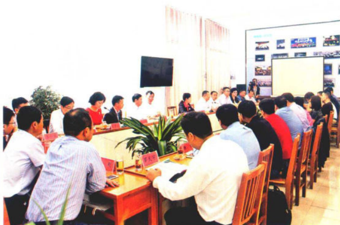
2016年5月14日，联星之星创业CEO游学座谈会在百鸟河数字小镇召开