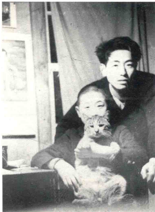
弟弟（图下）比我小「岁」 我进大学那年他还是小学生 所以很少在一起玩耍 图为我们跟猫咪「尼克」在一起