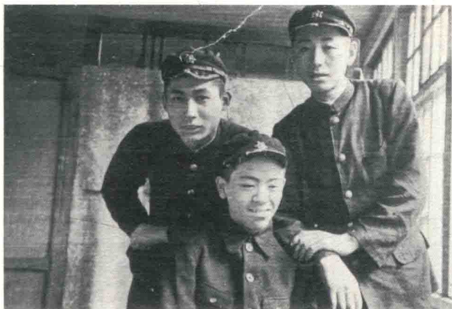
札幌第一中学（札幌一中） 时代的朋友和我（右） 当时我就个子较高