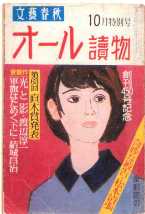
文艺春秋《纯读物》10月刊 内刊载直木奖获奖作品《光与影》的封面