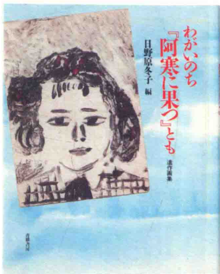
《魂断阿寒湖》 遗作画集