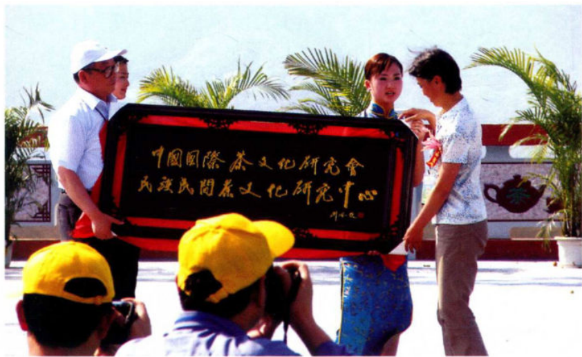
茶文化研究中心授牌仪式

贵州省内由各市、州、县、区举办的各类茶文化活动，更是此起彼伏、层出不穷，贵定云雾贡茶杯节、奢香杯炒茶大赛、水城春茶杯炒茶大赛、太极红杯古树茶大赛……百花齐放，吐艳争辉，各民族的茶歌、茶舞、茶艺，以及文人墨客、贤达雅士的茶诗、茶词、茶赋、茶画、摄影等活动，汇成了浩瀚的茶文化海洋，当你置身其中，清香甘爽的各种名优茶使你回味无穷、心旷神怡，多彩多姿的茶文化令你流连忘返、称快陶醉。