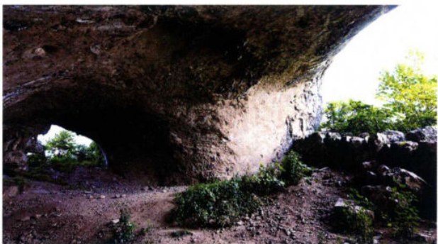
穿洞古人类文化遗址