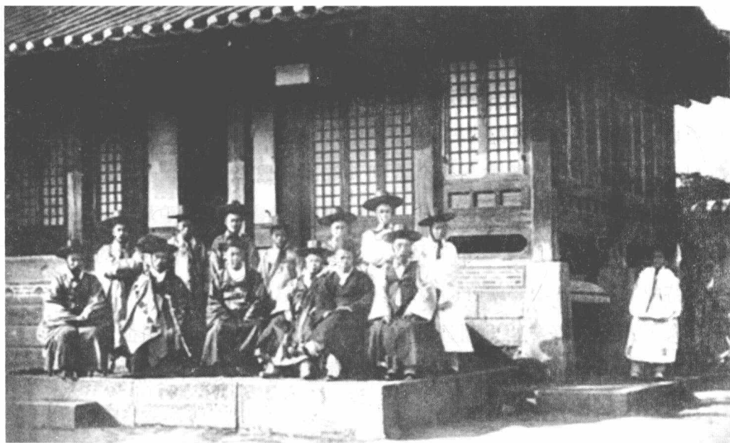
1885年时的朝鲜统理交涉通商事务衙门（外务部）官员合影

《江华条约》签订后，日本加紧了对朝鲜的侵略步伐。这时候，一贯奉行妥协外交政策的李鸿章也有一种担心，他担心日本觊觎朝鲜，势必会引起列强对这一地区的群起角逐。在与周边国家的“藩属”关系中，清政府一直把朝鲜视为最为重要的屏障，因为东三省是清朝“龙兴之地”，这一地区又与朝鲜有着唇齿相依的关系。一旦朝鲜被日本吞并，中国东三省必然受到日本更大的威胁，进而影响到王朝统治。简单来说，祖宗发祥起家之地都被打没了，还谈什么颜面？1879年，日本吞并琉球后，清政府对此的担忧更加强烈。恭亲王奕訢、李鸿章，甚至垂帘听政的慈禧太后都在思考着如何未雨绸缪，防范日本对朝鲜的侵略。