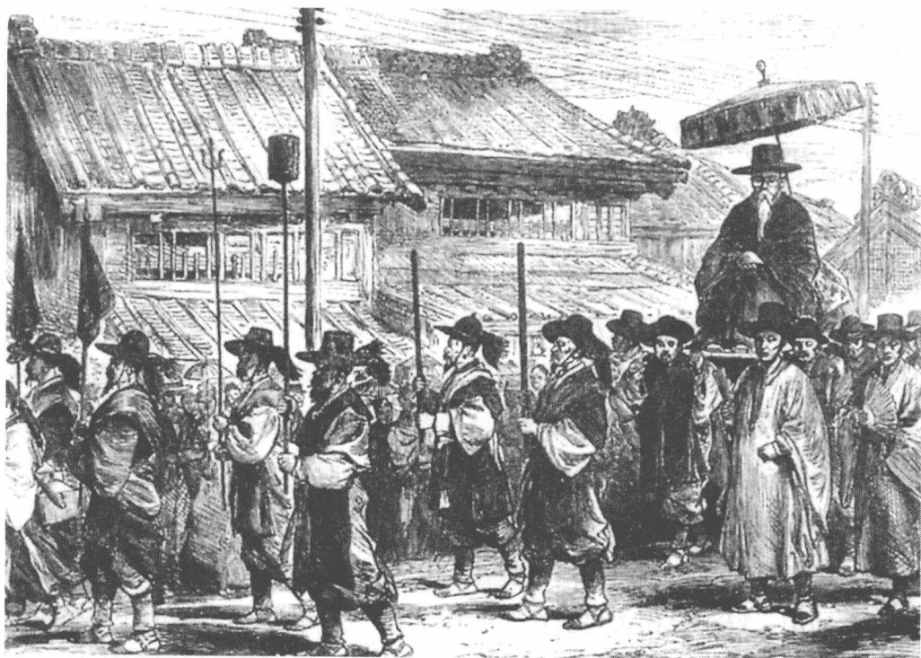
1876年朝鲜修信使金绮秀率领75人组成的使团访问日本

在信中表示，希望与各国尽快展开谈判。但是，信函却没有寄给何如璋。因为日本方面表示了对中国决不关照，何如璋是通过日本官方的报纸看到这一消息的。