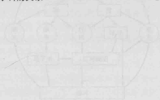
图 1-1 水的自然循环

受、蒸发的水蒸气随气流运动到高处，然后以雨、雪等形式落到地面。一部分形成地表水，一部分渗入地下形成地下水，一部分又被蒸发返回大气。地表水和地下水最终被河流海洋、流纹岩降水自然循环。