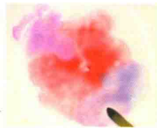
在主要颜色四周调色