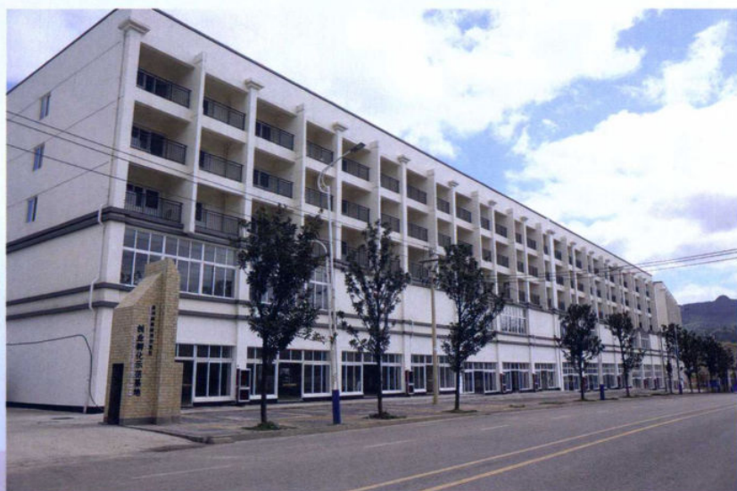
>>纳雍工业园区一角