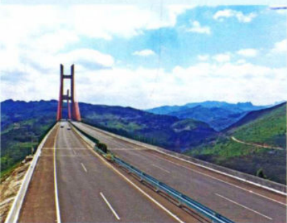
>>武佐河特大桥