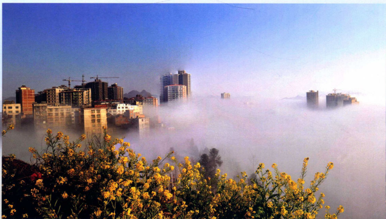
>> 希望之城