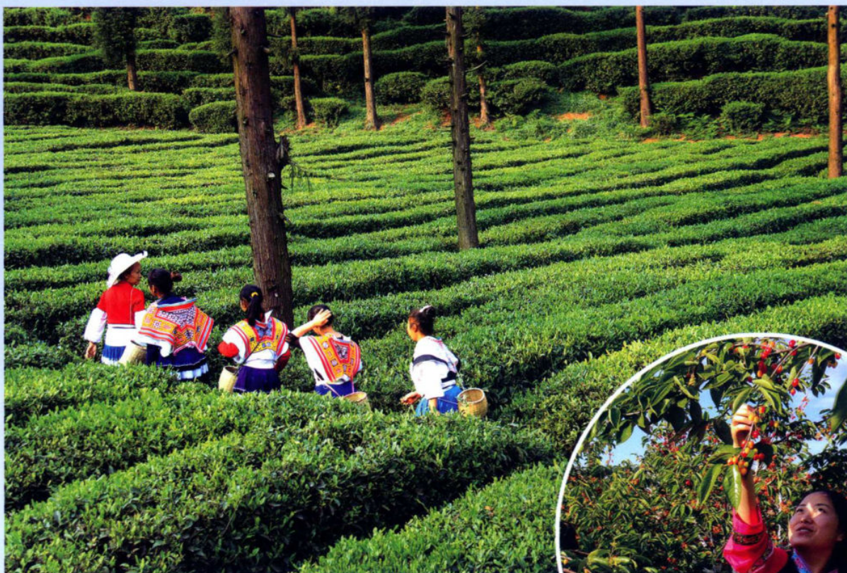
>> 高山生态有机茶示范园