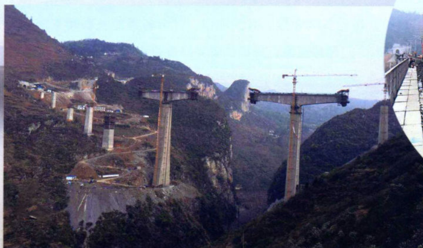
»织纳铁路在建中的武佐河大桥