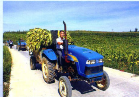
>>便利的通村水泥路