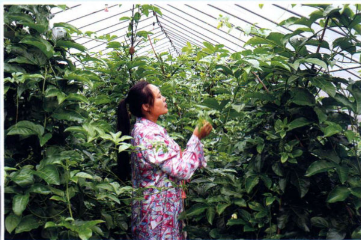
>> 贵州康泰阳光生态环保有机产业科技 有限公司的种植园