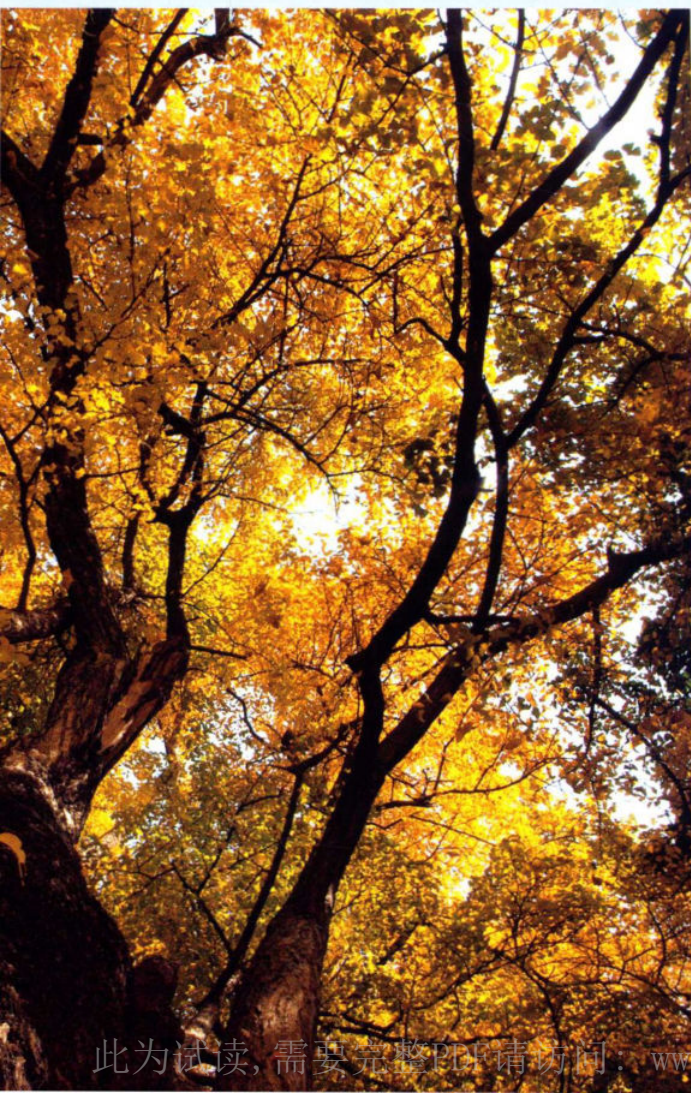
>> 水东乡千年古银杏