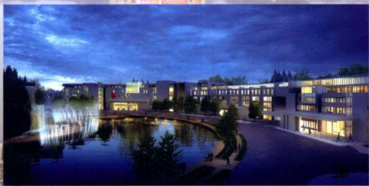
>>煤制油项目效果图 资料图