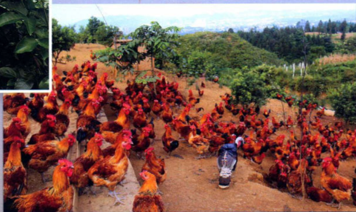
>> 满山的“红衣卫士”