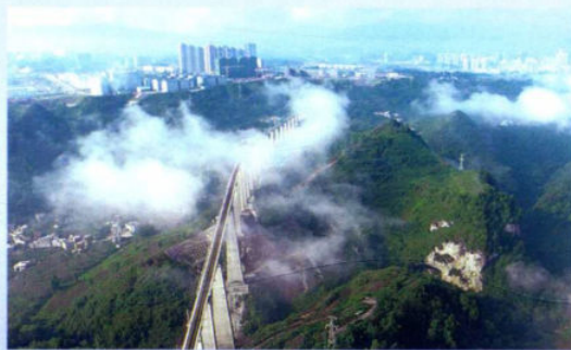
>>铁路修到纳雍城