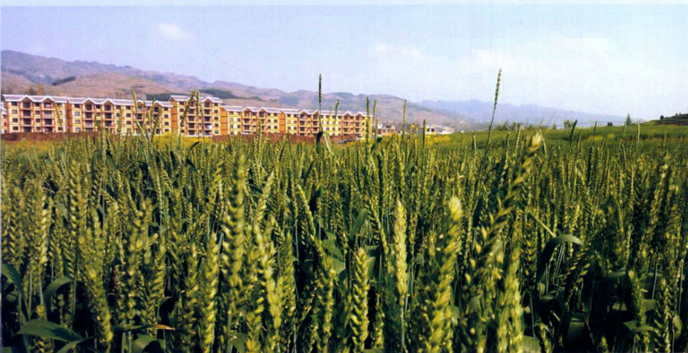
»百兴镇小麦种植基地