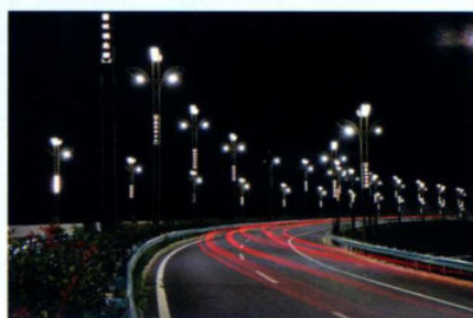
>>发展大道景观 潘中泽|摄 >>珙桐大道景观 潘中泽|摄