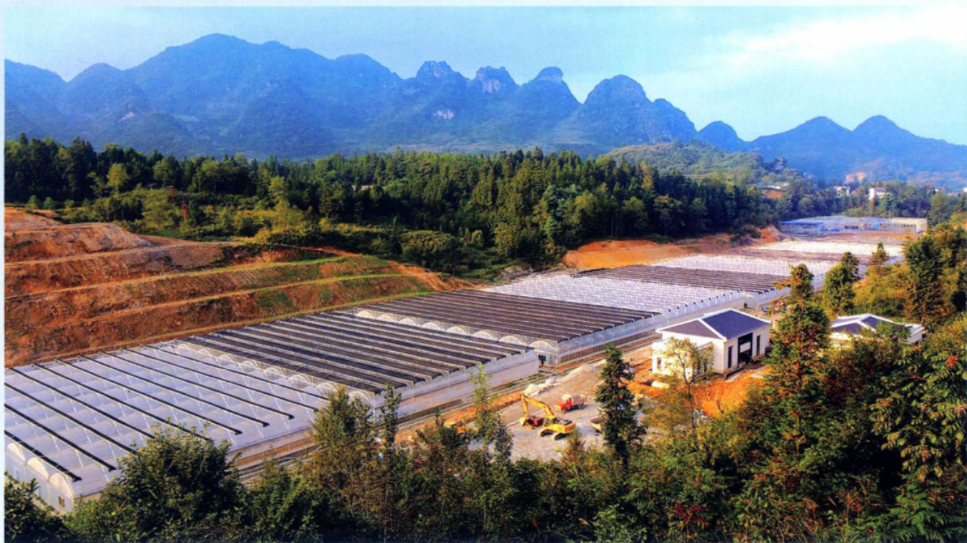
>>路尾坝现代循环高效农业示范园区