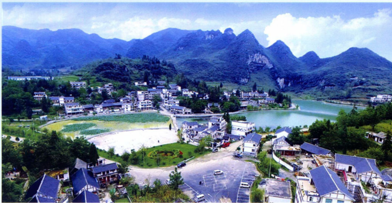
>>航拍美丽乡村路尾坝