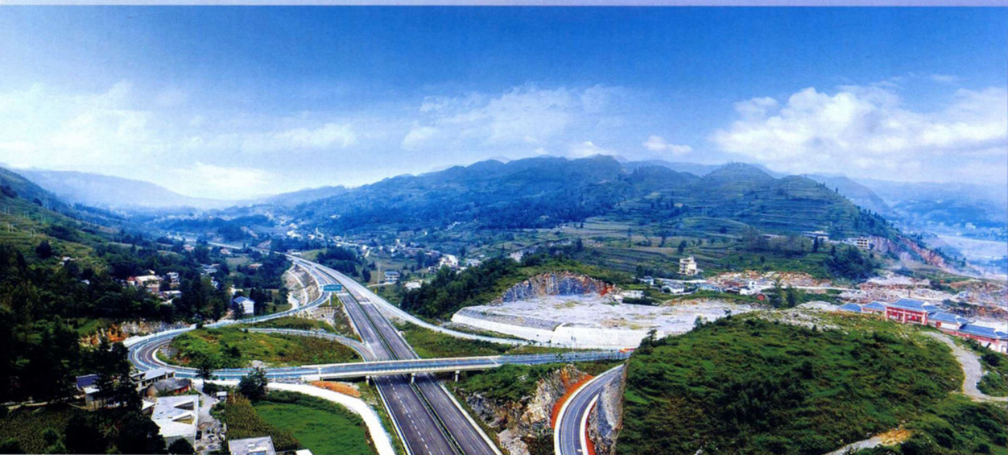
>>厦蓉高速纳雍出口互通