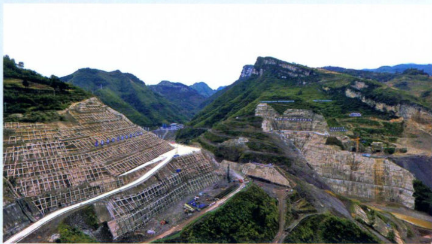
>>建设中的夹岩水利枢纽工程