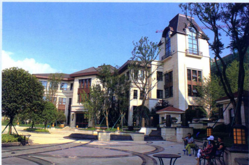
»纳雍新区香蜜欧城一角

71个重点项目建设快速推进，累计完成投资177.97亿元，占年度计划的114.68%。保障和落实5000万元项目前期工作经费，谋划了8大类902个项目，为加快发展强化了项目支撑。