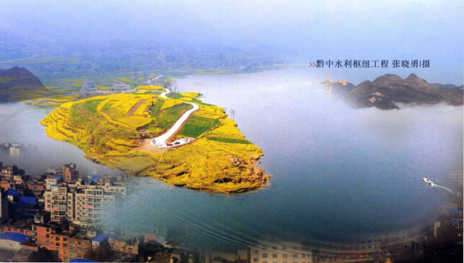
>>黔中水利枢纽工程