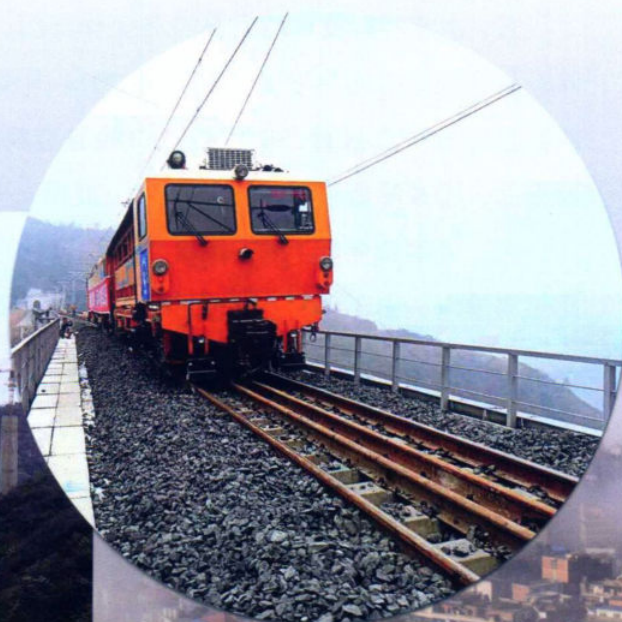
»织纳铁路铺轨车在作业