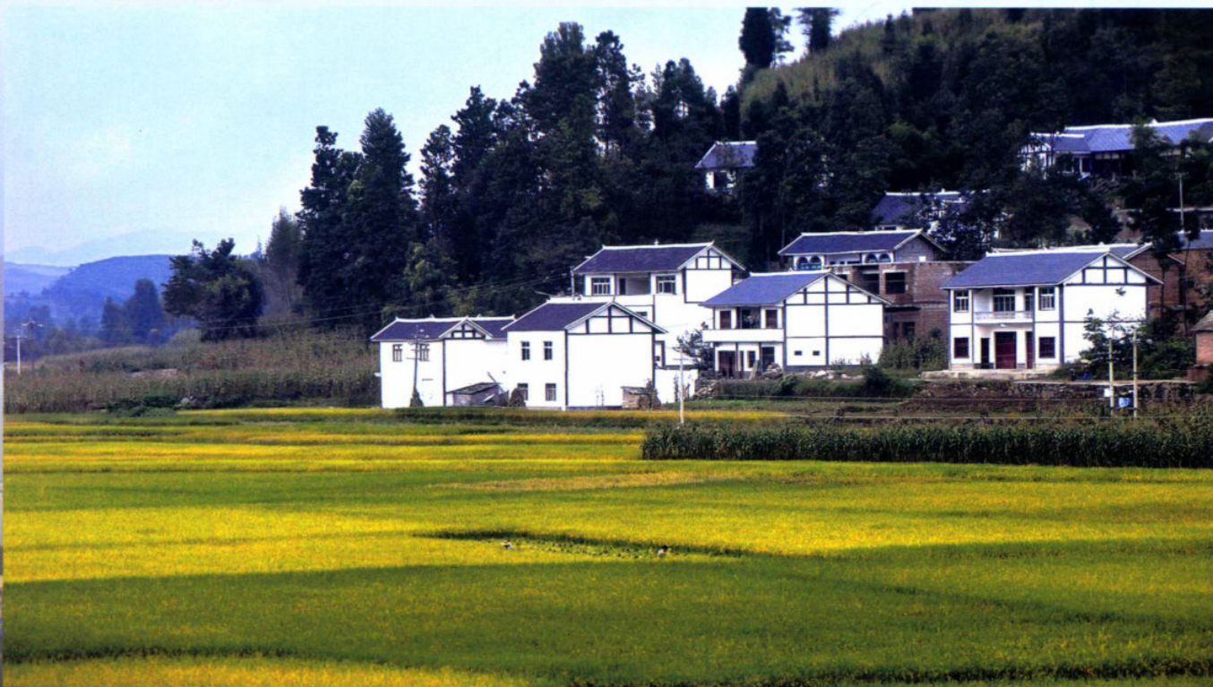
>>希望的田野

实施“四在农家·美丽乡村”基础设施“六项行动计划”，小康水完成农村耕地灌溉1.68万亩，小康电完成投资1063.2万元，小康路完成821公里，新增50个行政村通宽带，建成小康房280户，小康寨完成投资7500万元，农村生产生活条件持续改善。