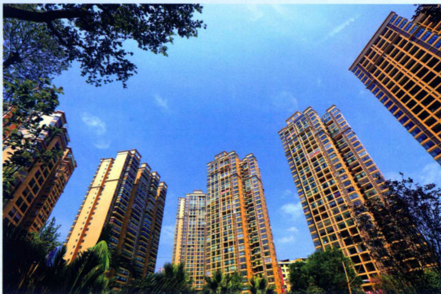
>>拔地而起的现代建筑