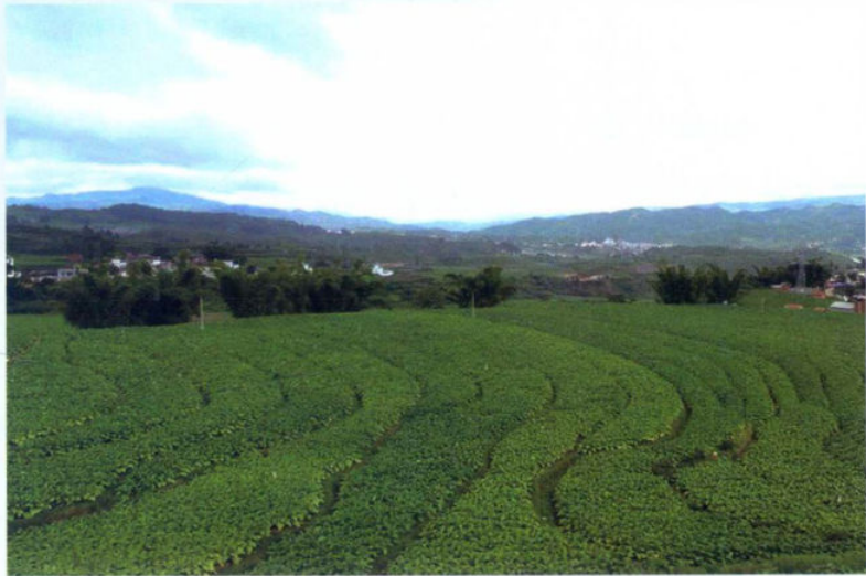
»龙场镇烤烟种植基地

农业板块经济加快发展，完成特色产业种植16.16万亩，新增畜禽养殖13.5万头（羽），种植烤烟2.4万亩，收购烟叶6.4万担。粮经作物比例从47.9:52.1调整到46.5:53.5。3个省级农业示范园区加快推进，市级以上农业龙头企业增加到31家，新增农村专业合作社193个，实现农业增加值22.78亿元，增长6.9%。工业经济平稳运行，经济开发区新增入驻企业7家，大拓新能源、雍达针织等一批产业项目建成投产。