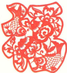
图 1-1 福字剪纸

用文字来做吉祥图形,效果直接。图片中的“福”(图 1-1)就是用剪纸的手法,图中有鱼、花,枝叶相连构成福字的骨架,内容丰富,使图案变得喜气洋洋。