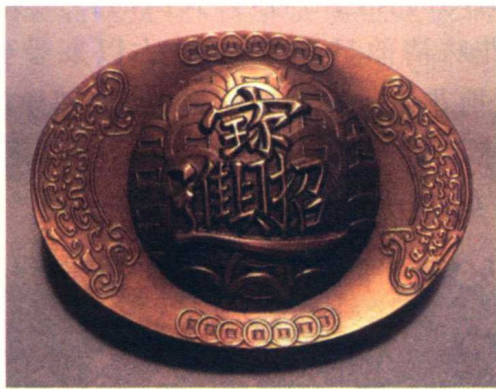
图 1-5 招财进宝

这个纹样同样是运用叠字法组成的新字“招财进宝”(图 1-5),组字方法更令人拍案叫绝,我们可以发现“宝”字和“财”字共用一个了“贝”字,这种偏旁的相互借用,使新字更紧凑更有趣。