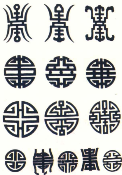
图 1-2 团寿