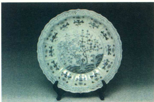
图 1-9 《岁寒三友》青花大盘

松、竹、梅组合或是梅、竹、石的组合被人们称为岁寒三友，冬日里松、竹长青，梅花更是傲寒而绽，文人喜欢借此来抒发自己的情感。