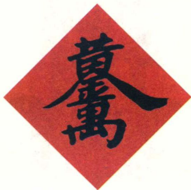
图 1-6 黄金万两