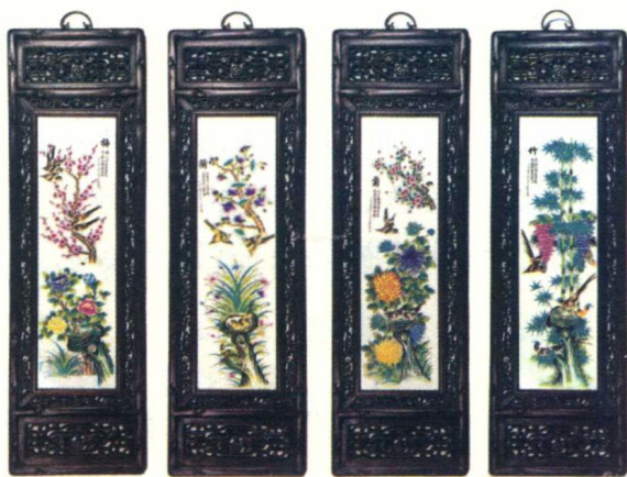
图 1-8 梅兰菊竹挂屏

梅、兰、竹、菊被称合成为“四君子”(图 1-8),被历代文人墨客用来表达正直、坚贞的气节。