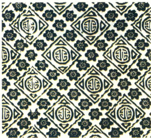
图 1-7 寿眉舒展印花布

梅花,以其清冷的香色出名,为我国的传统名花之一,其花形美丽而不妖冶,花味清韵且又芳香,自古以来受到文人墨客的喜爱。中国文人以梅花作人格的比拟,为最高理想的象征。梅花有五个花瓣,也寓意五福吉祥。寿眉舒展印花布(图 1-7),是一种用梅花排列的方格布样,方圆结合,图样大方美观。