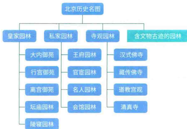
图 1 北京历史名园分类

北京历史名园数量众多，据园林部门专项研究显示，北京市域范围内，园林格局及园林要素至今尚存的历史园林共有一千余处（有历史记载的共计三千余处）。2015 年，园林部门按照历史特色与价值、园林艺术文化科学价值、传统格局和风貌保存状况三个指标对北京的历史园林进行评价筛选后（图 2），公布了首批 25 处历史名园。其中皇家园林包括颐和园、北海公园、景山公园、中山公园、劳动人民文化宫（太庙）、故宫宁寿宫花园、故宫御花园、香山公园、圆明园遗址公园、天坛公园、