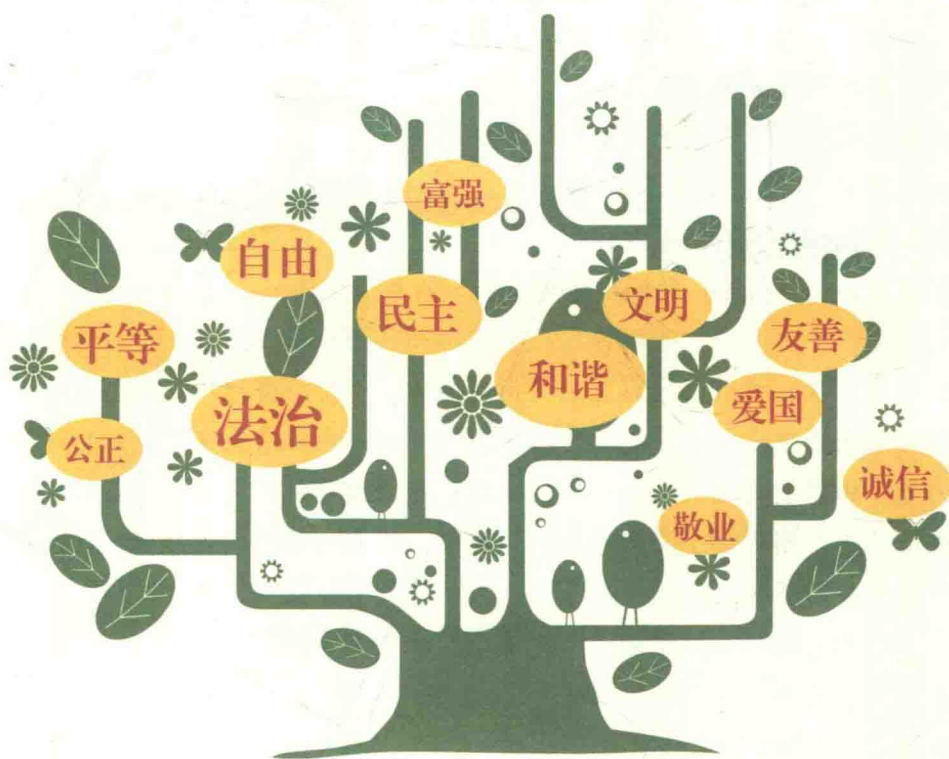
一棵树上十二个果