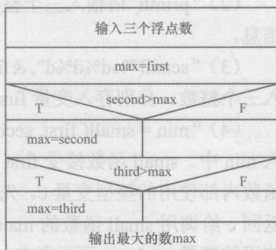
图 1-1 N—S 流程图