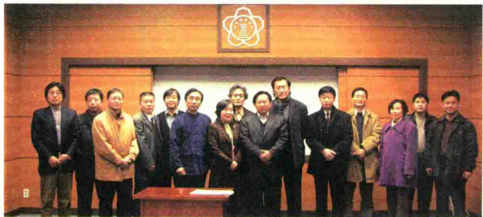
2004年12月20日，访问韩国庆北大学。