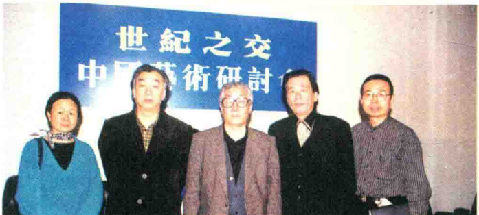
1999年4月，参加“世纪之交”中国艺术研讨会。