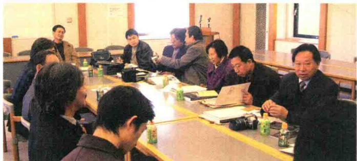
2004年12月13日，访问日本精华大学。