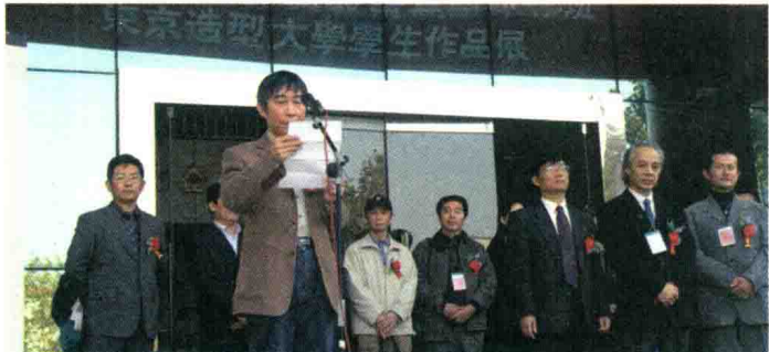
建筑与景观设计学院举办“日本室内设计与教育”高级研修班。