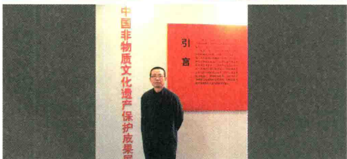
2004年1月1日，学报领导参加“中国非物质文化遗产保护成果展”。