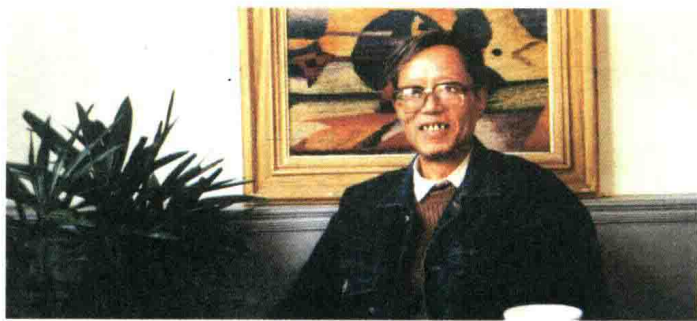
学报领导参加中国工艺美术学会年会。