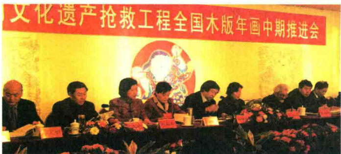
2004年1月8日，参加“中国民间文化遗产抢救工程”全国木版年画中期推进会。