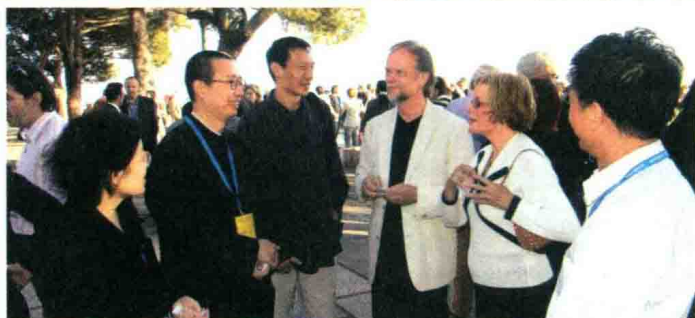
2005年5月，参加里斯本欧洲艺术设计院校联盟大会。