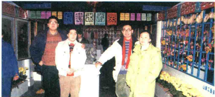
1997年1月，主办“大过年”民艺展。