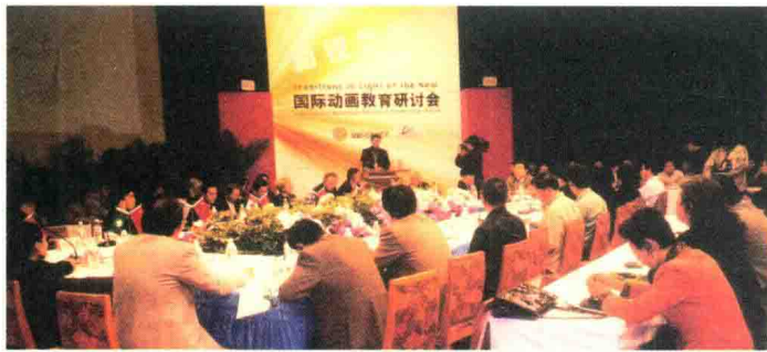
2002年4月3日,参加“BBI-CILECT 国际动画教育研讨会”。