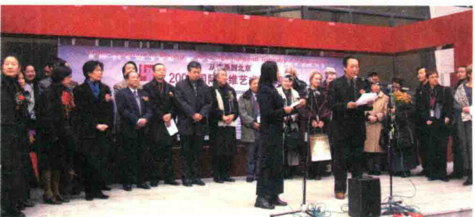
2002年11月22日,学报领导担任“从洛桑到北京”国际现代纤维艺术双年展(北京展)评委。