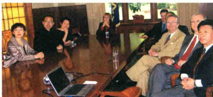
2005年5月20日，访问美国俄勒冈大学。