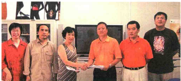
数字艺术与传媒学院承担教育部全国“IT&AT”教育工程数字艺术设计培训项目。