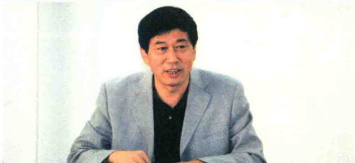
2005年4月，报道山东工艺美术学院教职工代表大会。