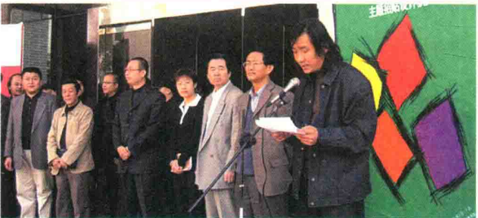
视觉传达设计学院举办山东省四高校“生命&健康”主题招贴设计大赛。