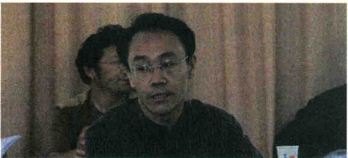
2002年9月,参加高等院校设计艺术专业课程教学系列教材出版工作会议。