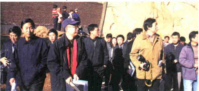
2002年11月1日,学报领导参加“中国民间文化遗产抢救工程”榆次采样活动。