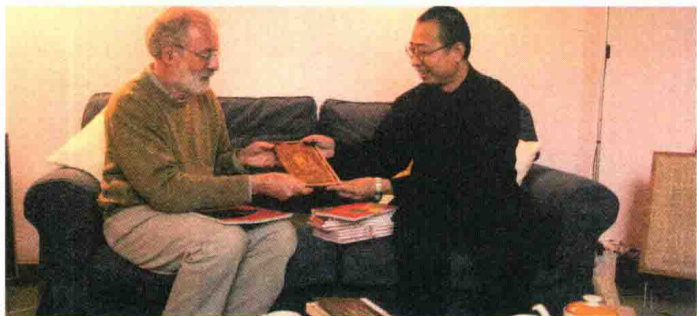
2004年10月16日，学报领导在英国杜伦大学拜访著名人类学家罗伯特·雷顿教授。