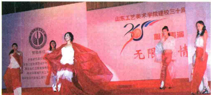
2003年10月26日，报道山东工艺美术学院建校30周年庆典活动。