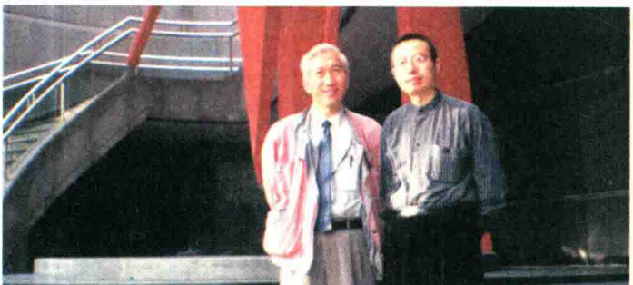
1999年4月，参加第九届全国美术作品展。