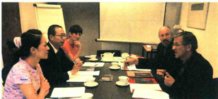
2005年3月30日，访问英国斯塔福郡大学。