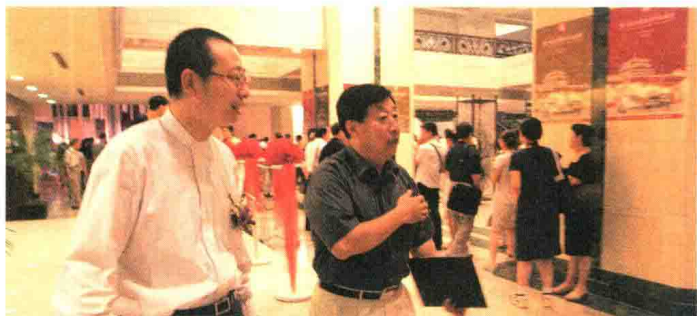
2004年8月19日，参加第十届全国美术作品展。