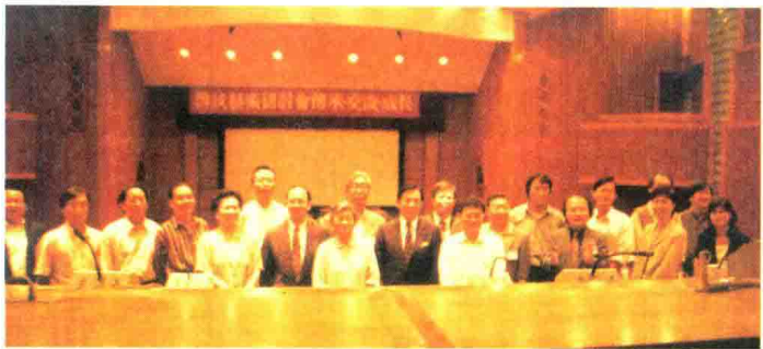
1998年5月，参加台湾传统艺术研讨会。