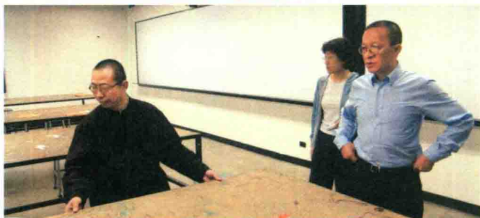
2005年5月16日，访问美国洛杉矶艺术中心设计学院。