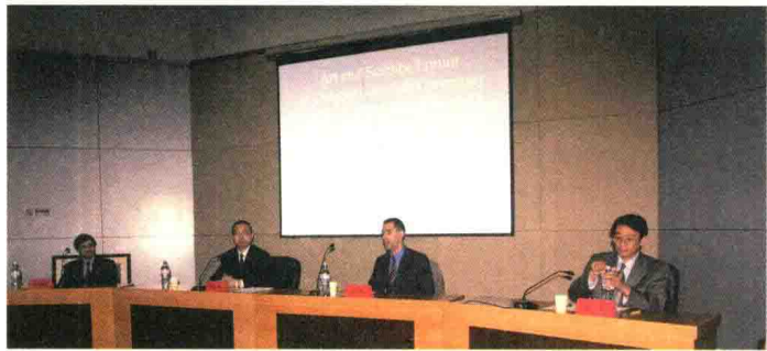
2004年11月1日，参加山东工艺美术学院“艺术与科学论坛”。