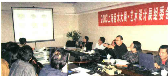
2003年11月4日，学报领导出席“2003上海美术大展·艺术设计展”。