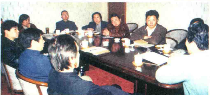
1999年，学报编辑部举办'99'设计艺术论坛。