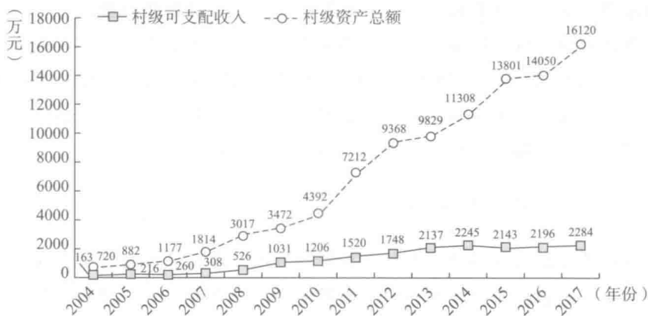
图1 东林村村级可支配收入和村级资产总额