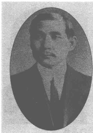
孙中山 ◎ 中国民主革命的先行者

中山详细介绍了俄国的十月革命，传达了列宁的思想方针。同时，也提出了国共合作的建议。孙中山听后觉得受益匪浅，但对于国共合作的建议，却还是有些犹豫，他更深入地询问马林：“先生所说的联合……”