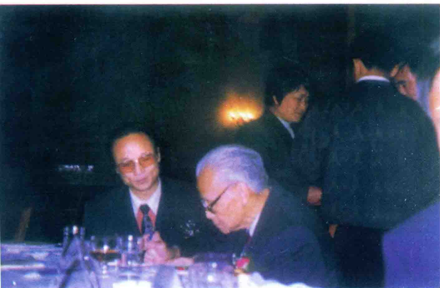
全国政协副主席程思远在人民大会堂约见王君总裁，并签名留念。