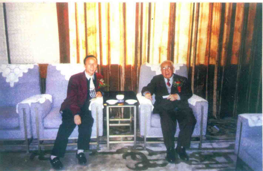
全国政协副主席卢嘉锡（右）在人民大会堂约见王君总裁。