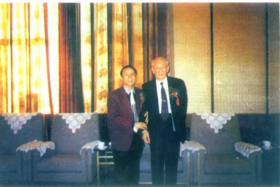
全国政协副主席朱光亚（右）和王君总裁在一起。