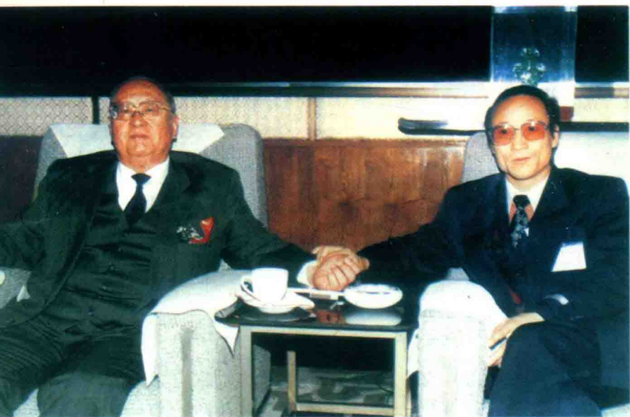
1994年10月7日，全国人大副委员长王光英(左)在人民大会堂约见王君总裁。图为王君总裁王光英副委员长诊脉。