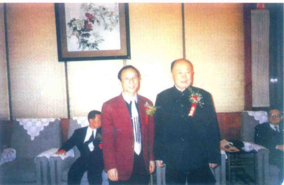
全国政协副主席马文瑞（右）在京与王君总裁合影留念。