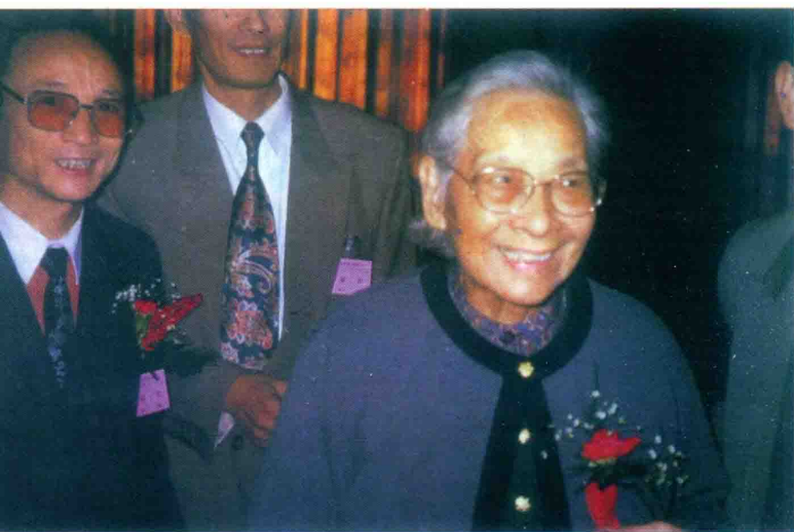
全国人大副委员长雷洁琼与王君总裁步入人民大会堂。