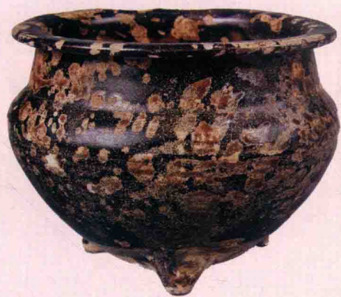
吉州窑黑釉玳瑁纹鬲式炉