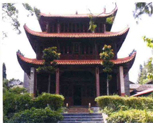
白鷺洲書院風月樓