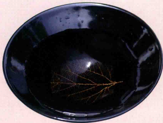
吉州窑木叶天目盏