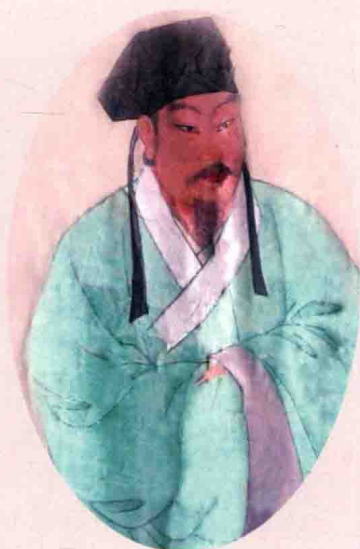
文天祥布衣画（文氏后裔保存）