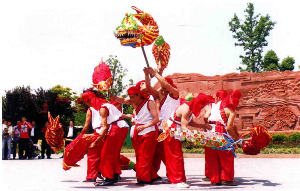
吉安县固江鲤鱼灯