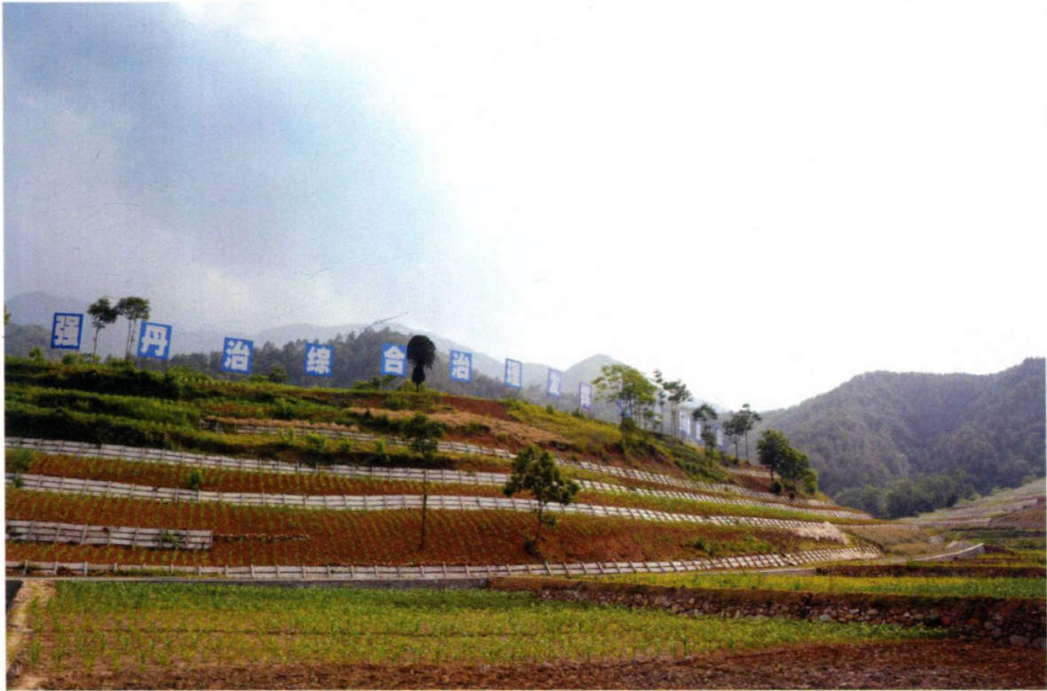
陕西省安康市汉阴县小堰沟流域治理项目现场