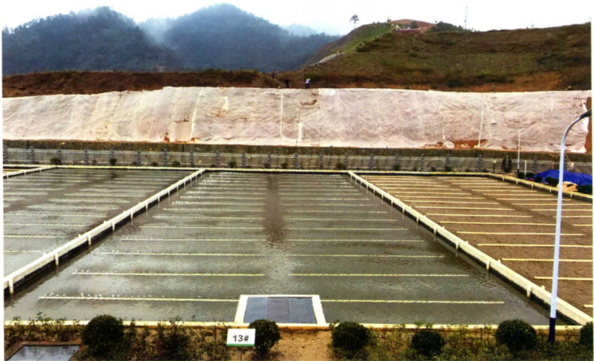
湖北省十堰市泗河污水处理厂尾水净化人工快渗工程