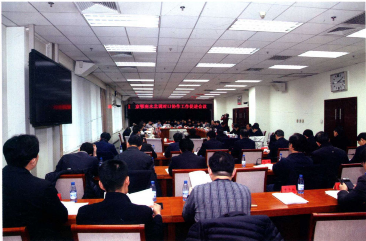
2018年2月28日，京鄂南水北调对口协作工作促进会议在北京召开