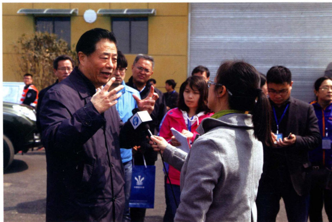
2016年3月24日，国务院南水北调办主任鄂竟平在新郑水质演练现场接受记者采访