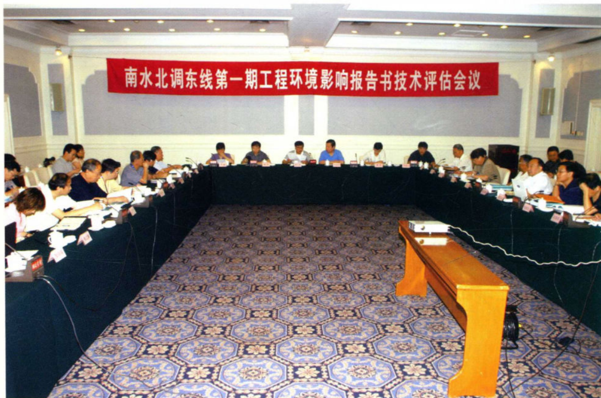
2006年7月10日，南水北调东线第一期工程环境影响报告书技术评估会议在北京召开