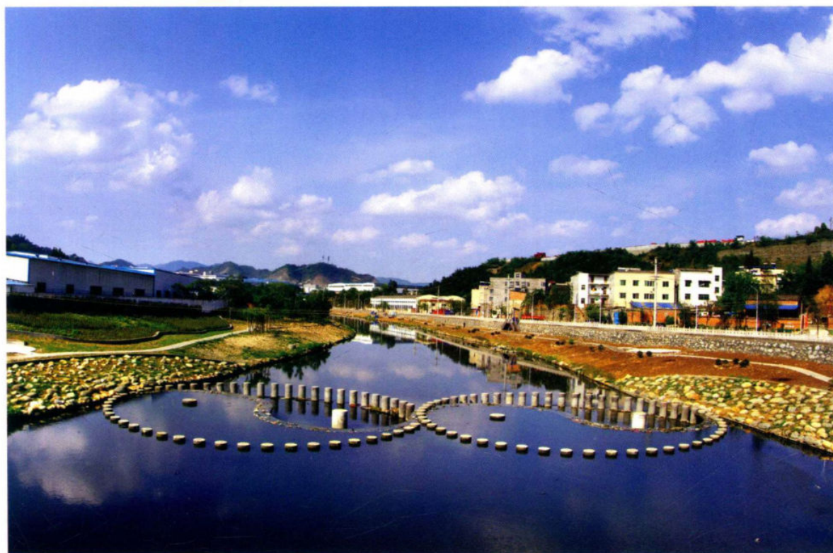
改造后的泗河河道宽阔平坦