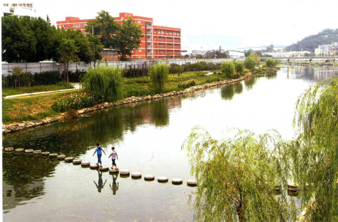
治理后的泗河马家河段河水清澈见底