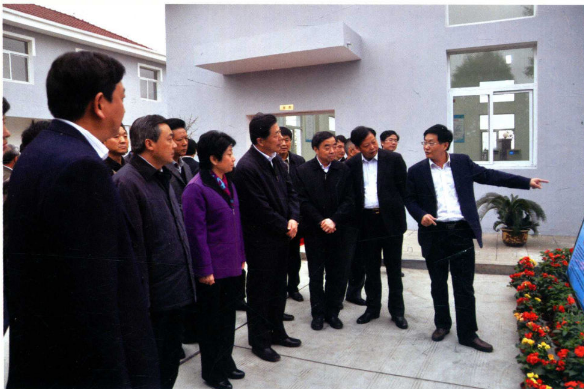
2010年11月24日，国务院南水北调办主任鄂竟平检查江都截污导流工程