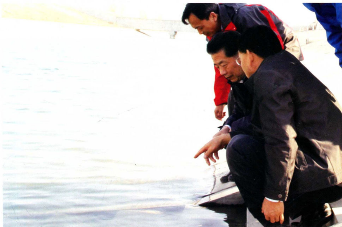
2014年11月8日，国务院南水北调办主任鄂竟平检查中线京石段工程水质监测工作