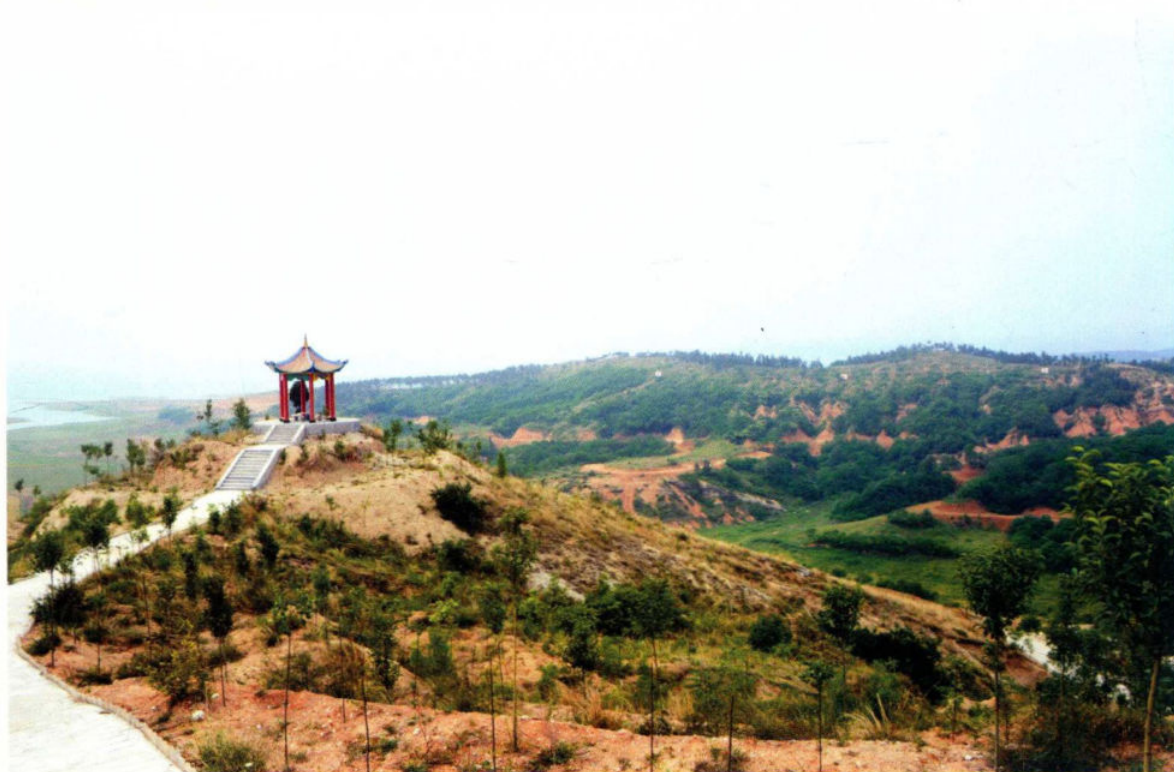
河南省淅川县马蹬镇库区生态带建设