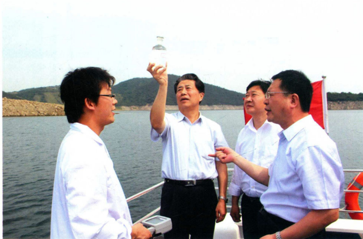
2012年6月20日，国务院南水北调办主任鄂竟平察看丹江口水库水质