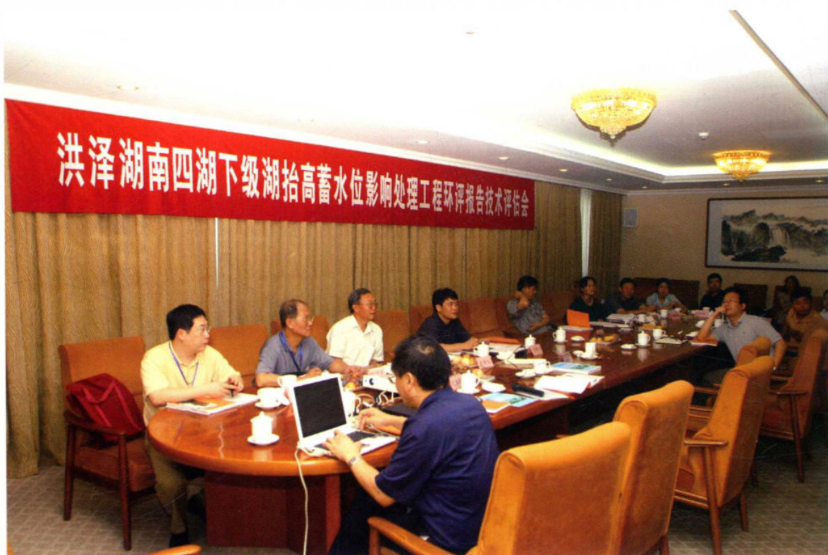
2006年7月10日，南水北调东线洪泽湖南四湖下级湖抬高蓄水位影响处理工程环评报告技术评估会在北京召开