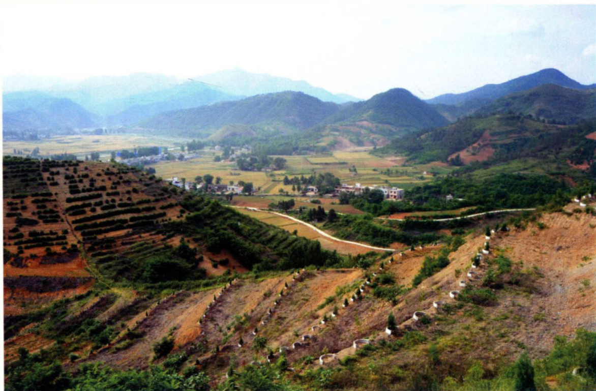
河南省西峡县东官庄小流域治理工程