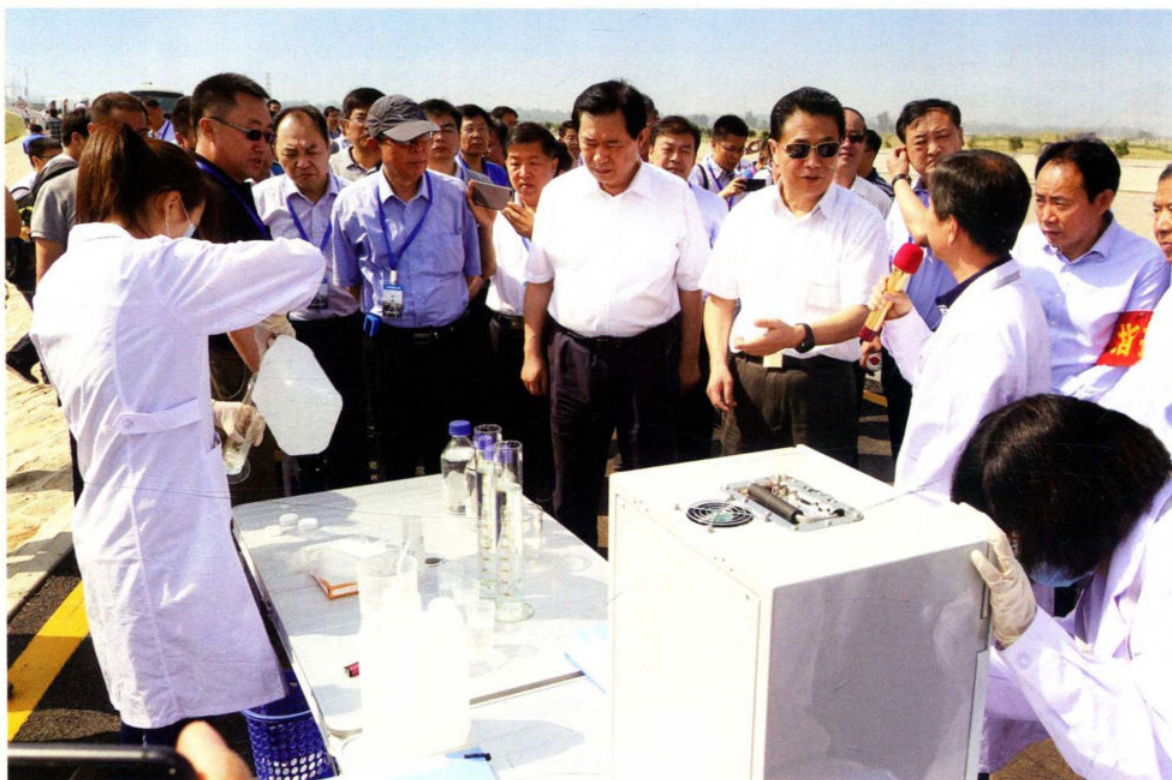
2017年5月26日，国务院南水北调办主任鄂竟平观摩中线建管局突发水污染事件联合应急演练