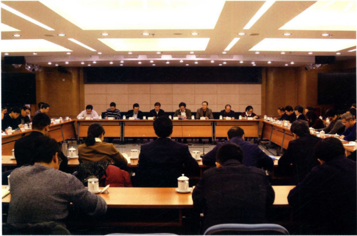
2017年12月26日，丹江口库区及上游水污染防治和水土保持部际联席会议暨对口协作工作协调小组办公室会议在北京召开