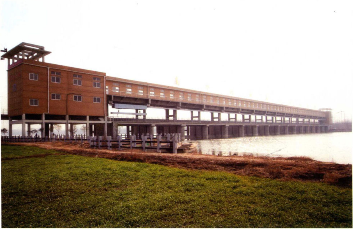
已建成的山东省鱼台县唐马河截污导流工程