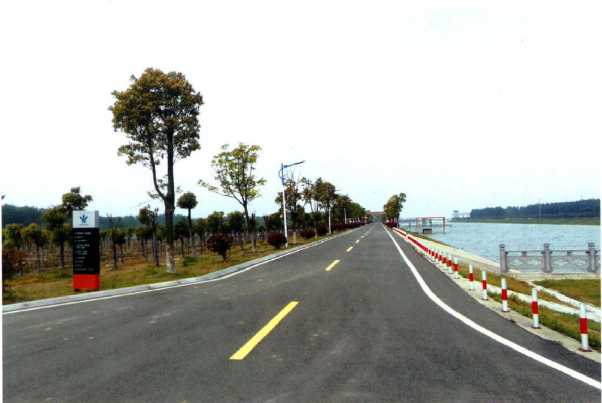
江苏省淮安市洪泽县洪泽站道路绿化