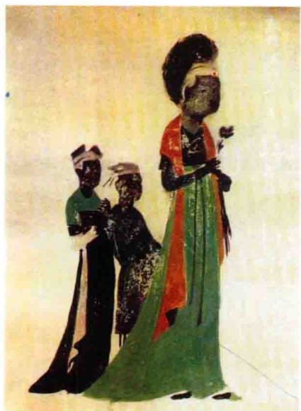
彩图5 初唐壁画人物的襦裙