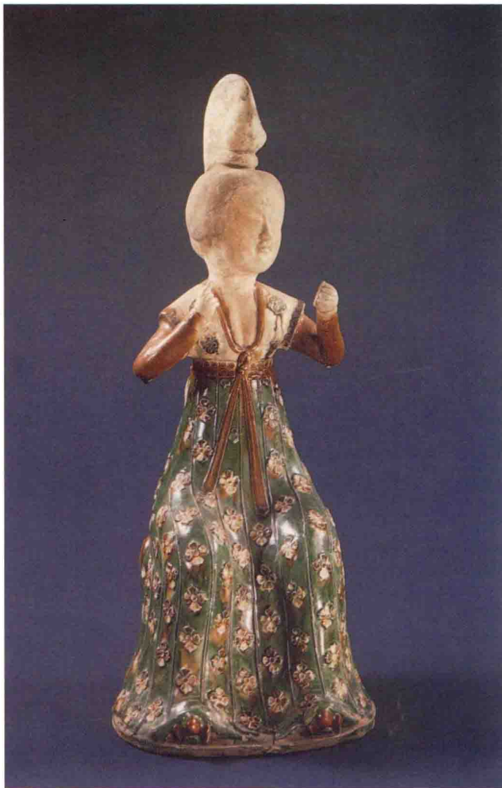
彩图 7 唐三彩俑(穿半臂、窄袖襦,配高腰长裙)