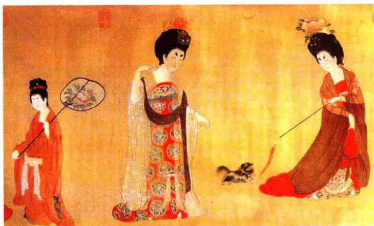
彩图8 袒胸裙衫与帔帛