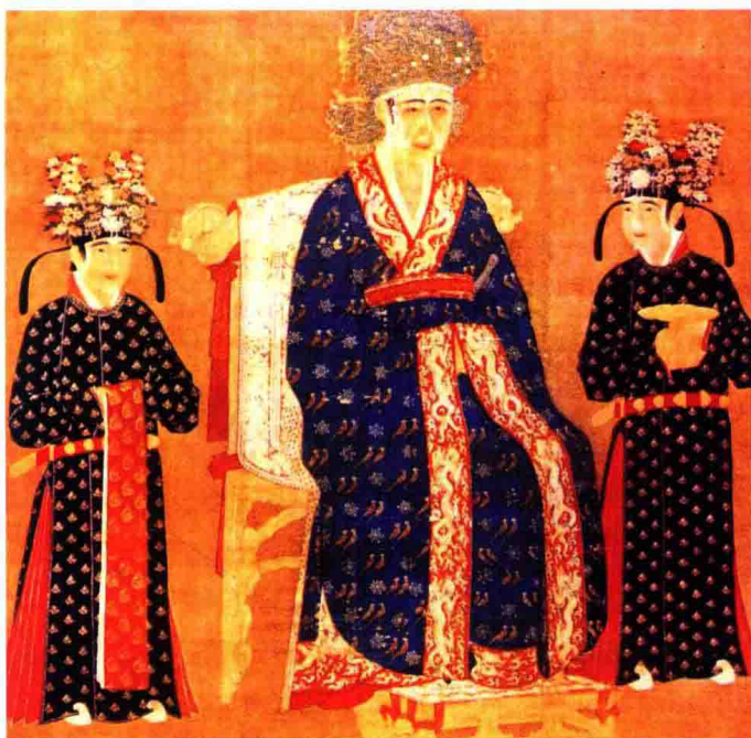
彩图 12 宋仁宗皇后像