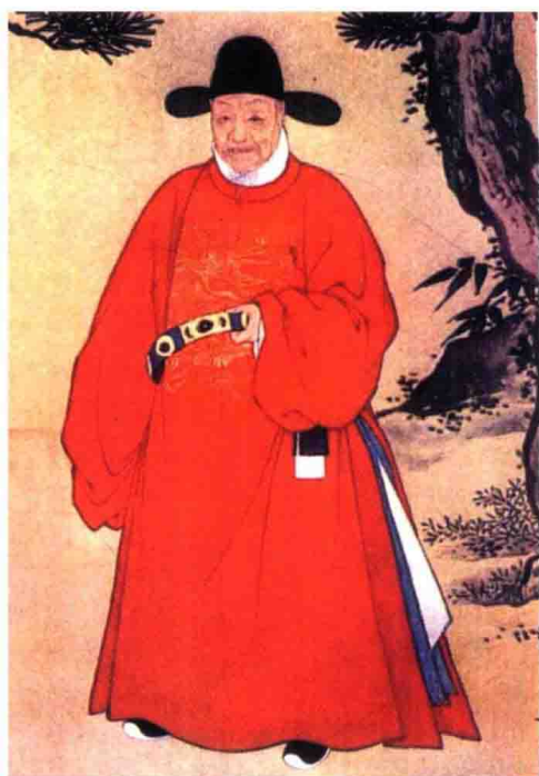
彩图 21 头戴乌纱帽、穿盘领补服的明朝官吏