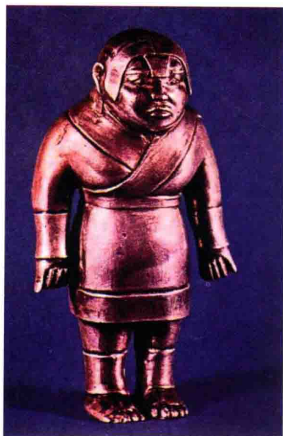
彩图 2 战国中后期的胡人武士像