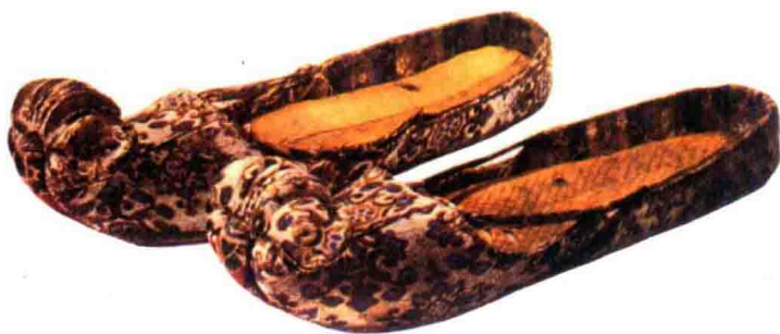
彩图 11 唐代云头锦履