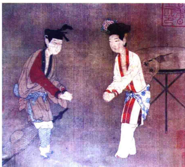
彩图 16 缠足的女子