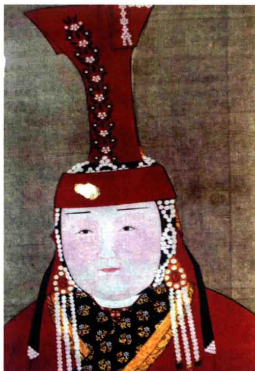
彩图 19 戴姑姑冠的皇后