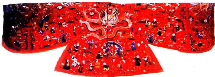
彩图 23 明代百子衣上的吉祥图案