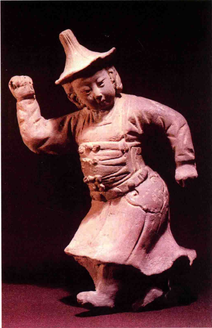
彩图 17 戴瓦楞帽、穿辫线袄子的陶俑