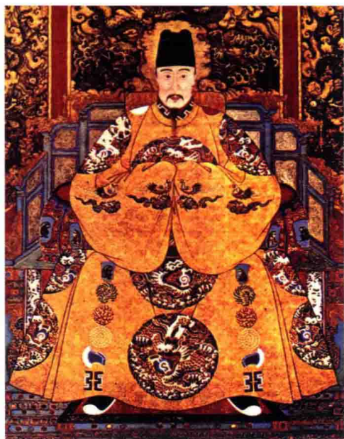
彩图 20 明代皇帝常服像