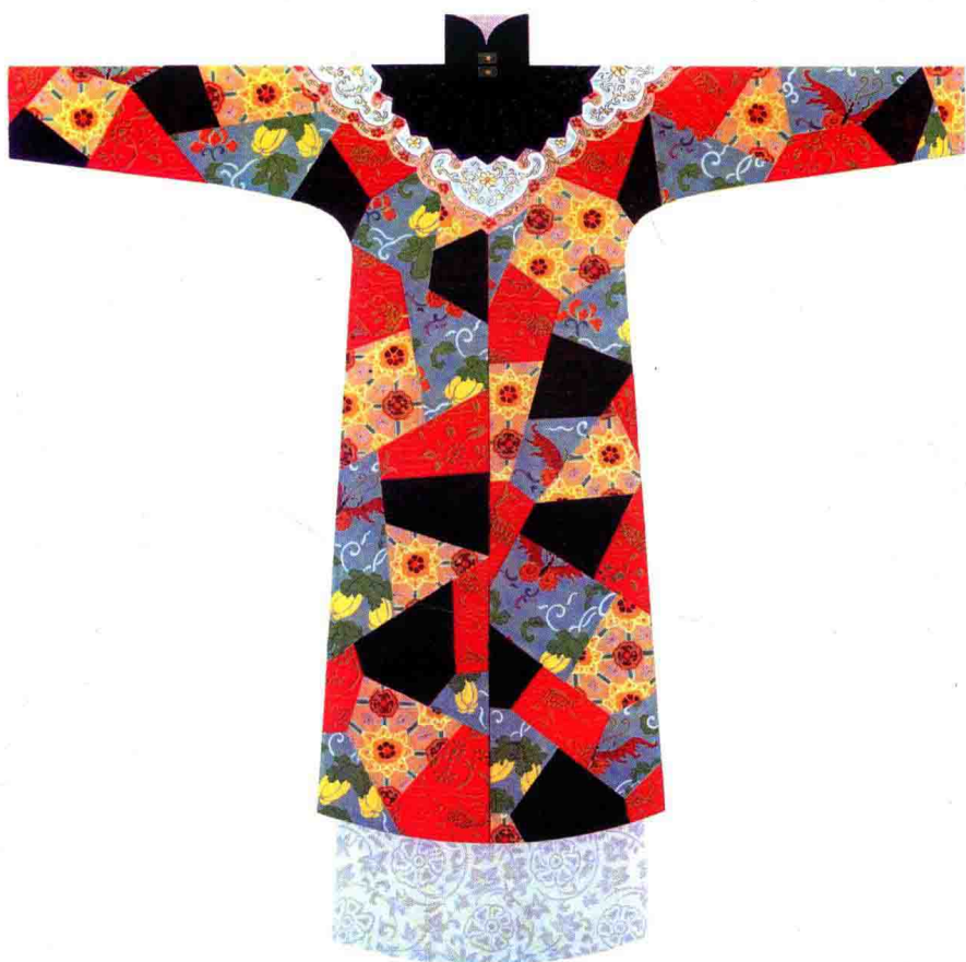
彩图 22 明代水田衣