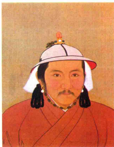
彩图 18 戴瓦楞帽的男子