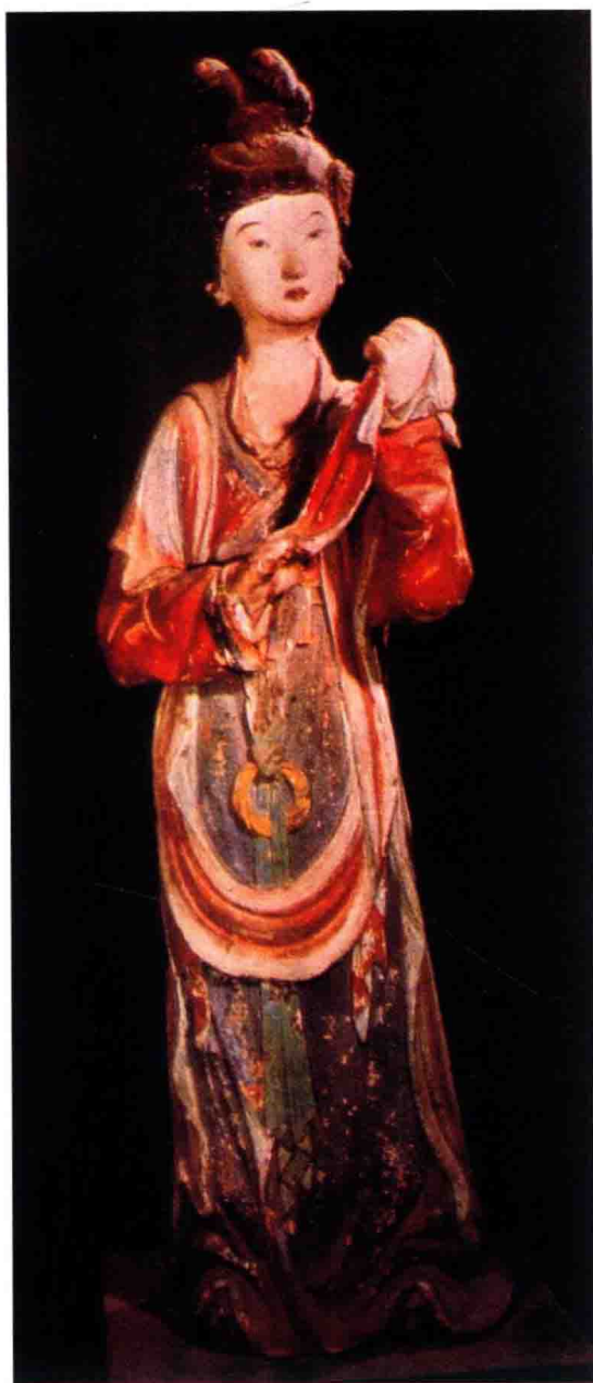
彩图 14 穿襦裙、佩帔帛、缀玉环绶的女子