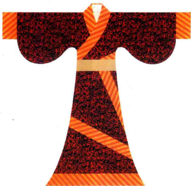
彩图 1 曲裾深衣