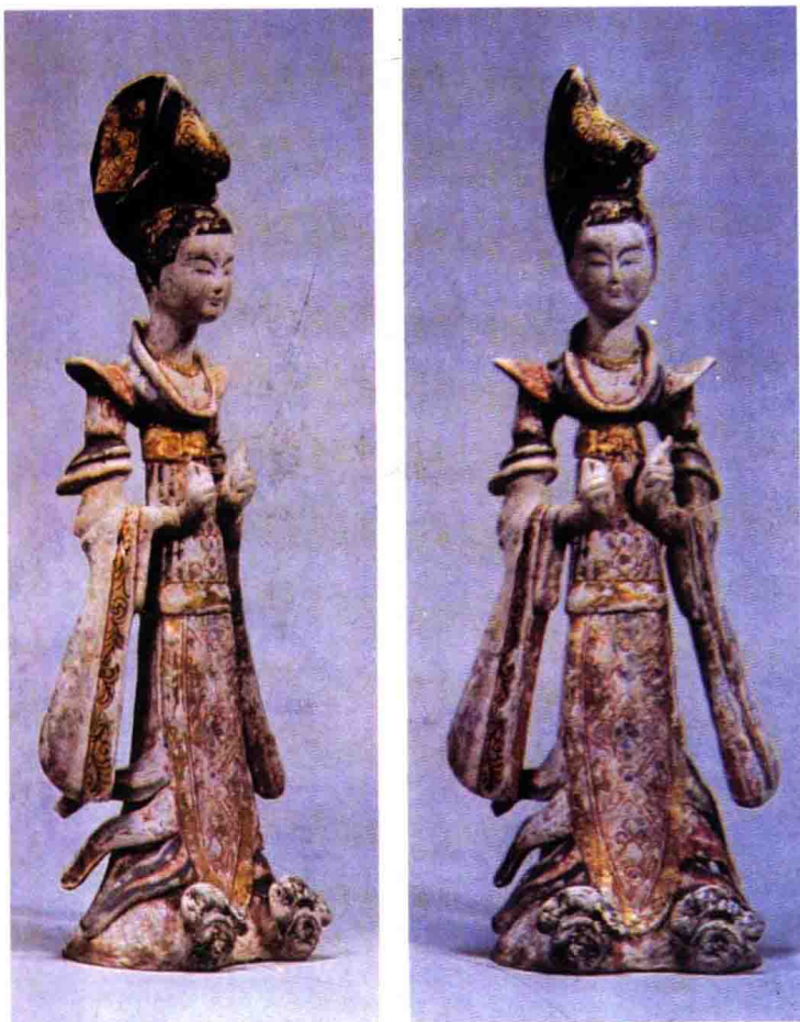
彩图 10 唐代舞姬的服装