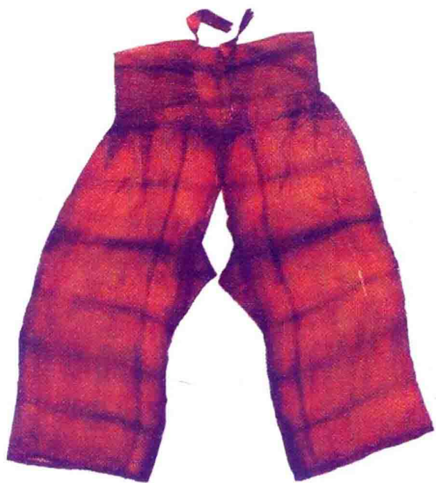
彩图 15 宋代开裆裤(福建福州黄昇墓出土实物)