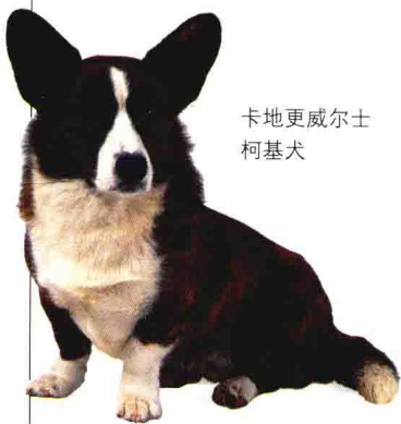
卡地更威尔士 柯基犬

选育种产生了很多外观和能力相似的种类。以狩猎为乐的皇室以他们的猎犬为荣，他们在关注猎犬的捕猎能力和性情的同时也同样注意通过育种改进它们的外观。富有的地主和贵族们以此为时尚，许多贵妇人，尤其在中国、日本、法国、西班牙和意大利，习惯让小型犬当伴侣宠物。人们培育它们则是为了毛的质地、颜色、体型及亲近个性。