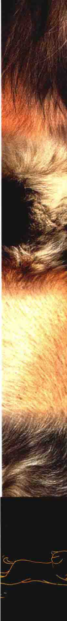
该品种的标准健康 形态图片