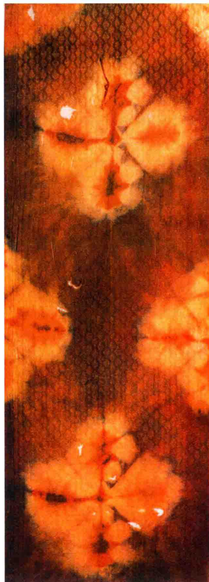
图1-3 唐代狩猎纹夹缬绢