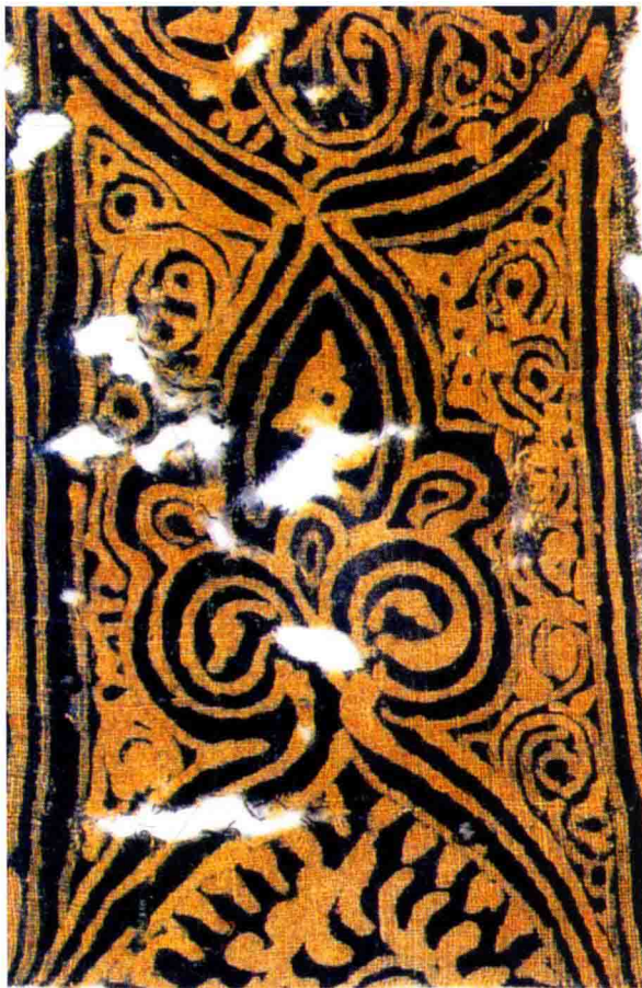
图 1-1 日本蓝染

同的工艺形成了不同的织物图案特征。手工印染的织物图案具有自然古朴、手工印迹等特征，为一些现代都市人和追求个性化的消费者所喜爱。结合造型、款式、功能、材质等诸方面的发展，手工印染被应用在服饰和家居等面料设计中。