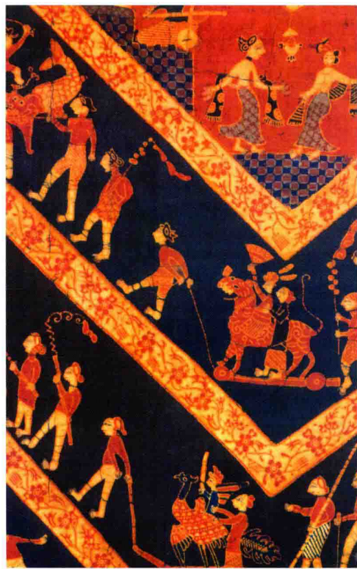
图 1-10~图 1-12 东南亚蜡染

蜡染是东南亚地区服饰和家用布料的重要装饰工艺和手段，遍及各地，其中以爪哇最为著名。在爪哇的 12 世纪文献中曾提及彩绘布帛，而对印染最早的记载要属中国元朝商人游记中提及的：东爪哇盛产“极细坚耐色印花布”。可见 14 世纪爪哇已有相当发达的印染技术，虽不能确定是蜡染工艺，但可以看作是爪哇蜡染布的前身。蜡染在印尼称为“峇迪”，原意为“画画”或“书写”。在爪哇，用铜制画器（称为“醮定”）来绘制纹样的蜡染都称为“巴迪都利斯”，即“绘画而成的蜡染”，可见其绘画的特性。印尼史学家认为，爪哇的蜡染艺术风格形成于 17 世纪的中爪哇马达然王朝，当时的艺匠使用“醮定”工具盛蜡绘制纹饰于白布上，并用棕、蓝两色染成布料，成为宫廷及御用的长布与纱笼用料，并创造了精美的古典纹饰图案，形成了独特的东南亚手工艺艺术样式。同时，欧洲、印度纺织品的贸易输入，多样化的商品信息给画工染匠带来了丰富的创作资源，爪哇蜡染以其色彩艳丽、图案优美等优势获得同时期面料的竞争优势，蜡染制成的服饰品成为当时贵族显示自己身份与地位的象征。19 世纪中叶后，缅甸、泰国、马来西亚半岛、新加坡、苏门答腊，以及南印度等地区的蜡染还融入了阿拉伯、欧洲及欧亚等外族人生产加工的手工蜡染。20 世纪初，华裔经营的蜡染作坊林立市镇，新的金属印版、化学染料，给蜡染业带来了新的活力，也大大提高了产量，以纹样造型丰富、技术成熟，开创了蜡染的黄金时代。第二次世界大战后，爪哇蜡染作为凝聚国民意识的主导产品而蓬勃发展，以创新手法诠释传统纹饰，打造了蜡染的国际地位，结合昂贵的丝绸等面料，使蜡染成为高级艺术奢侈品，成为爪哇的主要经济来源之一。爪哇蜡染纹饰极为丰富多样，源于爪哇人深信一布聚集多种纹饰、能使布具有威力，从而驱邪避病的信念。具有爪哇民族传统特色的有细雨纹、纺织纹、藤编纹、流水滴塔纹、果实剖面纹、火焰纹、神蛇纹、皮影人物纹、双翼纹、补缀纹、蝴蝶纹、回教经文、石榴纹、柿蒂纹、松子纹等，源于中国传统的有麒麟纹、凤凰纹、水牛纹等各种祥瑞兽纹，源于欧洲的有花草纹、飞禽纹、花束纹、补缀纹、轮船纹、火车纹、童话人物纹等；同时，背景纹还有鱼鳞纹、