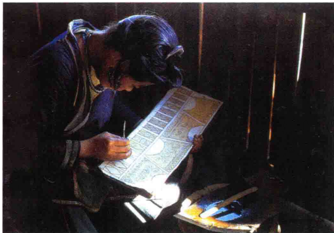
图1-5 中国贵州苗族绘蜡女