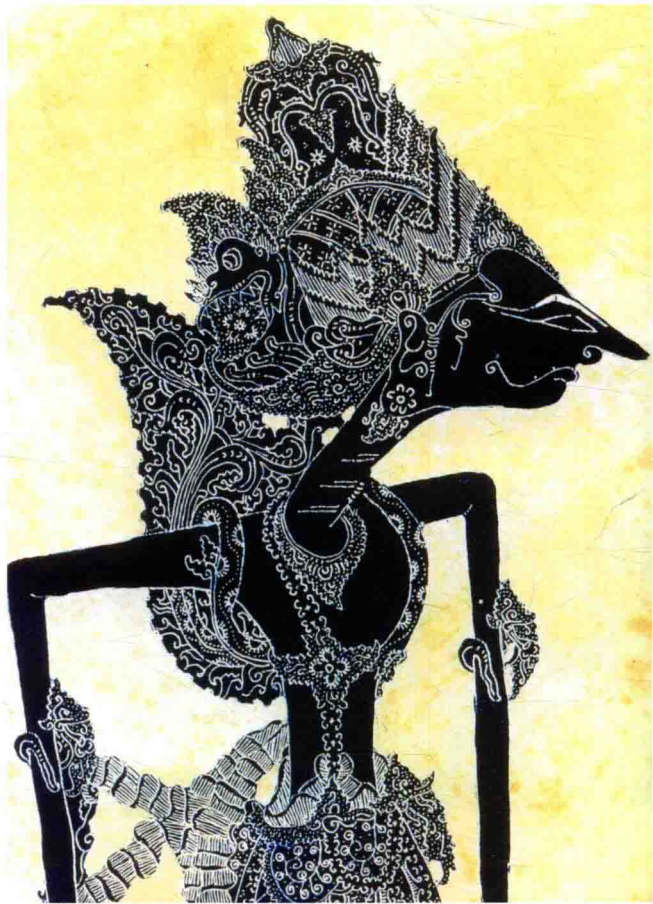
图 1-2 爪哇人物皮影纹蜡染