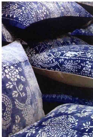
图1-6 中国蓝印花布制作的靠垫