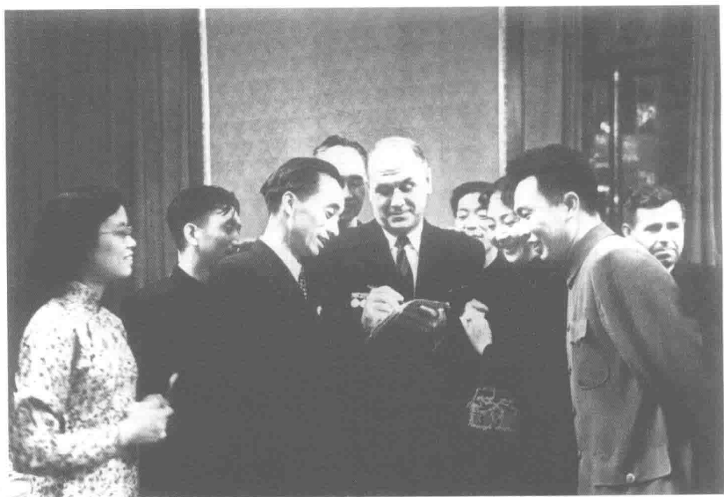
◎ 1954年，王朝闻（左三）与苏联美术家进行交流