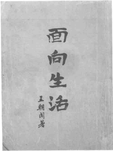
① 《面向生活》1954年初版书影