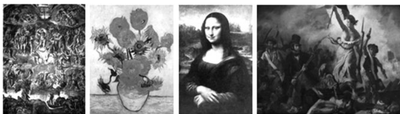
A B C D