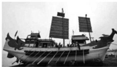
日本遣唐使船(局部)