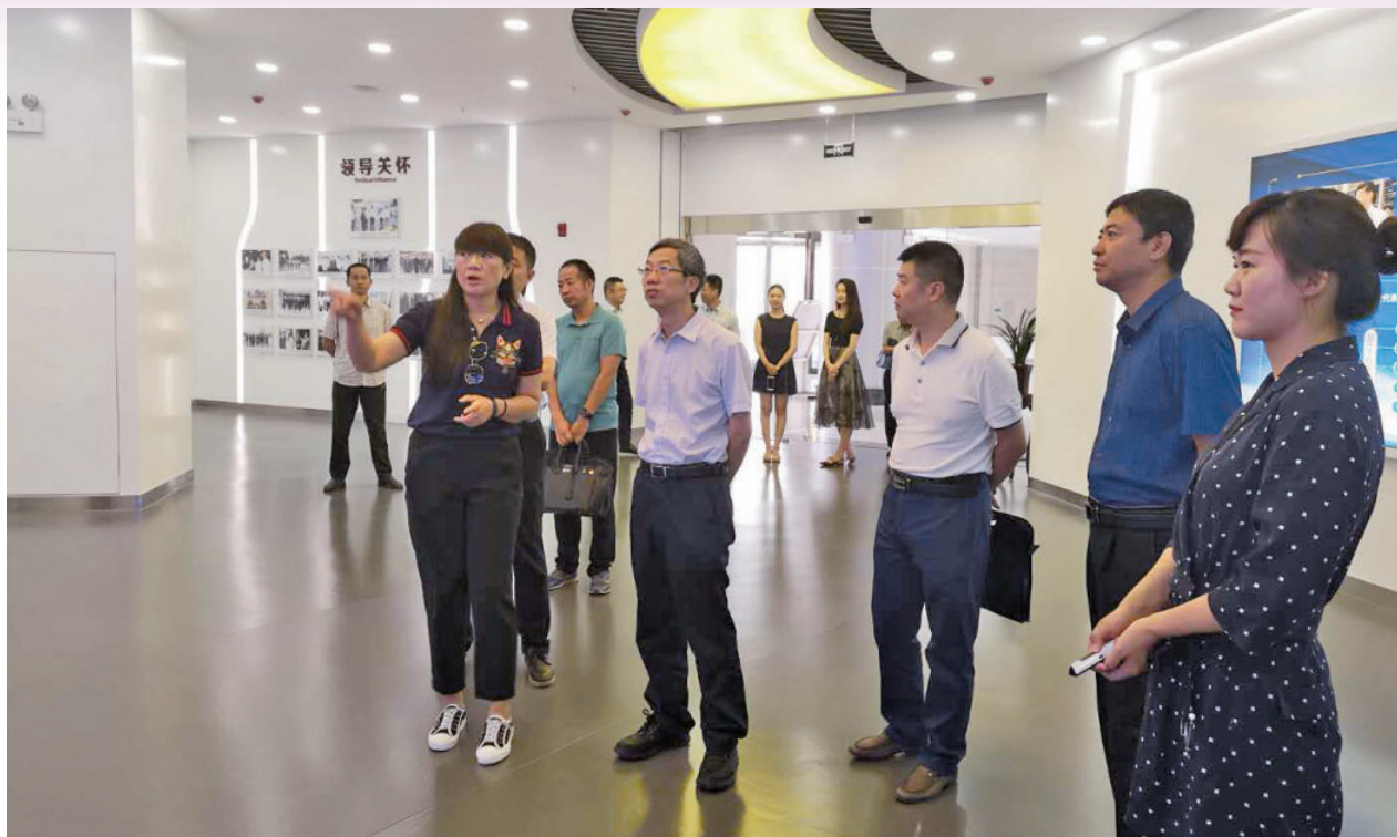
2018年8月10日，自治区财政厅党组书记、厅长陈春平（左二）调研银川中关村创新中心