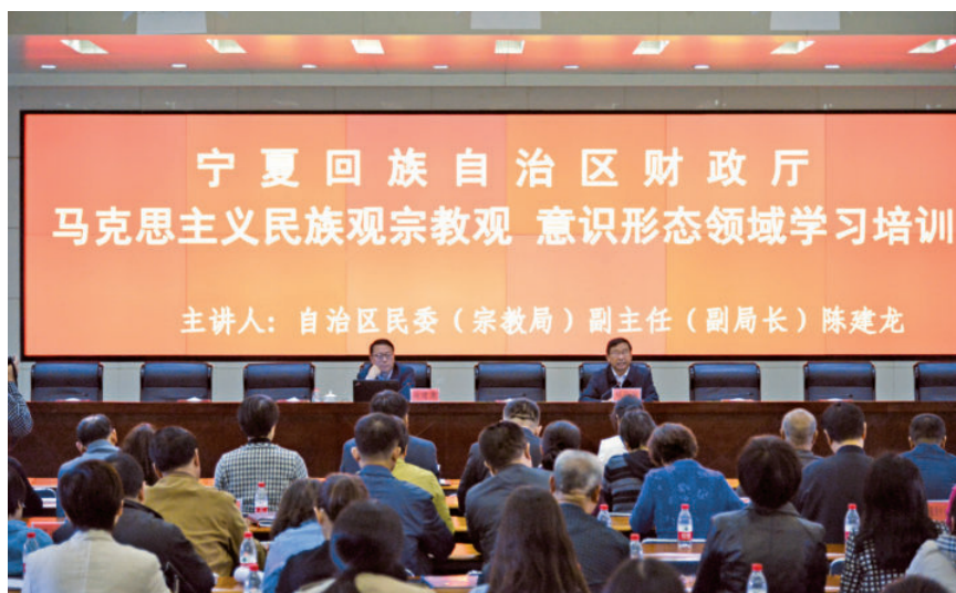
2018年9月29日，自治区财政厅举办马克思主义民族宗教观、意识形态领域学习培训