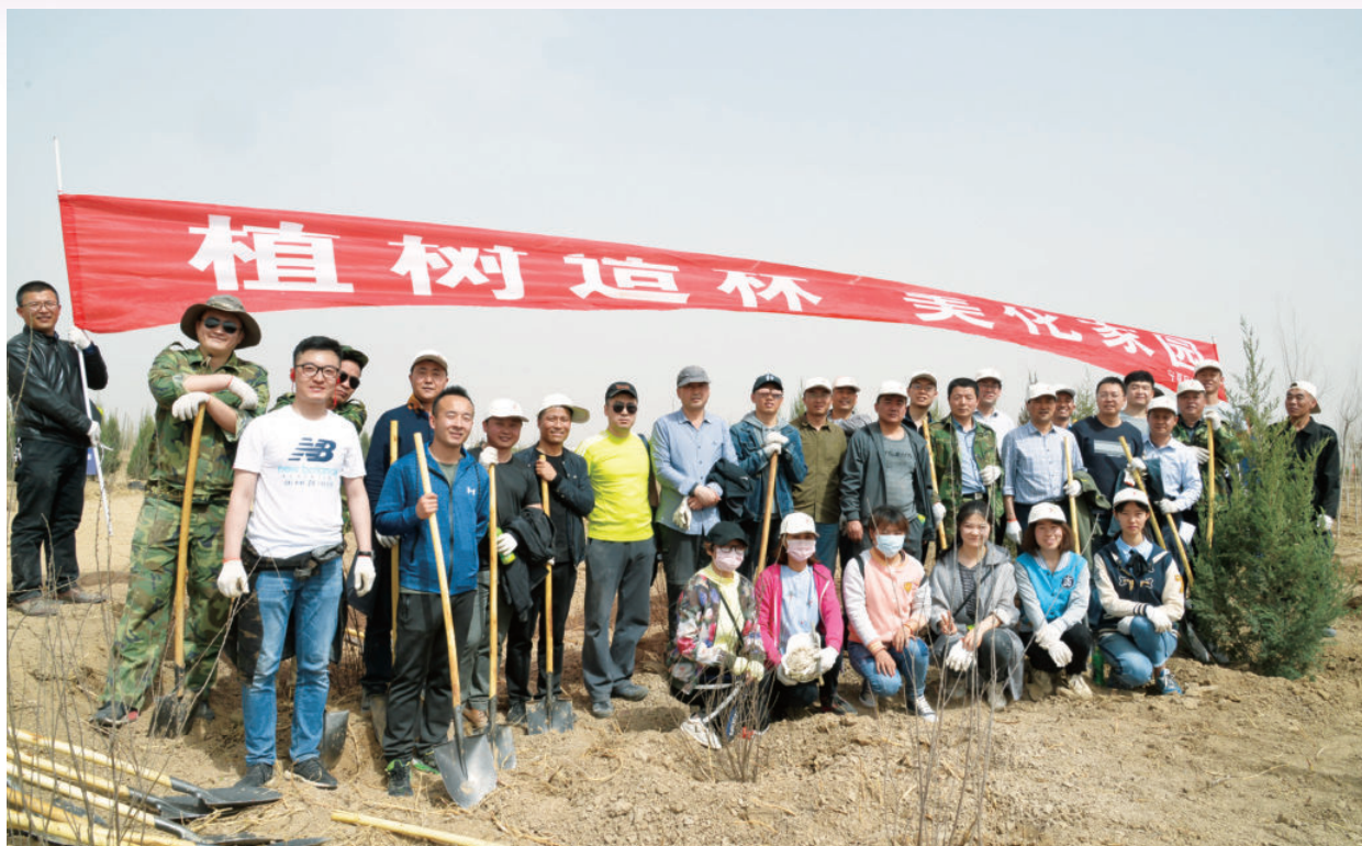
2018年3月29日，自治区财政厅干部职工参加植树造林活动