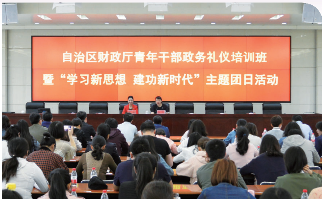
2018年5月4日，自治区财政厅举办青年干部政务礼仪培训班暨“学习新思想 建功新时代”主题团日活动