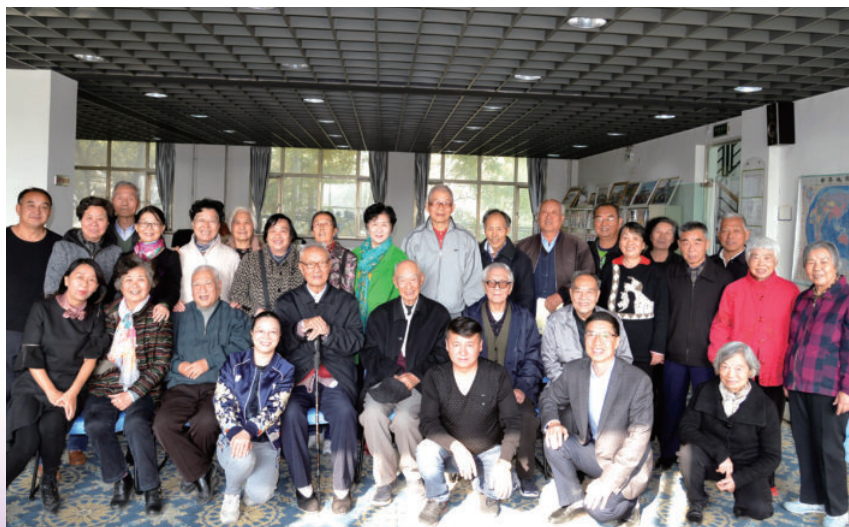
2018年10月17日，自治区财政厅组织离退休老干部开展重阳节主题活动