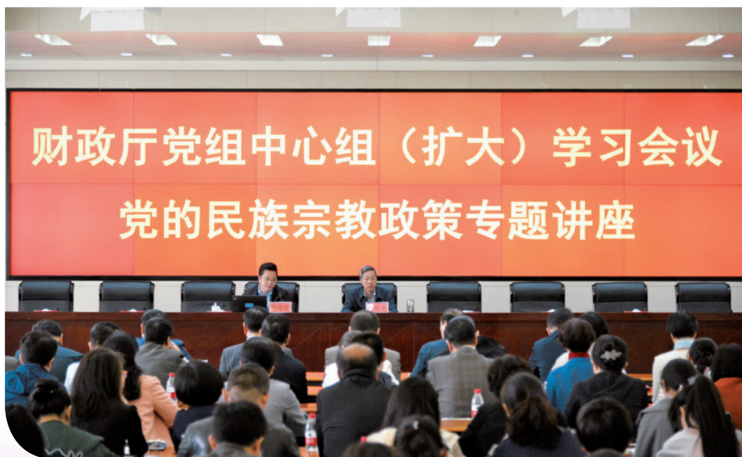
2018年4月20日，在自治区财政厅党组中心组（扩大）学习会议上以党的民族宗教政策为专题举办讲座