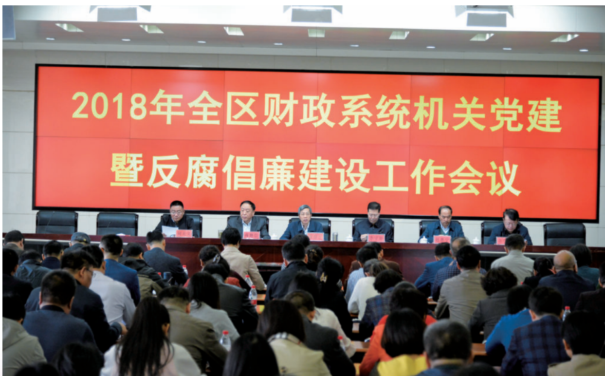
2018年3月26日，自治区财政厅召开2018年全区财政系统机关党建暨反腐倡廉建设工作会议