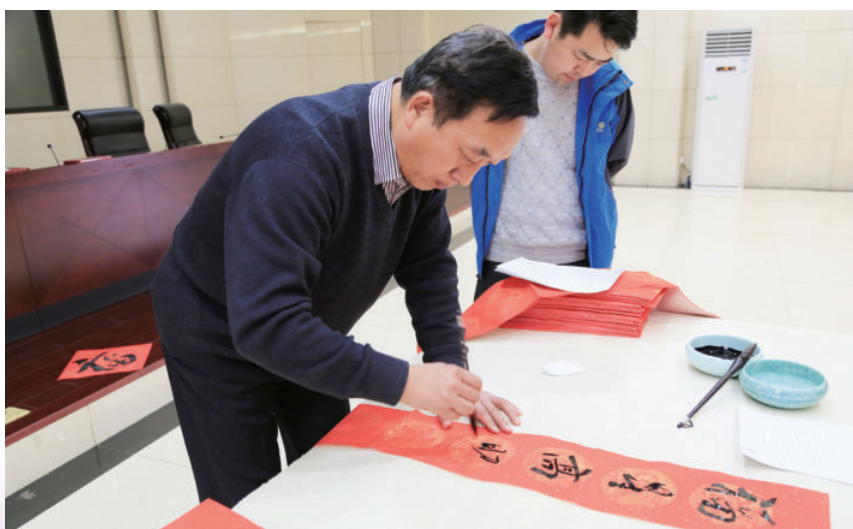
2018年1月24日，自治区财政厅举办“迎新春”系列活动