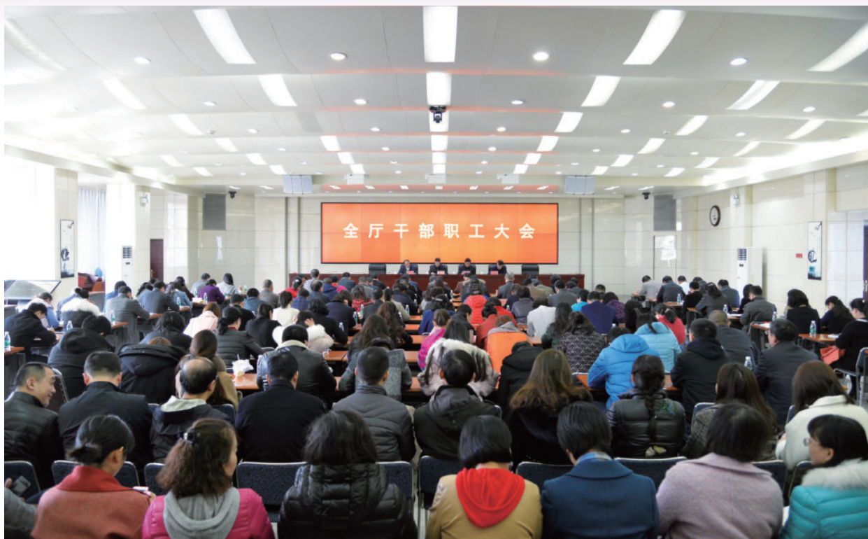
2018年2月23日，自治区财政厅召开全厅干部职工大会