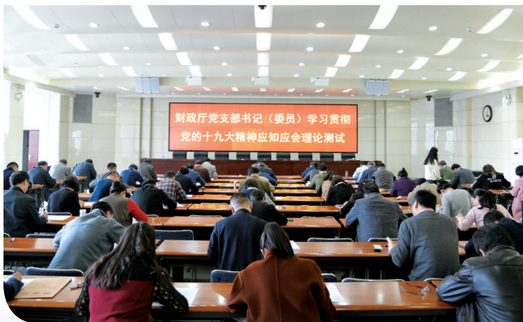
2018年3月9日，自治区财政厅举办财政厅党支部书记（委员）学习贯彻党的十九大精神应知应会理论测试