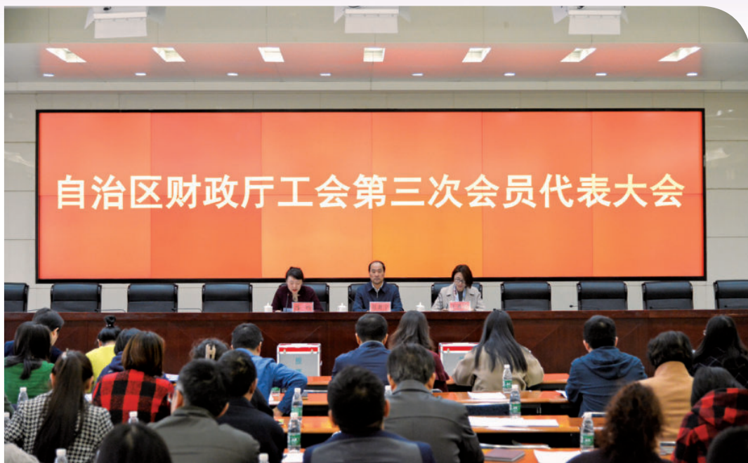
2018年3月16日，自治区财政厅工会召开第三次会员代表大会