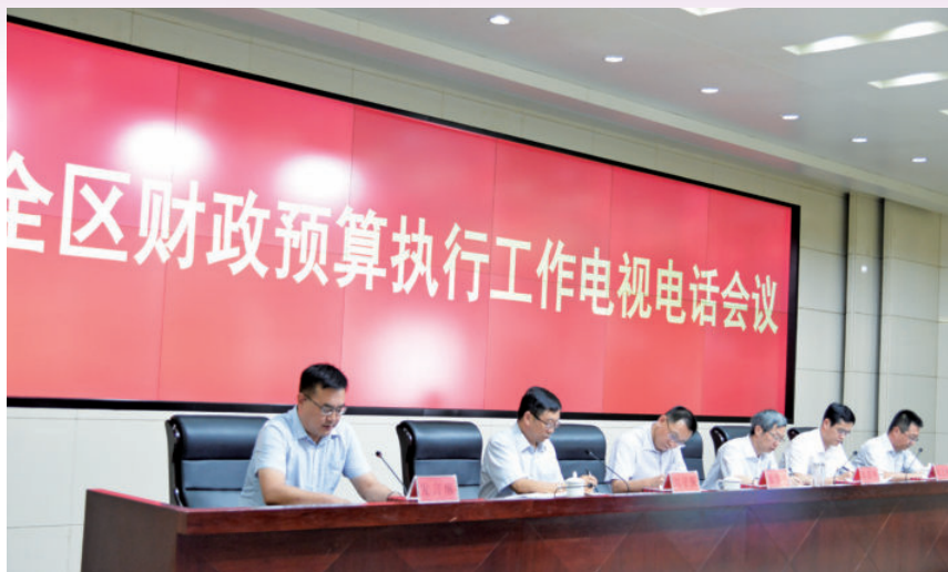
2018年8月17日，自治区财政厅召开全区财政预算执行工作电视电话会议