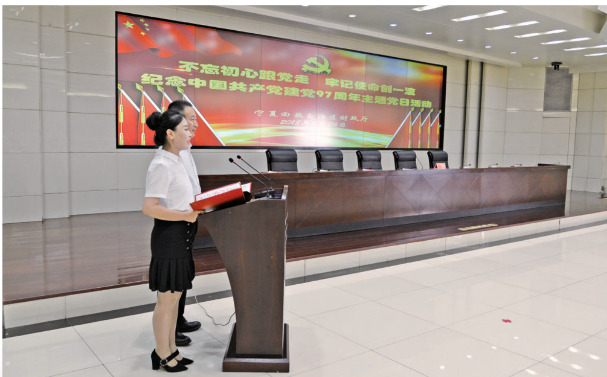
2018年6月26日，自治区财政厅举办纪念中国共产党建党97周年主题党日活动