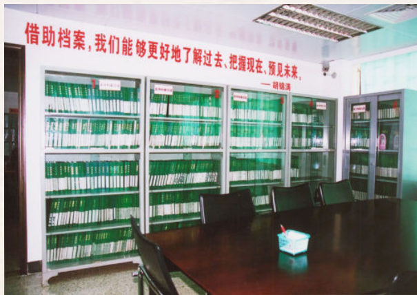
▲ 市档案馆档案阅览室