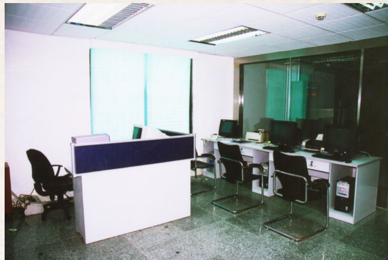
▲ 市档案馆机房监控室