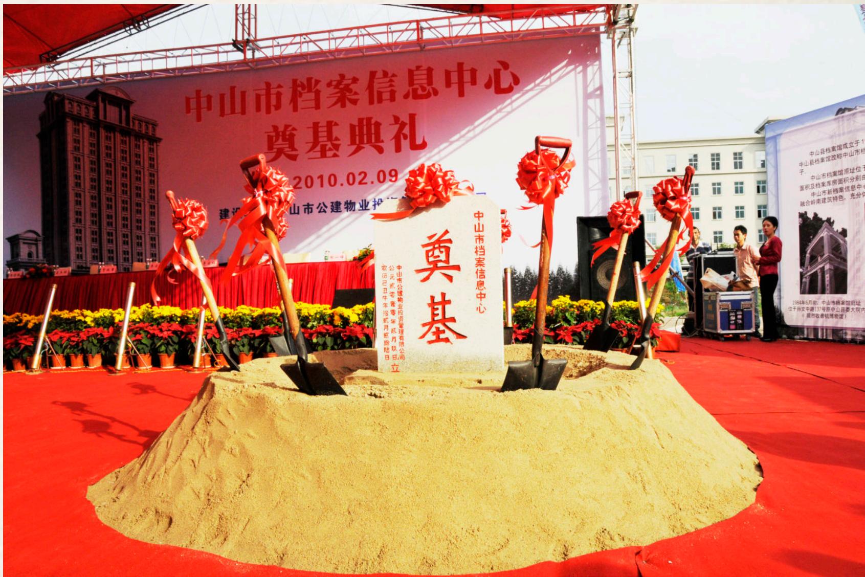
▲ 2010年2月9日上午，中山市档案信息中心建设工程举行隆重的奠基仪式