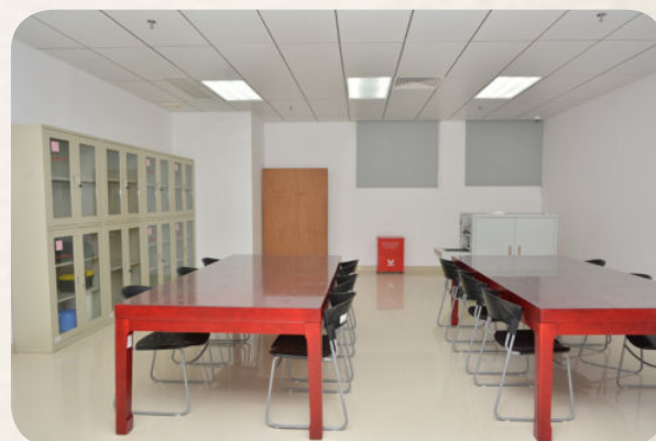
▲ 市档案馆新馆裱糊室