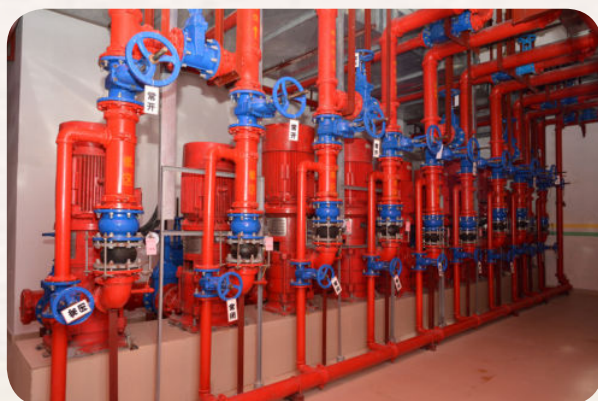
▲ 市档案馆新馆消防系统