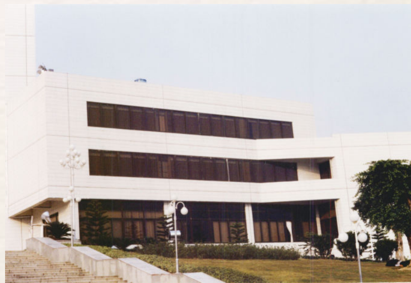
▲ 1995年的中山市档案局馆旧址（兴中道1号）