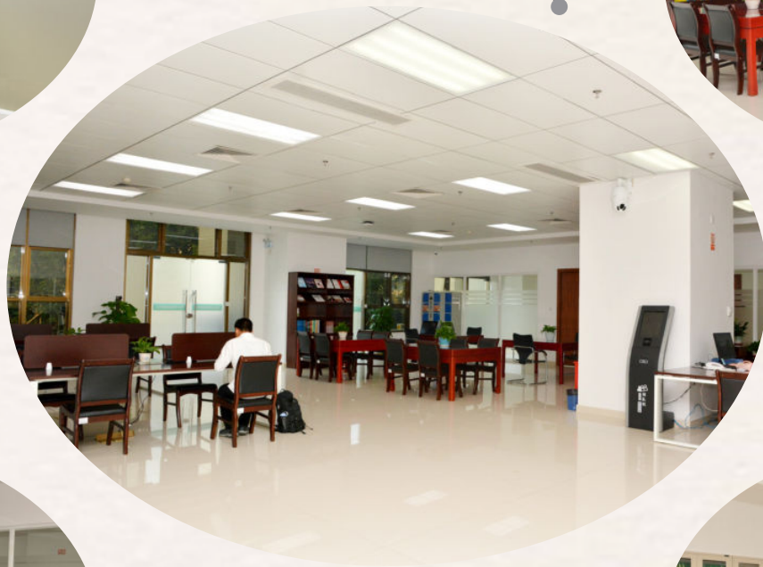
市档案馆新馆查阅大厅