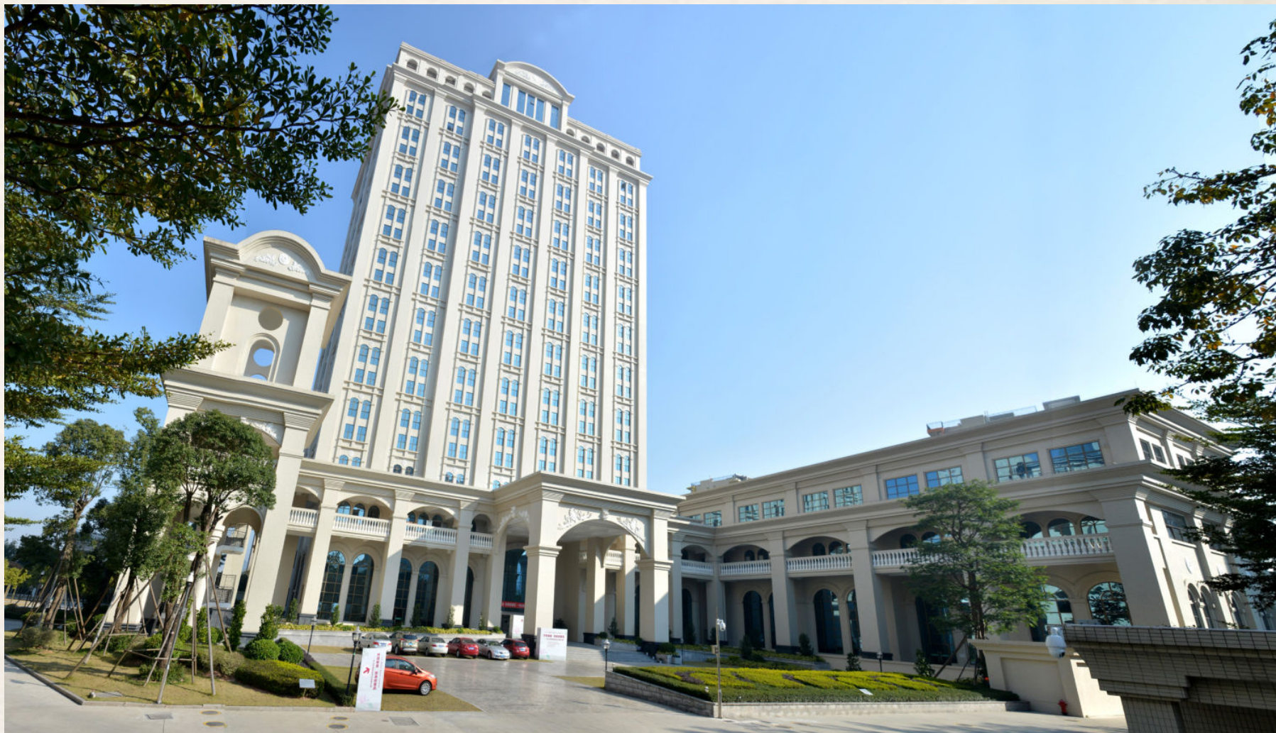
▲ 2016年的中山市档案信息中心大楼（中山市东区兴文路7号）