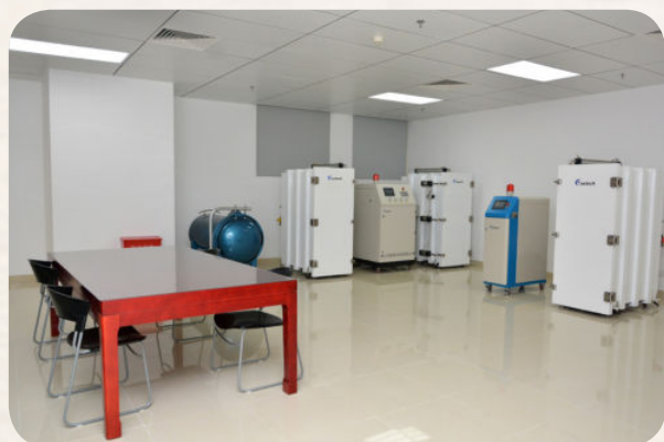
▲ 市档案馆新馆消毒室