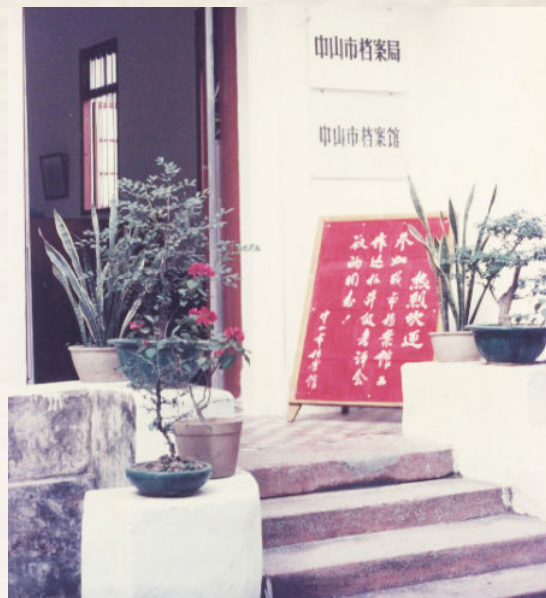
▲ 1991年的中山市档案局馆旧址（孙文中路178号）