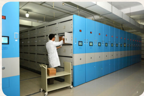
▲ 市档案馆新馆库房