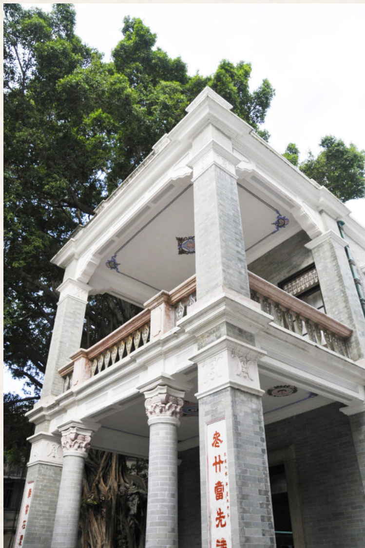
▲ 1984年以前中山市档案馆旧址（孙文中路137号）