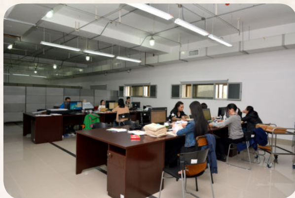
▲ 市档案馆新馆数字化室