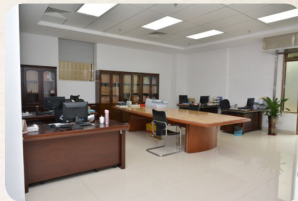
▲ 市档案馆新馆档案整理室