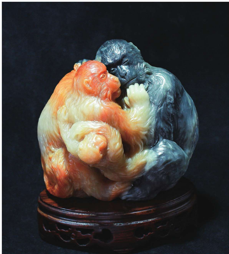
《重逢》 昌化石 潘海宾