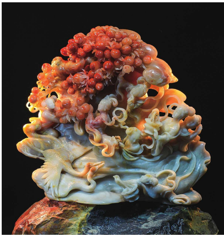
《采寿图》 巴林石 潘锡存