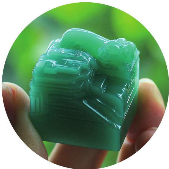
印纽 雅安绿 潘海宾

雅安绿颜色比西安绿更艳丽，透着一股浓重的妖气，乍看如同一块绿塑料。比西安绿稍软，但比寿山石稍硬，刀感比较韧，其光泽上和西安绿那种强烈的镜面光泽不同，而像昌化石一般厚重含蓄。雅安绿与寿山石一样，上油后会更漂亮，而西安绿上油后则会失去迷人的光彩。