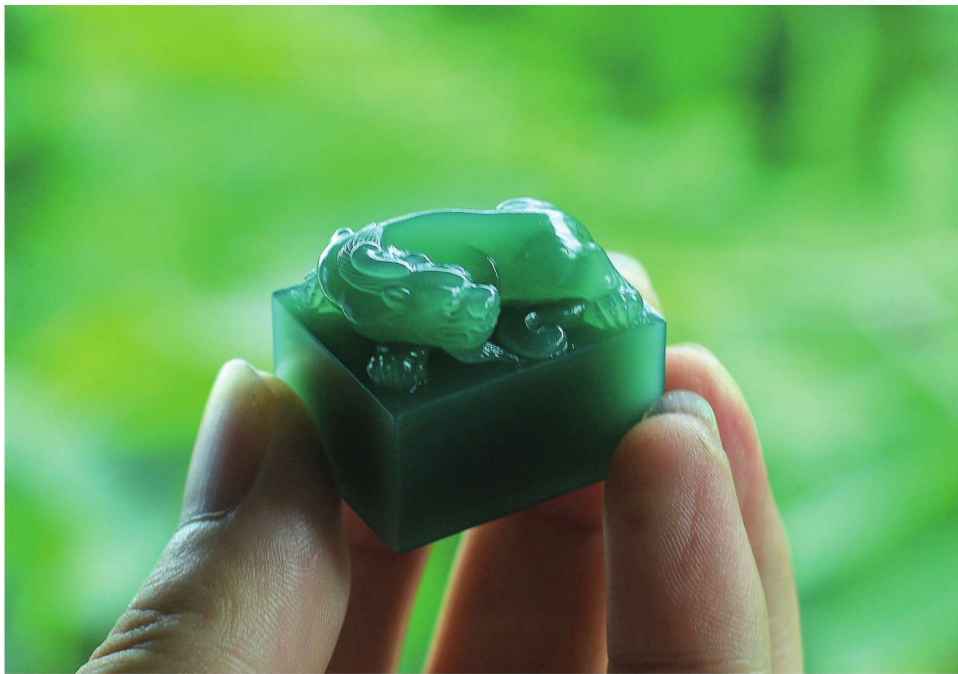
印纽 西安绿 潘海宾