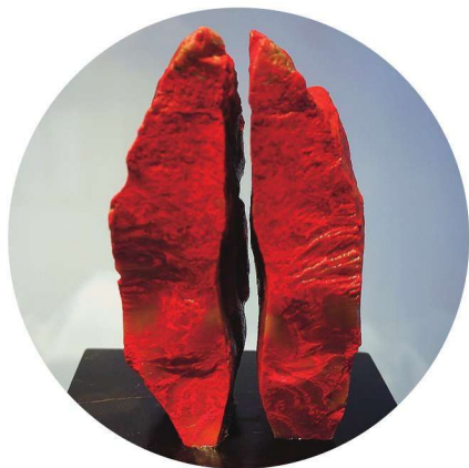
昌化鸡血原石（大红袍）