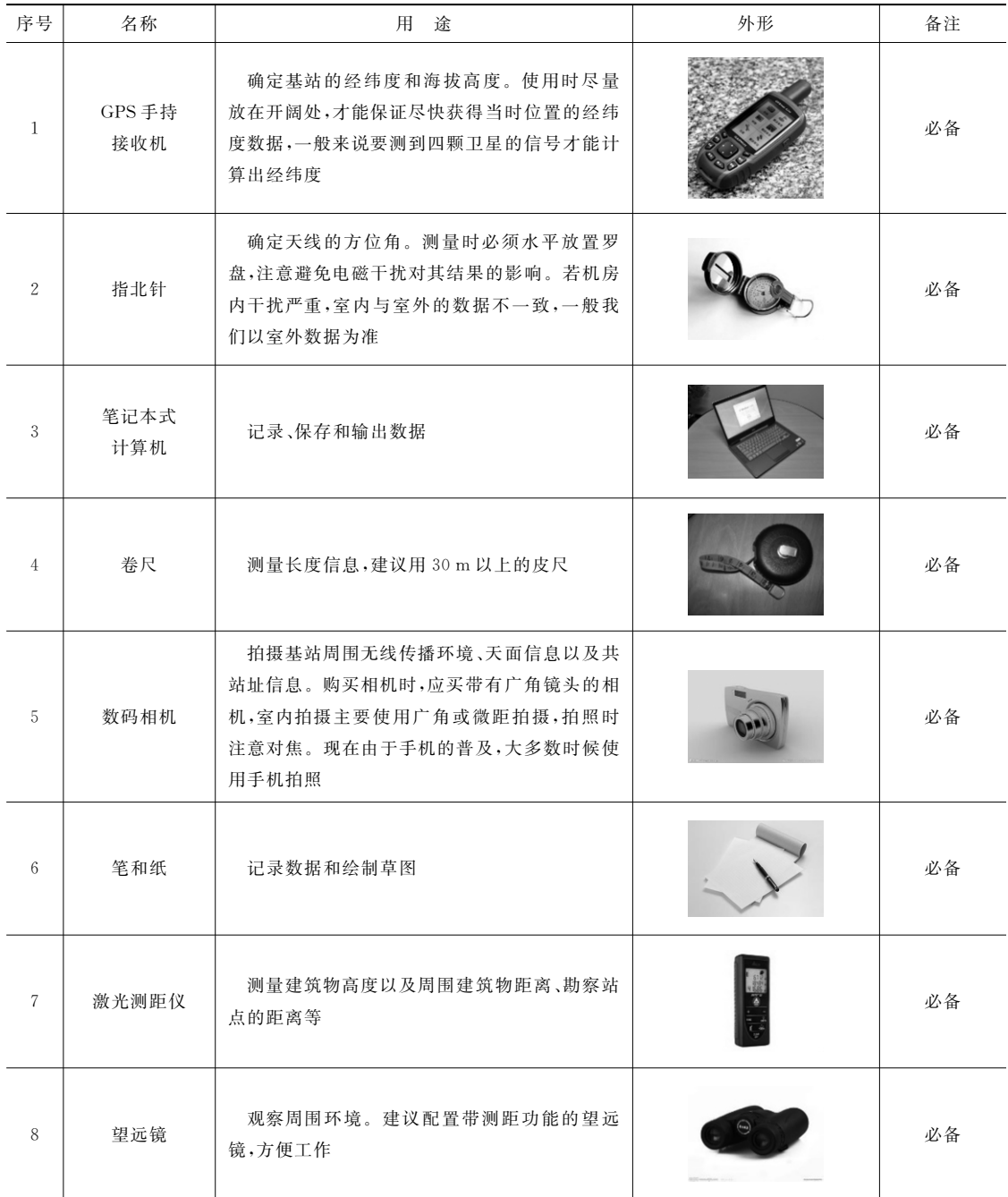
表 1.1.1 勘察仪表及工具