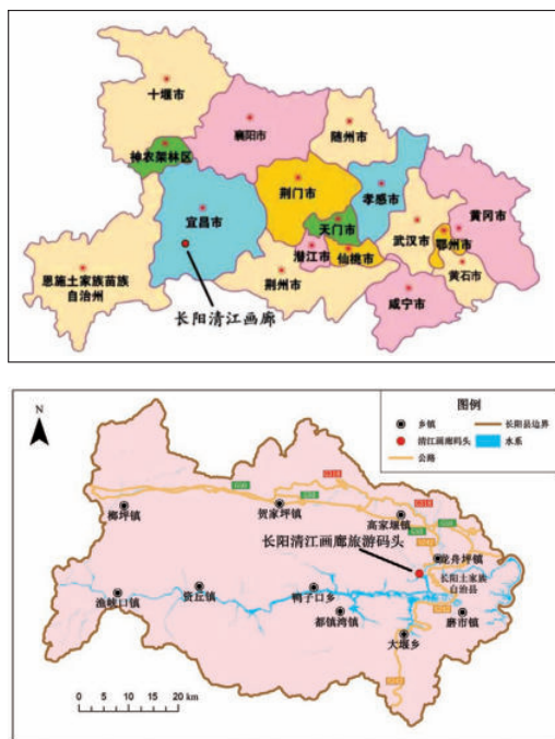
图1-5 清江画廊位置示意图

族自治州的巴东县,北接秭归县和宜昌市点军区(图1-5)。境内山峦起伏,沟壑纵横,地势西高东低,东西长94.5km,南北宽63km,总面积 3424\text{km}^2 ,最高点崩尖子海拔2259.1m,最低点向溪口48.7m。