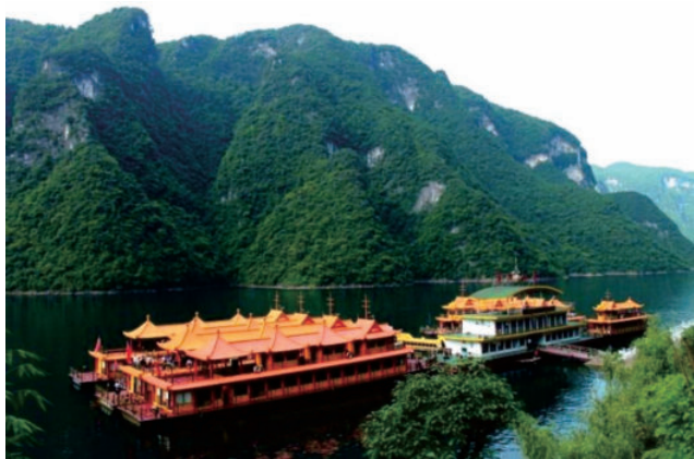
图 1-3 清江画廊旅游码头