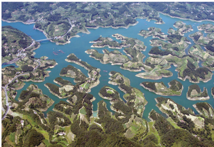
图1-2 清江百岛湖鸟瞰图(据 http://www.qdc.com.cn/Item/156.aspx )

这里历史悠久,底蕴深厚。19万年前,“长阳人”即在此繁衍生息;新石器晚期,长阳全境已遍布原始人群的足迹;4000年前,土家族先祖巴人廪君浮舟西征,开创了巴国文明的历史。长久以来,长阳人在这里繁衍生息,创造了一个又一个灿烂的巴土文化。这里还是苏区革命的重要战场,国内革命战争时期湘鄂边根据地之一,为中国共产党反帝反封建的革命斗争做出了重要贡献。