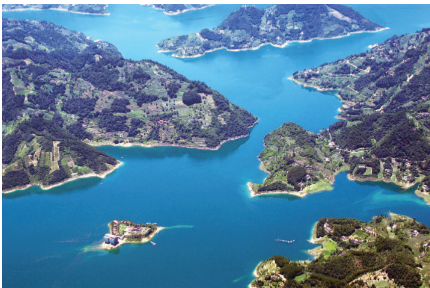
图 1-1 航拍清江 ①

“清江精粹在长阳,长阳风光胜画廊”“八百里清江美如画,三百里画廊在长阳”都是对长阳清江的真实写照。长阳清江画廊,是八百里清江最为秀丽的一段,青山与碧水相恋,奇峰万点,秀水千曲,形成了旖旎的清江画廊。现有的清江画廊旅游专用码头位于宜昌市长阳土家族自治县隔河岩,这里是湖北省省级风景名胜区和旅游度假区,也是国家林业局批准建设的国家森林公园,2008年荣膺全国民族文化旅游