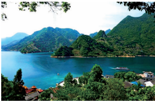
图 1-4 武落钟离山清江风光

这里文化灿烂,风情浓郁。长阳素有“清江天下秀,长阳歌舞乡”的美誉,传承着灿烂的巴土文化,“长阳文化三件宝”山歌、南曲、巴山舞蜚声海内外,“巴山舞之夜”“土家女儿会”“土家山歌节”“万人年猪宴”等节庆品牌以及“梦幻土家”“清