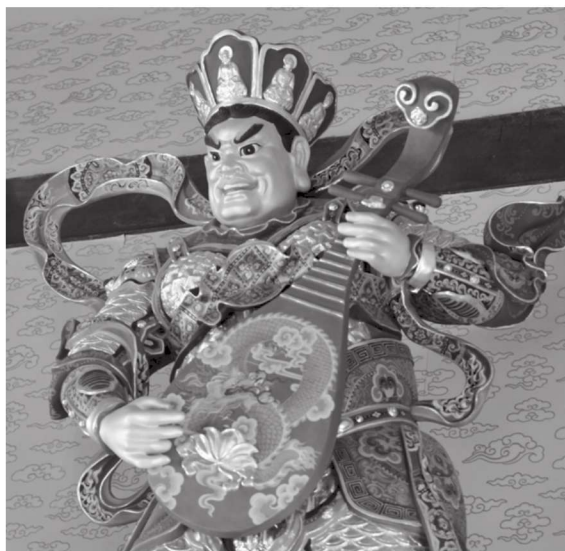
东方持国天王 江苏苏州西山观音寺