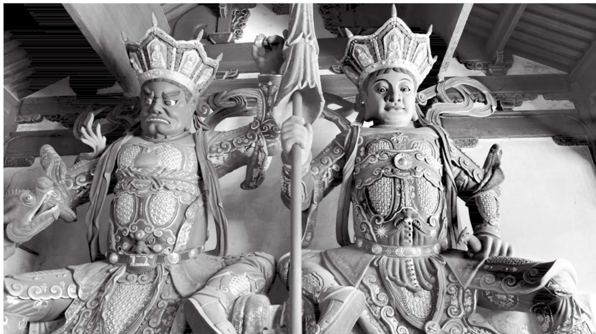
天王 浙江普陀山慧济禅寺