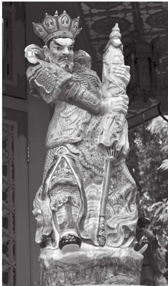
北方多闻天王 香港黄大仙景区