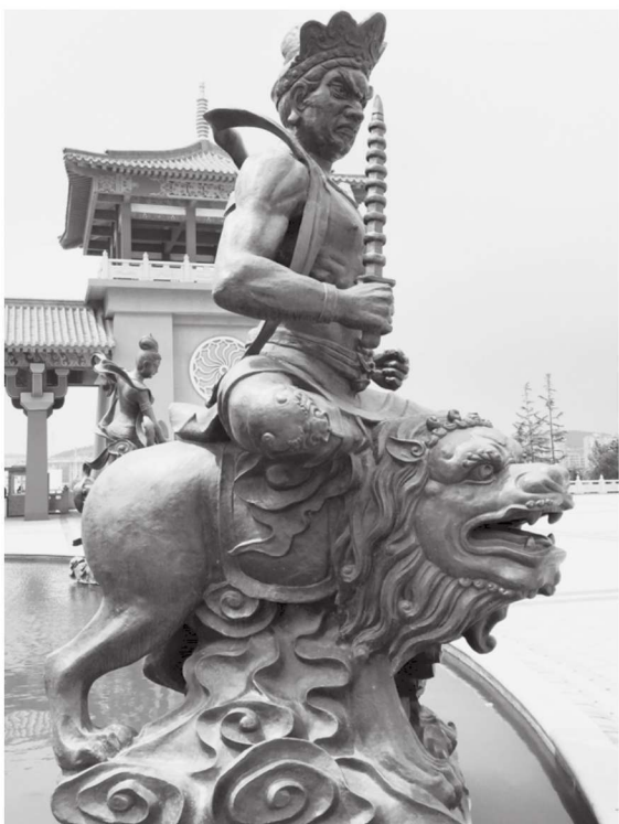
图 1-4 夜叉 江苏徐州宝莲寺