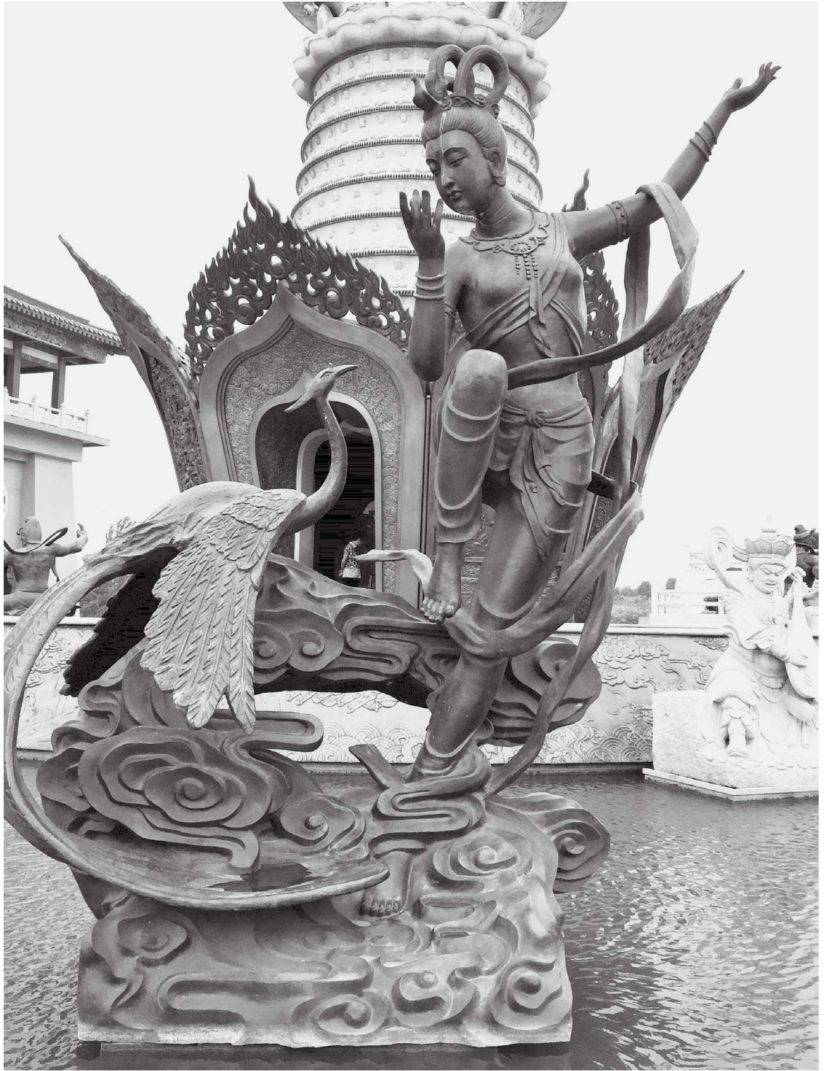
图 1-6 乾达婆 江苏徐州宝莲寺