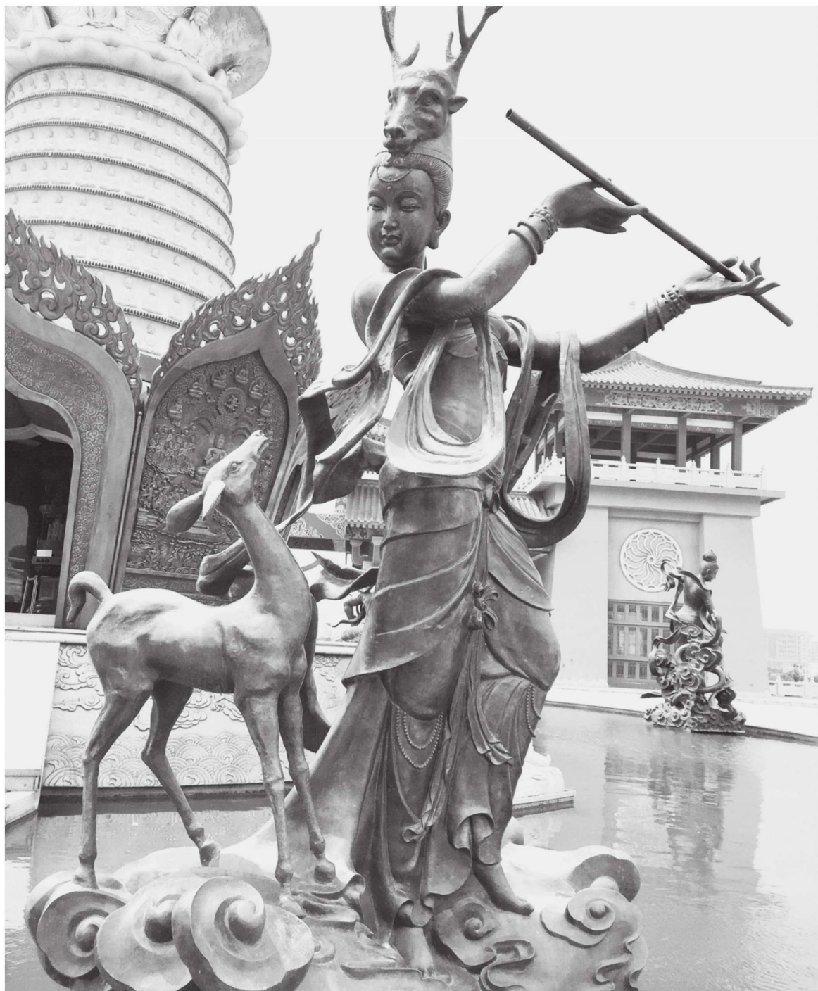
图 1-10 紧那罗 江苏徐州宝莲寺

法神便在这个天部中。至今，佛教寺院每年农历元月初九都要举行供佛斋天法会，祭祀二十诸天，民间俗称拜天公。佛教徒虽不皈