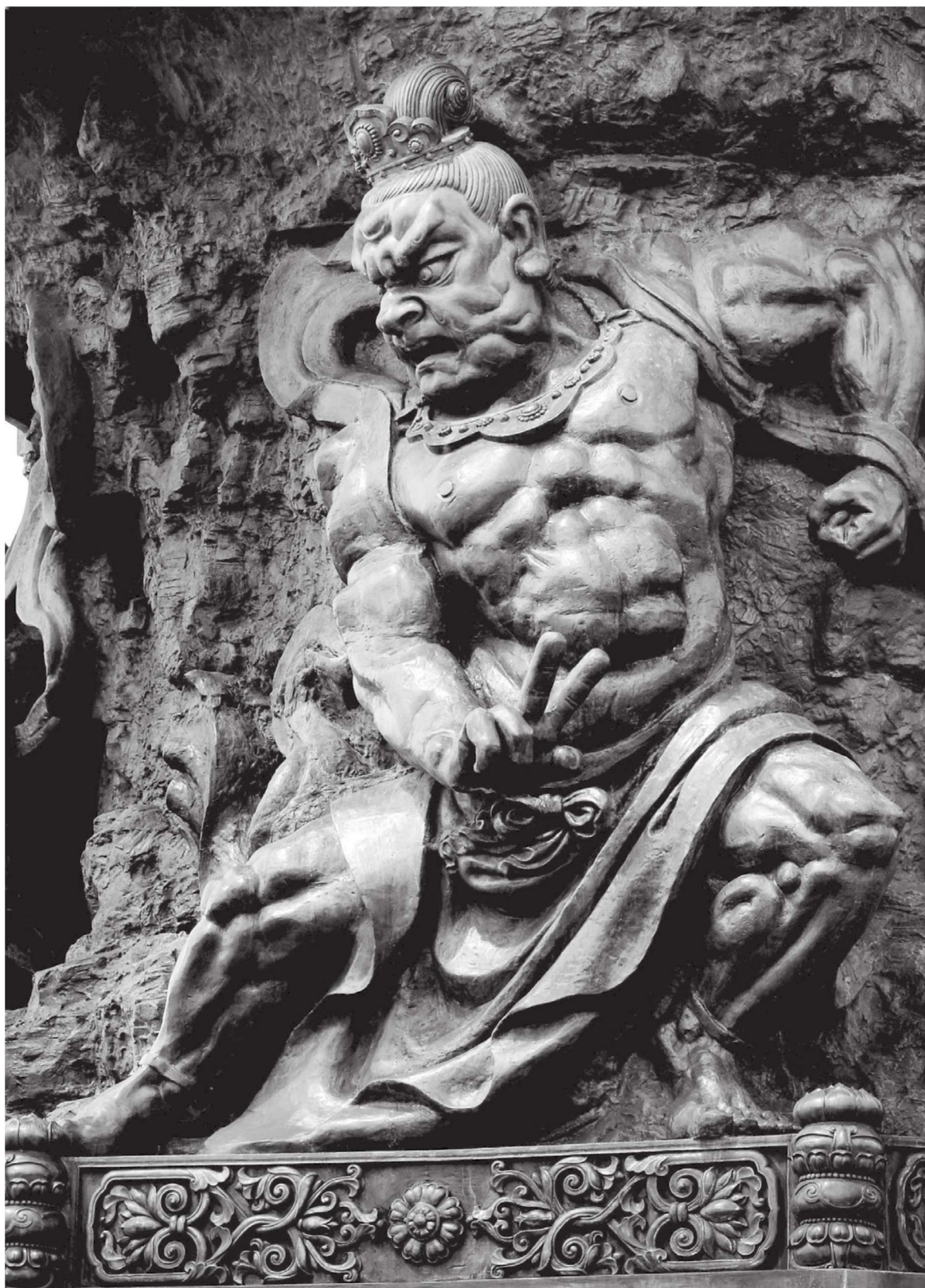
金刚力士 江苏无锡灵山大佛景区