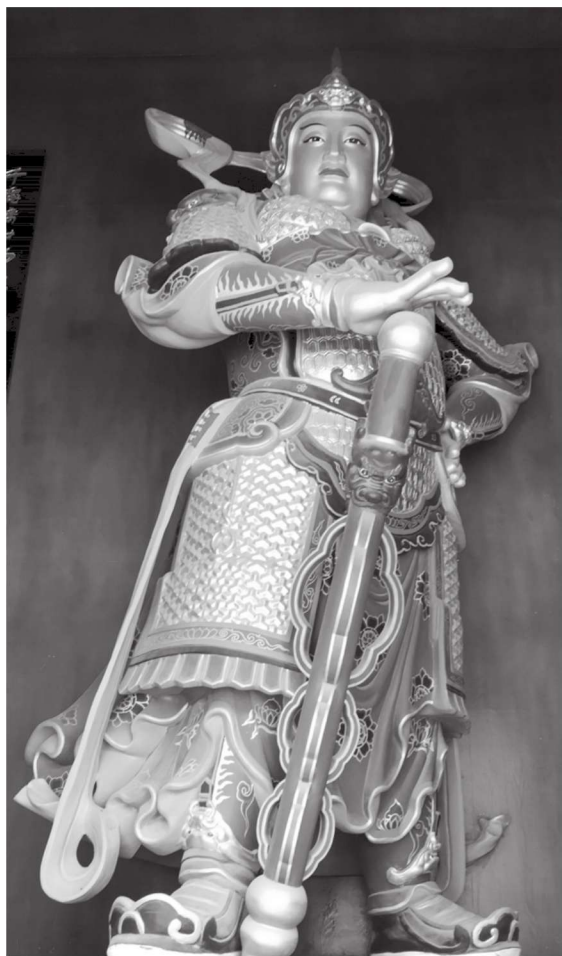
韦驮 江苏徐州宝莲寺