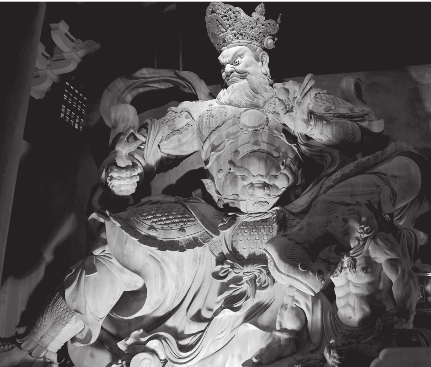
西方广目天王 四川乐山凌云寺