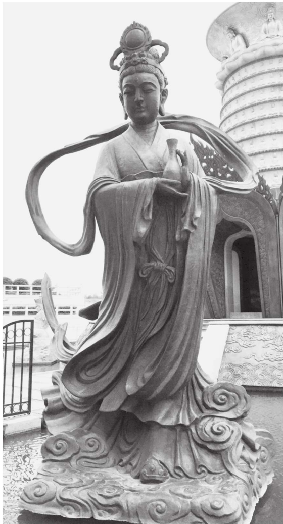
图 1-1 天部 江苏徐州宝莲寺

龙部又称龙众。龙众中的“龙”，主要生活在水中。作为佛教护法神的龙众有无数，主要有五龙王、七龙王、八龙王、十六龙王等，专管兴云降雨，这与中国的龙王传说十分相似。古印度人对龙非常尊敬，认为水中生物以龙的力气最大，因此尊称德行崇高的高僧为“龙象”。根据古印度神话传说记载，龙是蛇的一种异形，有脚，能够呼风唤雨。