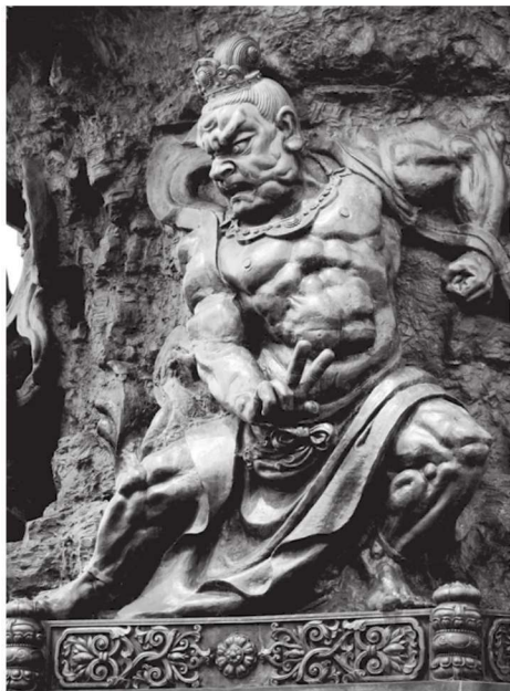
金刚力士 江苏无锡灵山大佛景区