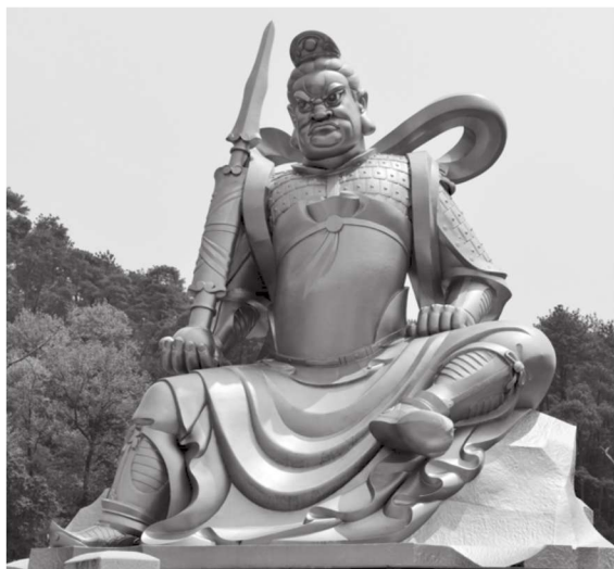
南方增长天王 浙江奉化雪窦寺