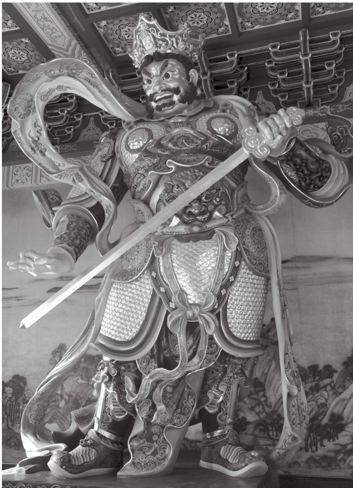
南方增长天王 浙江绍兴龙华寺