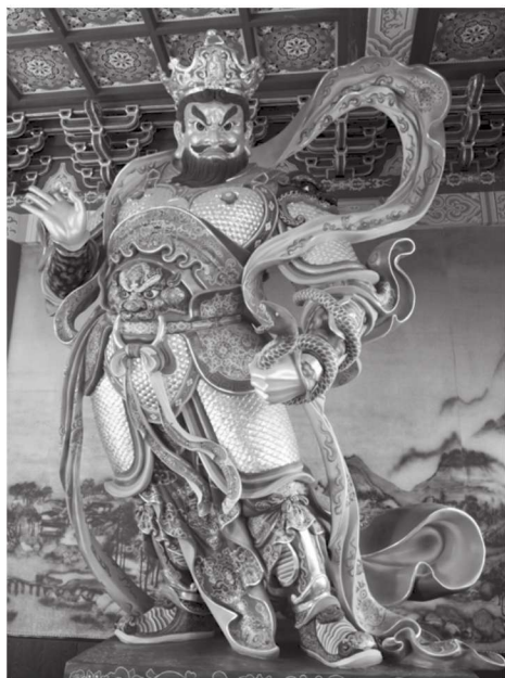
西方广目天王 浙江绍兴龙华寺