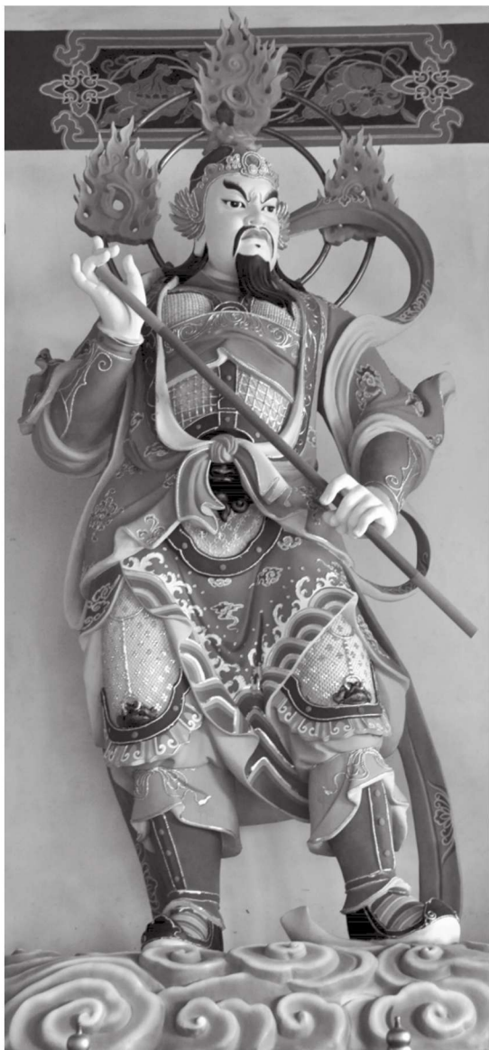
散脂大将 江苏徐州宝莲寺

佛神将作为维护佛法、震慑妖魔的强大威力，造像艺术家们极尽艺术造型之能事，发挥自己的想象，任己胸臆，对护佛神将进行夸张处理。无论是神将的躯干四肢、骨骼筋肉以至须眉毛发，都显得气势雄健威武、神情激愤猛烈，仿佛内在蕴蓄着无穷的力量，达到了力与美的统一，给人一种屹立不拔的气势，为佛门“警卫部队”增添了新的风采。