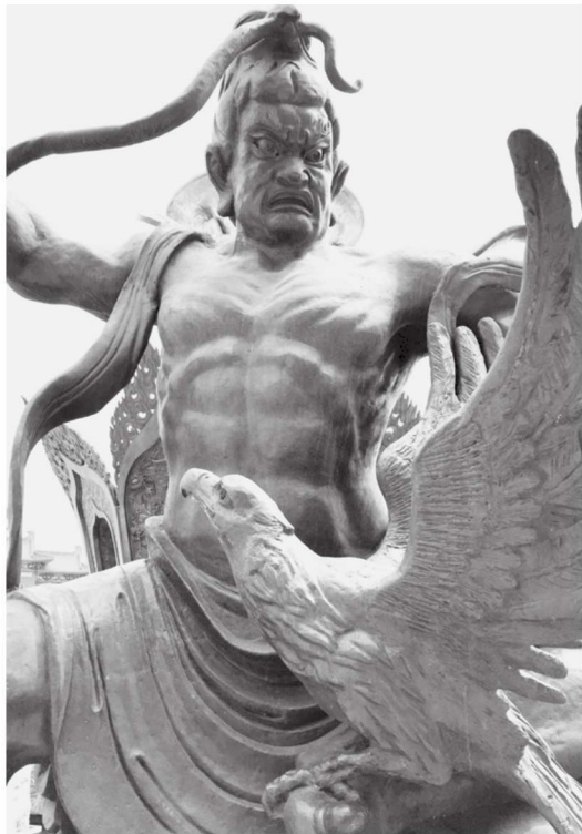
图 1-9 迦楼罗 局部 江苏徐州宝莲寺

的大鹏金翅鸟。密教则将大鹏金翅鸟说成是文殊师利菩萨的化身。因为金翅鸟神一生以毒蛇为食物，体内积蓄着大量毒气，临死时毒发自焚。中国小说《说岳全传》中称岳飞是“大鹏金翅鸟”投胎转世。迦楼罗的形象离不开鸟，有的塑造为鸟形，有的塑造成鸟嘴人形（图 1-8、图 1-9）。