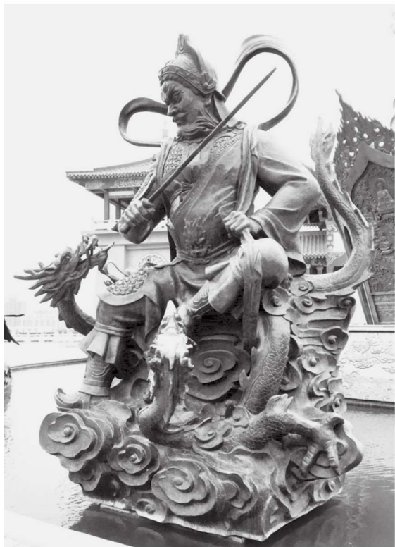
图 1-2 龙部 江苏徐州宝莲寺