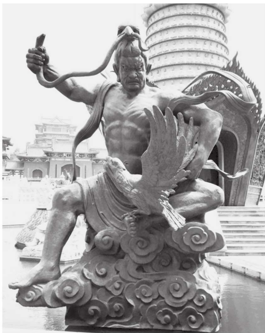
图 1-8 迦楼罗 江苏徐州宝莲寺