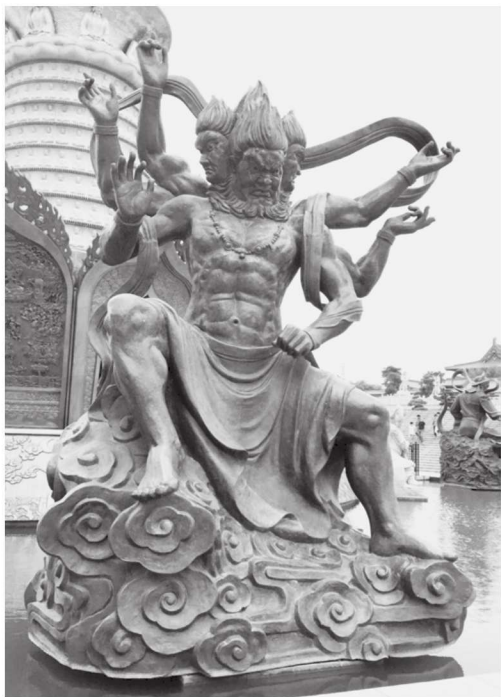
图 1-7 阿修罗 江苏徐州宝莲寺

迦楼罗，就是金翅鸟神。在古印度神话中，这是一种类似于鹭的大鸟，两只翅膀张开，就有336万里，鸟的翅膀上有种种庄严宝色，头上有一颗凸起的如意珠。此鸟以龙（蛇）为食，在一日之内可吃下一个龙王以及500条小龙（蛇），可除掉世间各种毒蛇，益于众生。后被佛祖教化，皈依了佛法。中国的神魔小说中，把此鸟说成是在佛爷头上护法