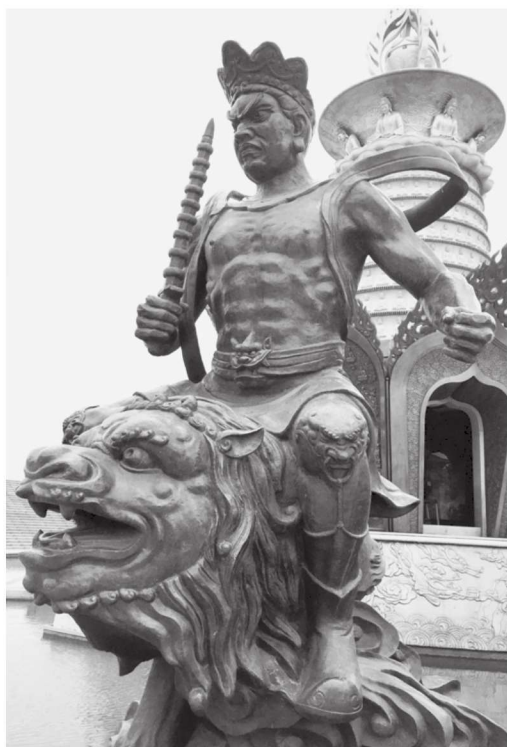
图 1-5 夜叉 江苏徐州宝莲寺