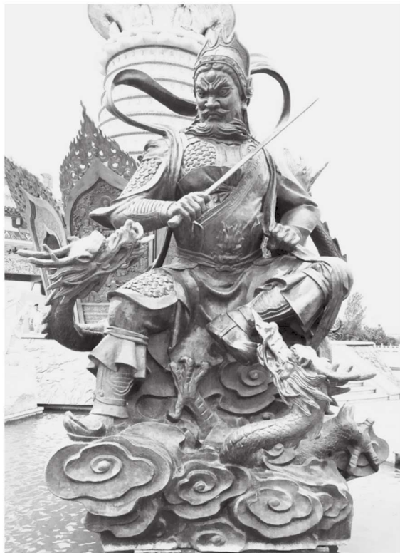
图 1-3 龙部 江苏徐州宝莲寺