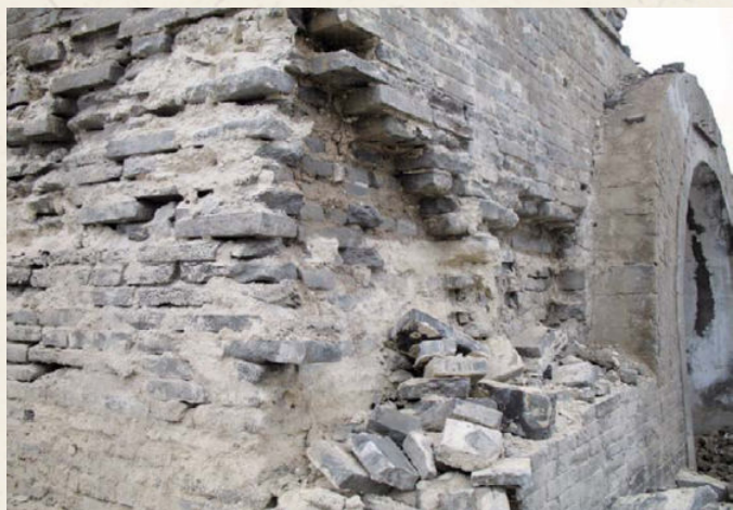
◆ 以前修复曾包砌过券门和墙面