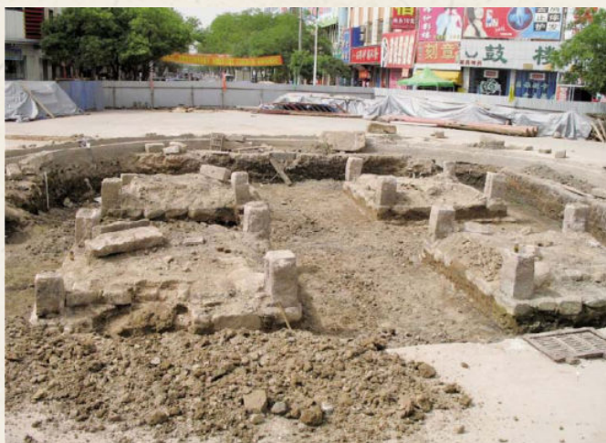
◆ 土层下的原石基础