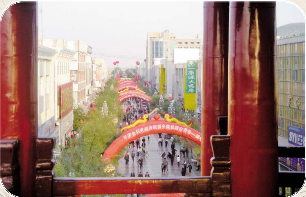
◆从钟鼓楼上俯瞰东大街(维修前)