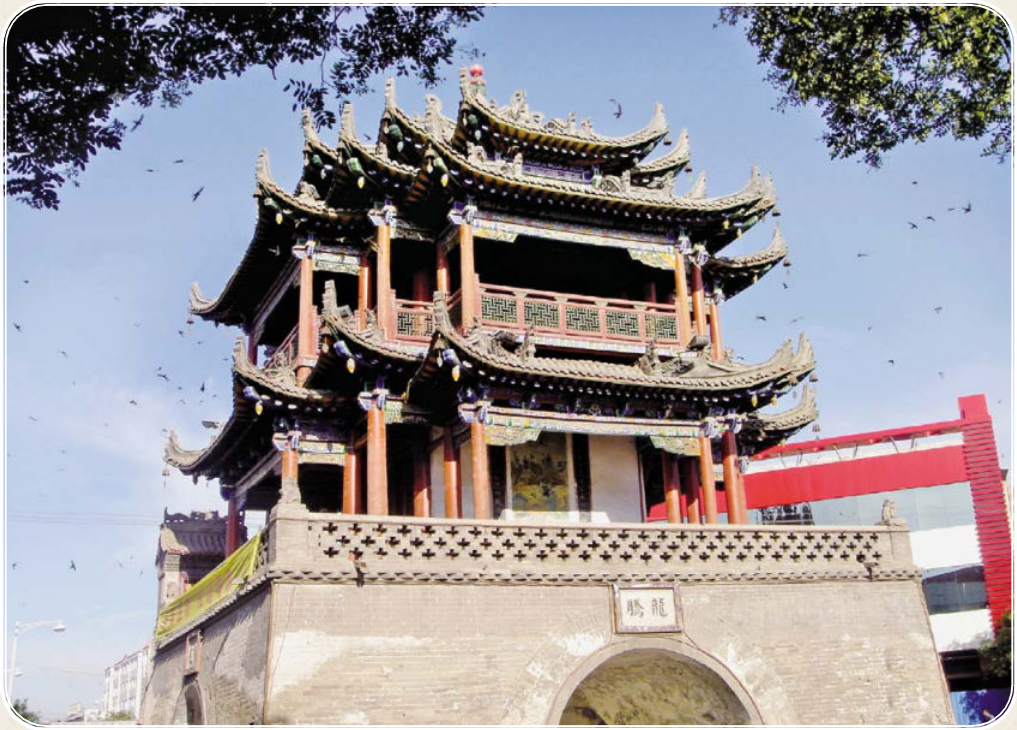
◆俊秀挺拔的平罗钟鼓楼(维修前)