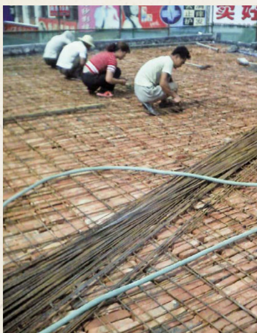
◆ 新增加的台基防水层