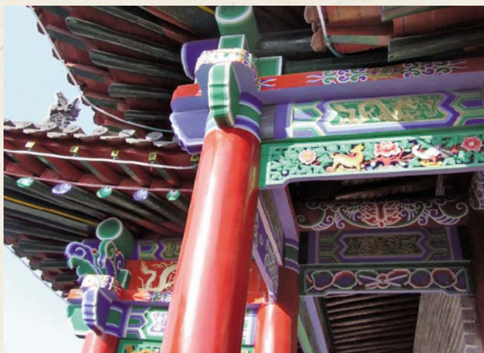
◆ 保持原风格的彩绘