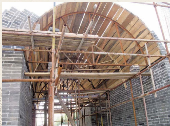
◆ 券 阔