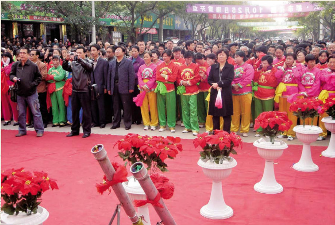
◆ 万人空巷的庆典场面