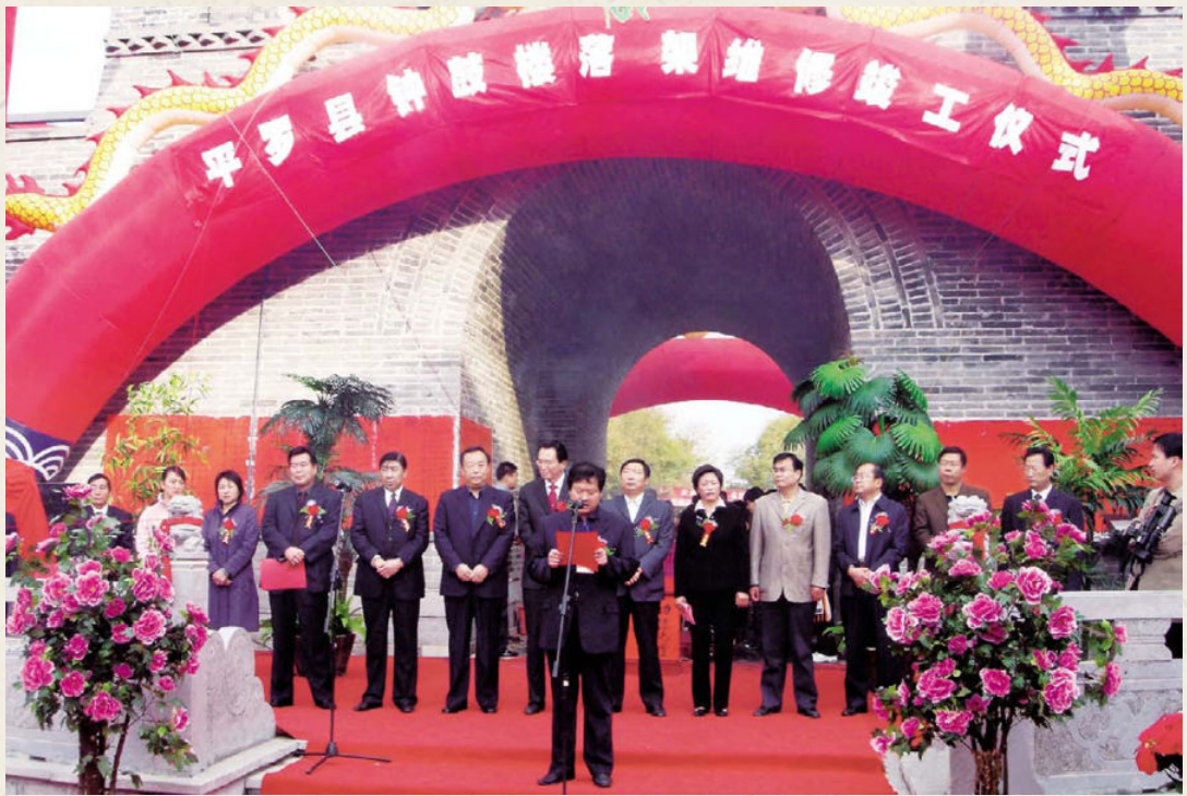
◆ 2006年10月30日落架维修竣工仪式