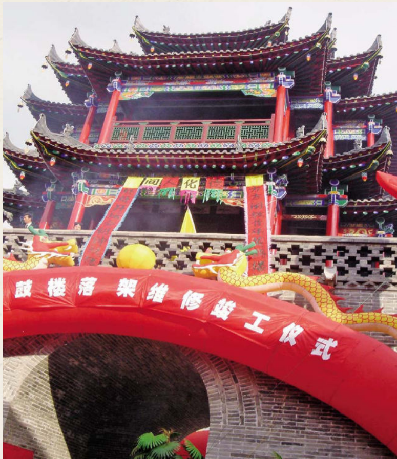
◆ 2006年10月30日维修竣工后的钟鼓楼