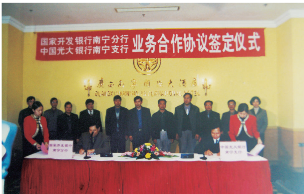
▲ 2001年12月31日，中国光大银行南宁支行与国家开发银行南宁分行在广西沃顿国际大酒店举行业务合作协议签订仪式