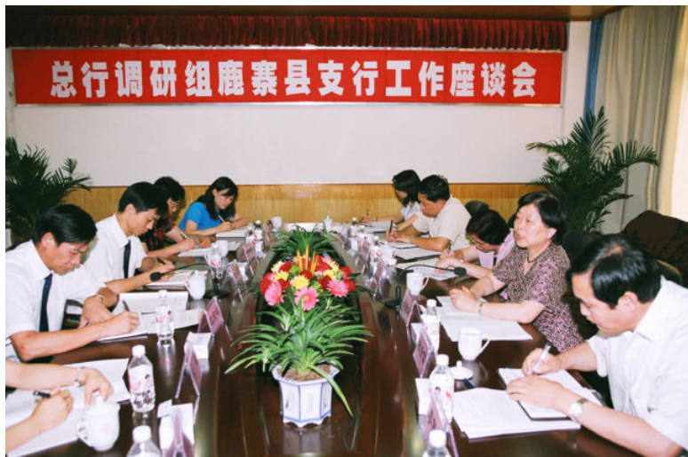
▶ 2005年9月19日，中国人民银行副行长吴晓灵（右二）到鹿寨县调研