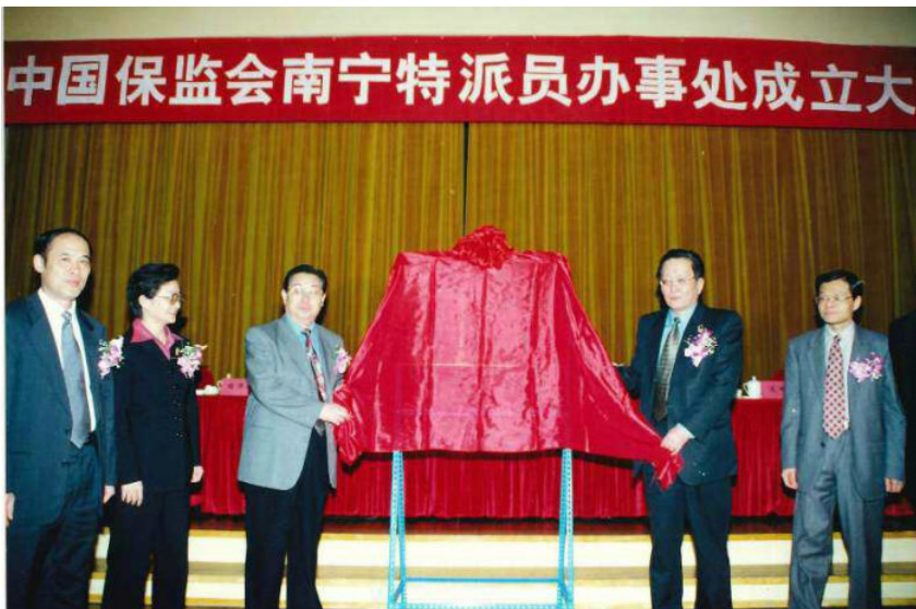
◀ 2001年2月，中国保监会副主席吴小平（右二）、自治区副主席王汉民（左三）为中国保监会南宁特派员办事处成立揭牌