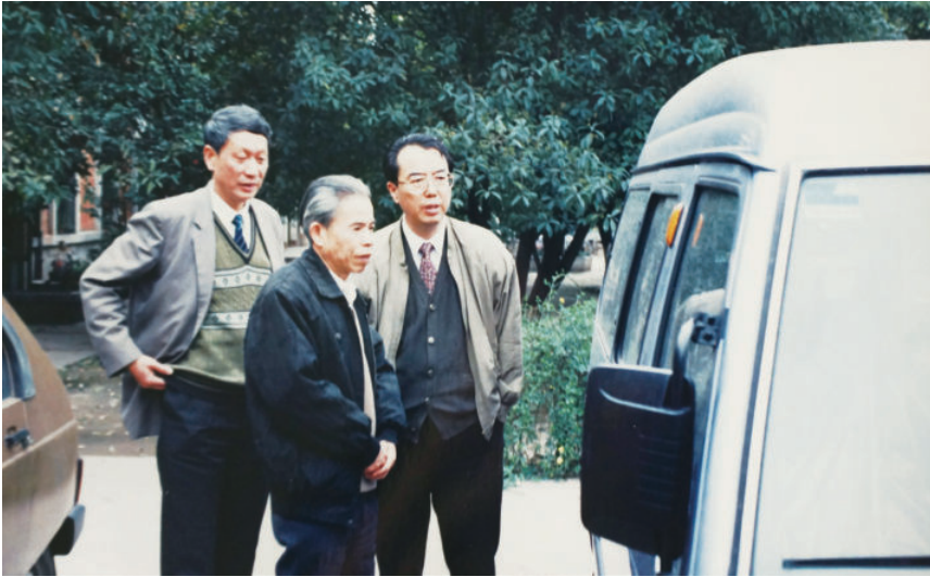
◀ 1994年3月26日，中国人民银行副行长殷介炎（右一）在柳州微型汽车制造厂调研

▶ 1999年5月25日，中国光大银行南宁管理部举行正式揭牌仪式后，中国光大银行行长许斌、副行长王希坤到南宁市的各支行检查指导工作