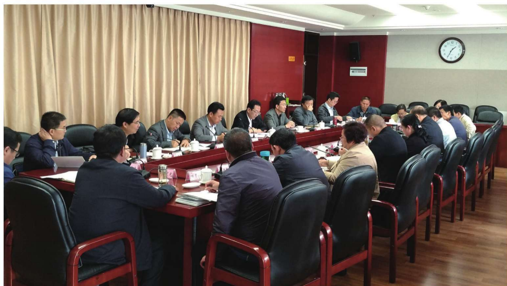
2017年10月13日，云南省科技厅厅长徐彬主持召开生物医药大健康产业发展座谈会