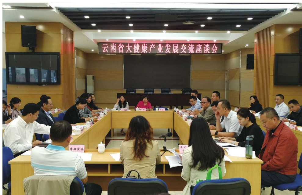
2017年7月14日，课题组参加云南省科技厅召开的大健康产业交流座谈会