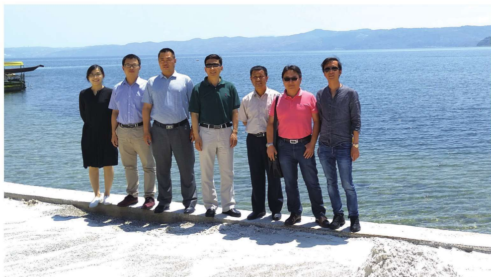
2017年6月7日，课题组调研云南玉溪抚仙湖山水旅游小镇