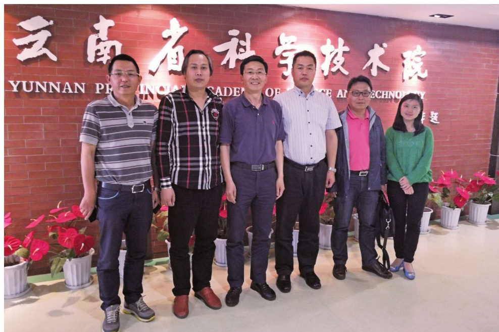
2017年4月12日，课题组在云南省科学技术院