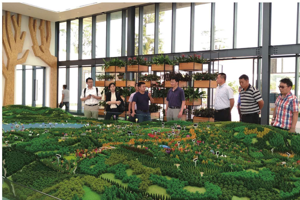
2017年6月9日，课题组调研云南红河州太平湖森林公园康养项目