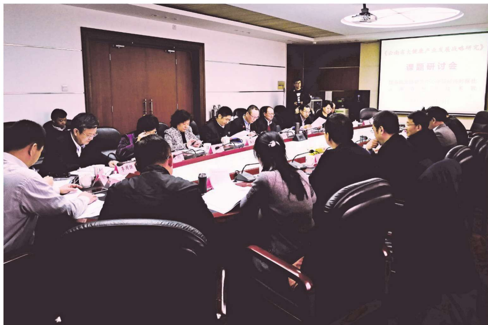
2017年12月29日，在北京召开课题研讨会