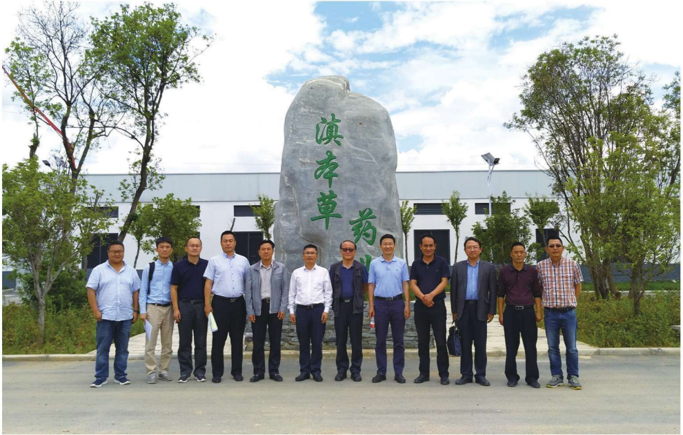
2017年7月13日，课题组调研云南大理州滇本草药业有限公司