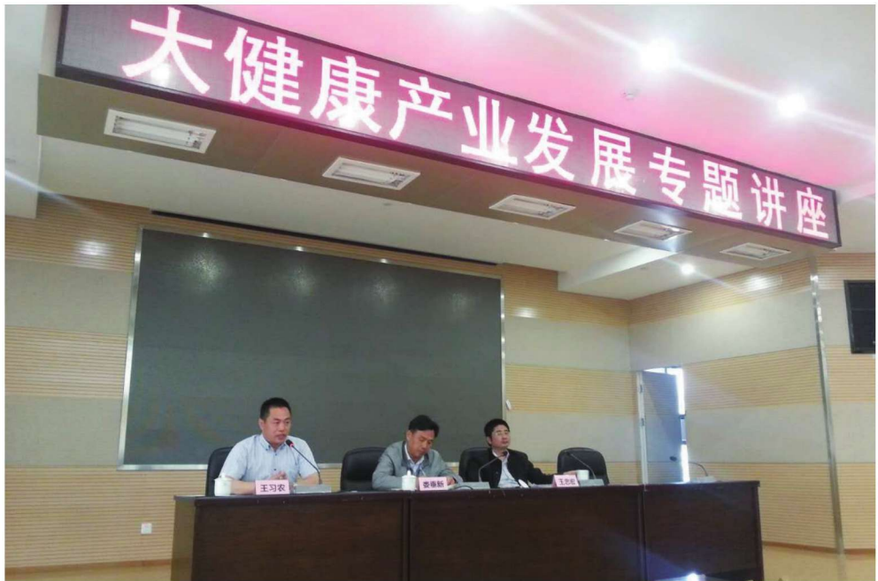
2017年4月12日，课题组举办大健康产业发展专题讲座