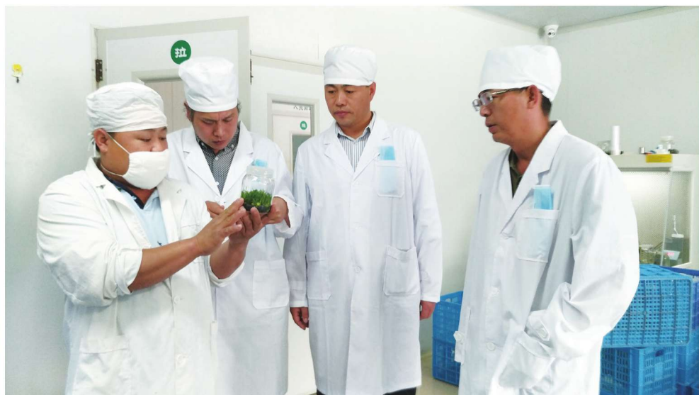
2017年4月11日，课题组在普洱沁茂制药股份有限公司调研