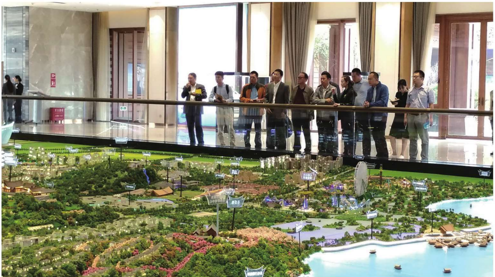
2017年7月14日，课题组调研七彩云南古滇名城滇池国际养生养老项目