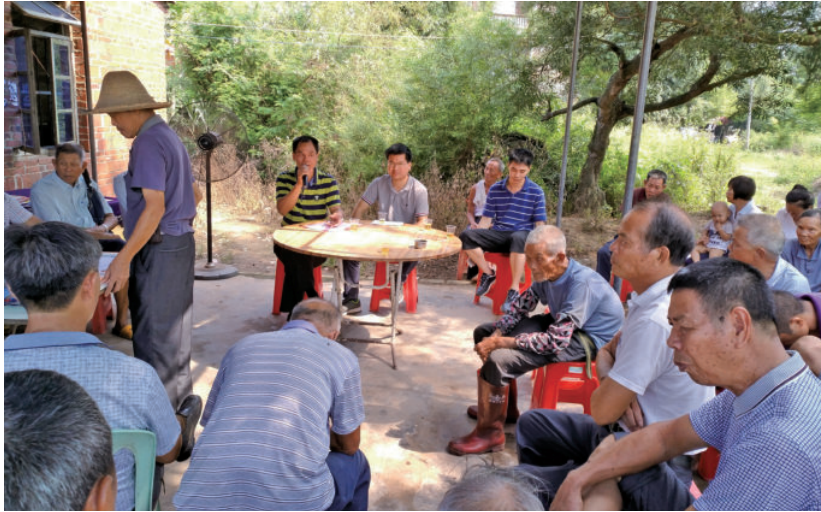
2017年9月20日，茂南区镇盛镇斜岭村第一书记组织召开斜岭村新农村建设暨“三清理三拆除三整治”工作加温会