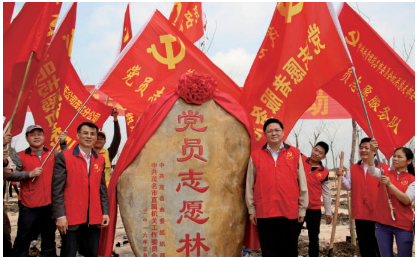
茂名市党员志愿者到露天矿生态公园开展义务植树活动