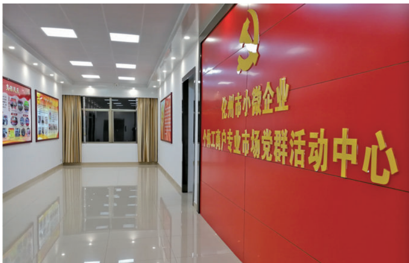
党建创新——化州市小微企业个体工商户专业市场党群活动中心