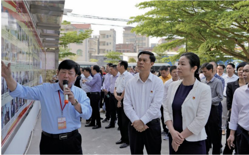
2018年3月30日，全市党员联系户工作现场会在茂南区召开