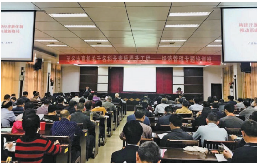
茂名市大力实施“千名科长素质提升工程”，选派1000名优秀科长到高等学府进行专业知识培训