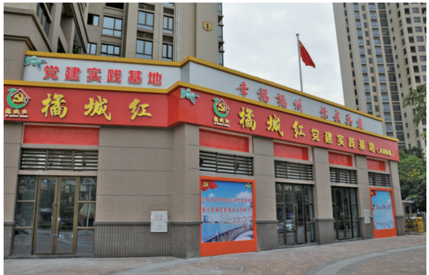
党建创新——化州“橘城红”党建实践基地