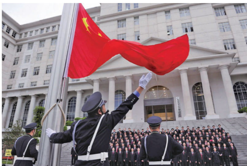
茂名市中级人民法院在 新综合审判楼前举行升 旗仪式