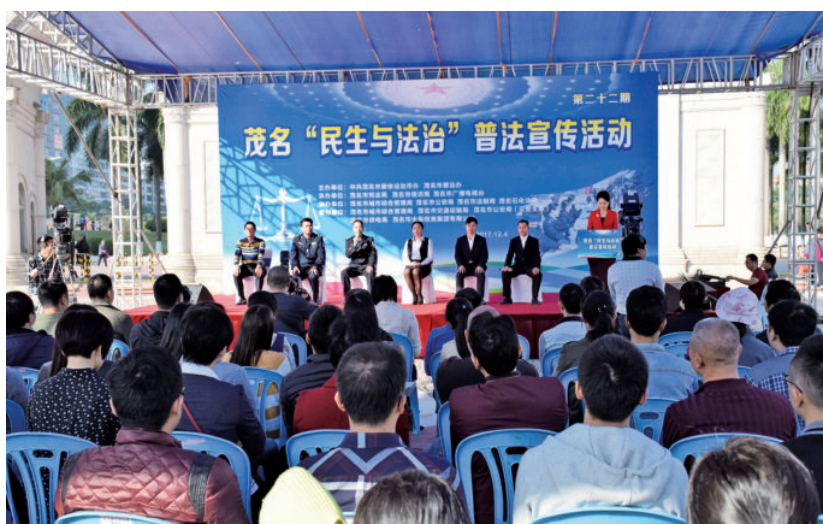
2017年12月4日，茂 名市举办茂名“民生与 法治”普法宣传活动