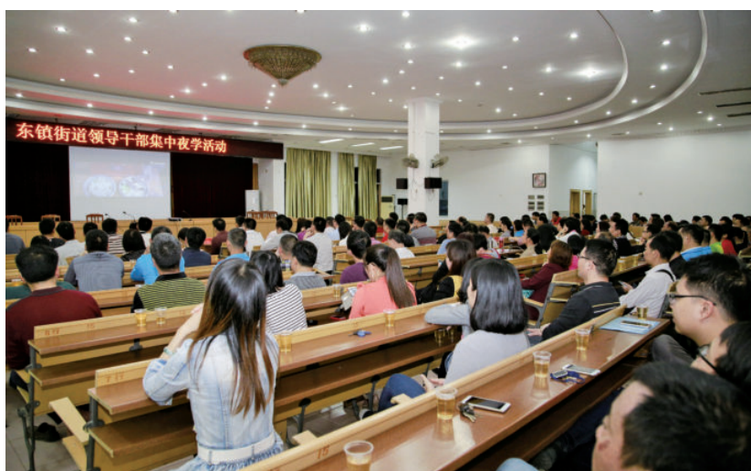
茂名市坚持组织镇村党 员干部开展夜学活动， 利用晚上集中学习