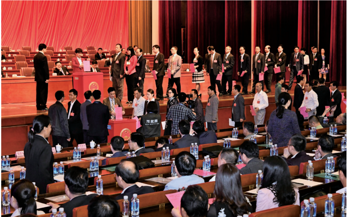
行使民主权利——人大代表投票选举