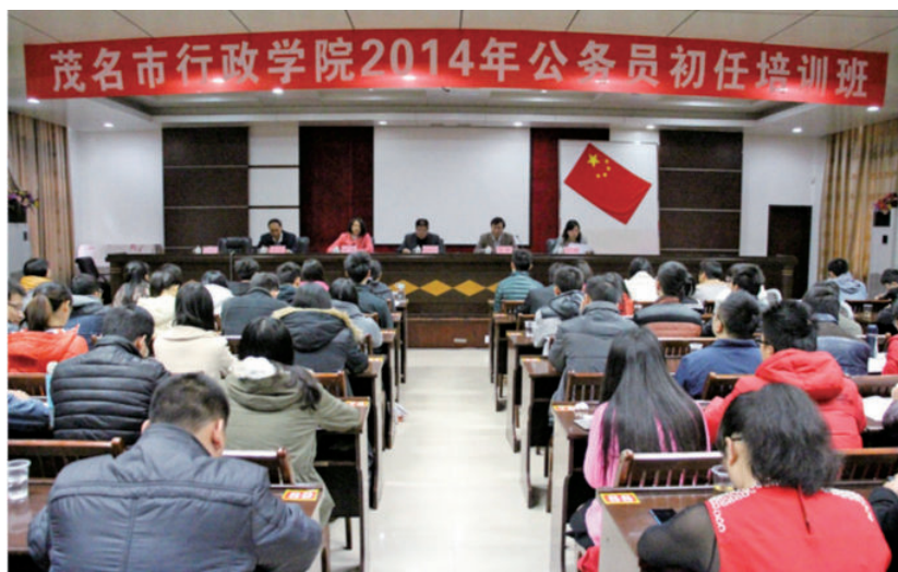
茂名市行政学院举行 公务员初任培训班开 班仪式