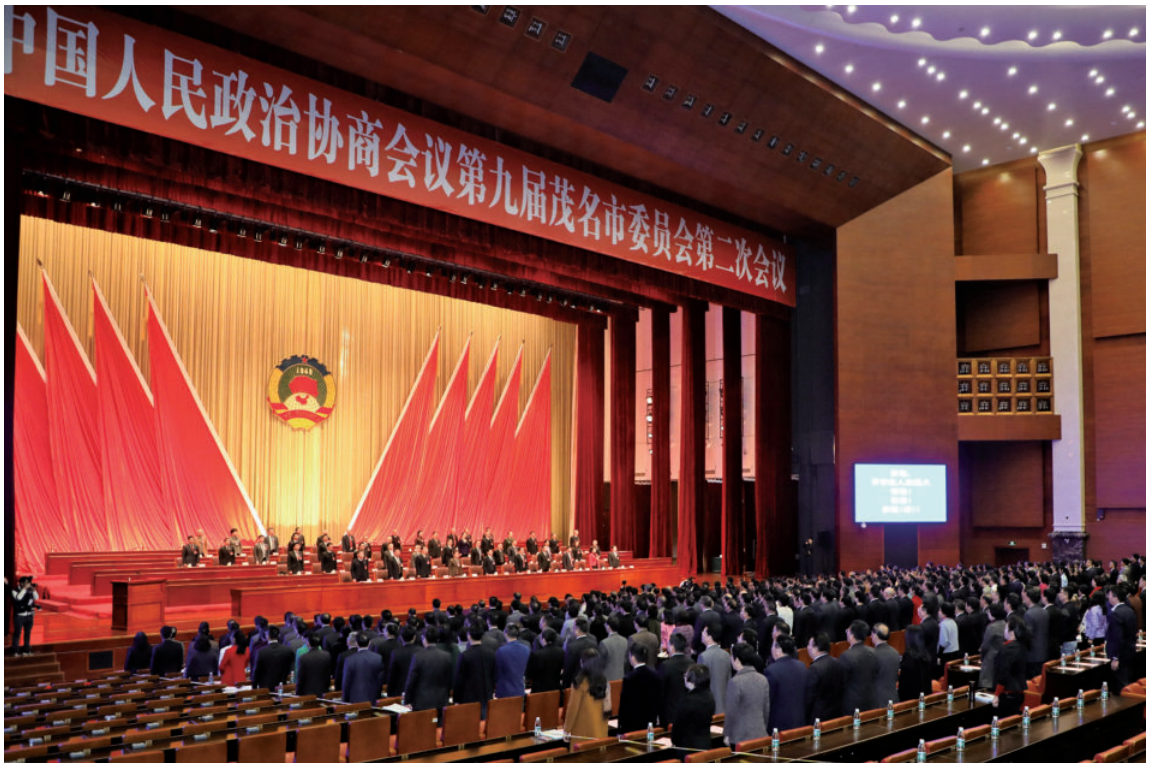
协商民主在发展——茂名市政协九届二次会议开幕（2018年）