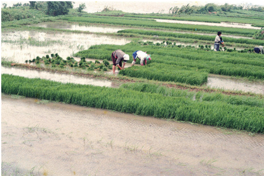
20世纪80年代初家庭联产承包责任制实施后,昆山县周庄农民在责任田劳作

田包产到户。由于政策限制,苏州留下了进一步改革的空间。即便如此,专业承包、联产计酬的方式也大大调动了农民的生产积极性,农民高兴地说:“过去上工队长吹哨子,千斤担子一人挑。现在社员个个出勤早,千斤担子大家挑!”