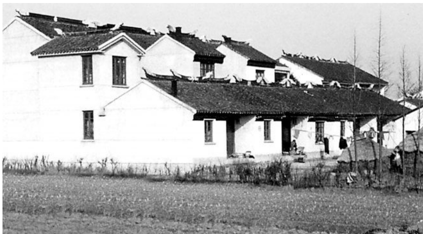
20 世纪 80 年代初的苏州农村面貌

苏州市工农业总产值人均接近 800 美元。“达到这样的水平,社会上是一个什么面貌?发展前景是什么样子?” ① 小康景象是邓小平特别关心的问题。省委主要负责同志汇报了苏州工农业总产值达到人均 800 美元后,群众在吃穿用、就业、住房、公共福利事业、精神风貌等方面将发生的变化,邓小平听了很是欣慰,称赞江苏和苏州的工作搞得好、了不起。苏州农村的新面貌、新气象,让邓小平对小康社会构想有了更直观的体验,在视察太湖时,他望着岸头一幢幢白墙青瓦的农民小楼房说:“我这一次来到江苏以后,发现老百姓都喜气洋洋的;另外你们这儿建了那么多新房子。农民都有房子住了,非常好!” ② 回到北京后,邓小平还专门让办公室同志与苏州地委领导核实相关数据。