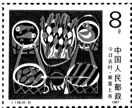
◎《今日农村》邮票——新菜上市 (1987年6月25日)

尽管秦人以面食为尚，且面食花样多，如饺子、包子、馄饨的馅可以是韭菜、葱、芹菜、竹笋、荠菜、莲菜、萝卜、白菜与大肉、牛肉、羊肉或鸡鸭肉搭配，搭配由主人选择。荤素结合，营养平衡，无论北方人、南方人，还是异国客人，都容易接受。臊子面的臊子可以是鸡肉或牛肉、大肉、羊肉与豆腐、时鲜的葱、萝卜、芹菜、胡椒等结合而成。唐代副食以葱、萝卜、韭菜、葱、姜、蒜、竹笋等蔬菜为