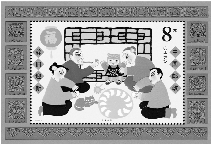
◎《春节》邮票小型张（2000年1月29日）