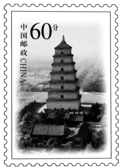
◎《大雁塔》普通邮资明信片邮资图 (2000年9月20日)

1986年，鬼使神差，让我从史学板块中小心翼翼地伸出来，试图在民俗文化领域里拓宽研究视野。那时，我正在为《秦汉文化史》中《节俗》一节惶恐，约2千字的节俗却用了3个月，我深深地认识到节日