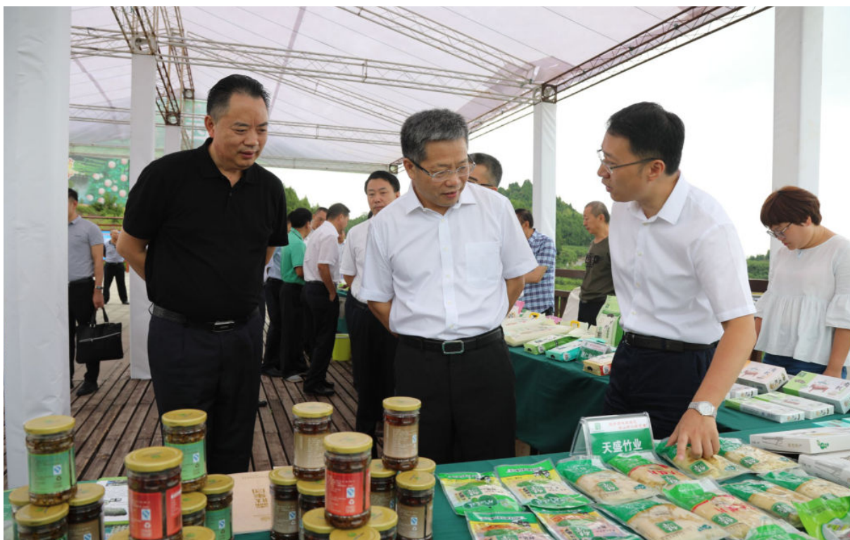
8月22日，广西壮族自治区政协副主席、百色市委书记、市人大常委会主任彭晓春（中）带领百色市党政代表团到西充县考察脱贫攻坚工作