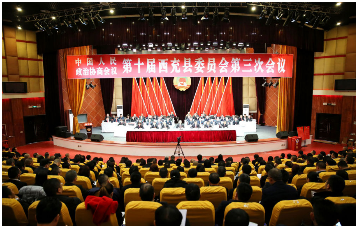
1月21日—24日，政协第十届西充县委员会第三次会议召开