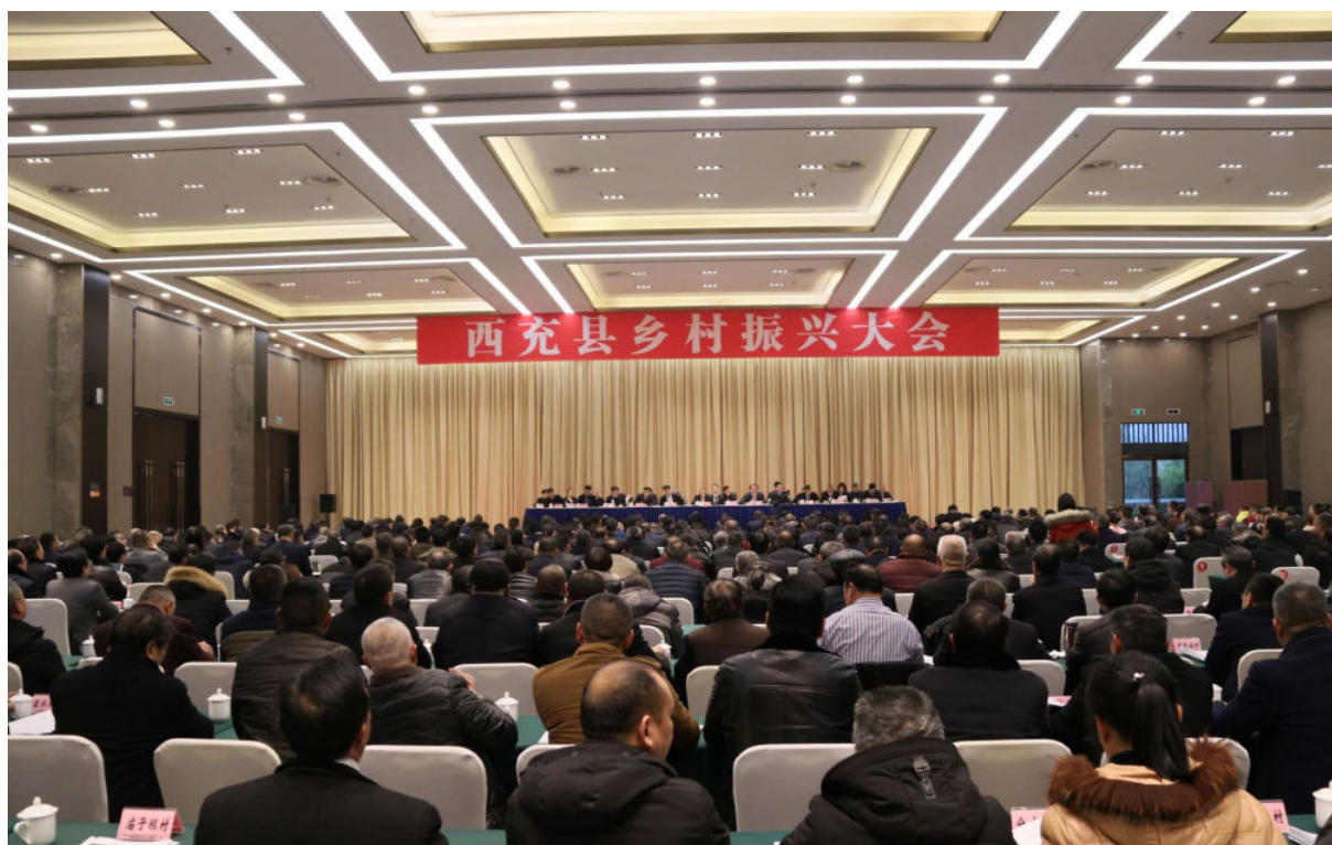
12月24日，西充县召开乡村振兴大会