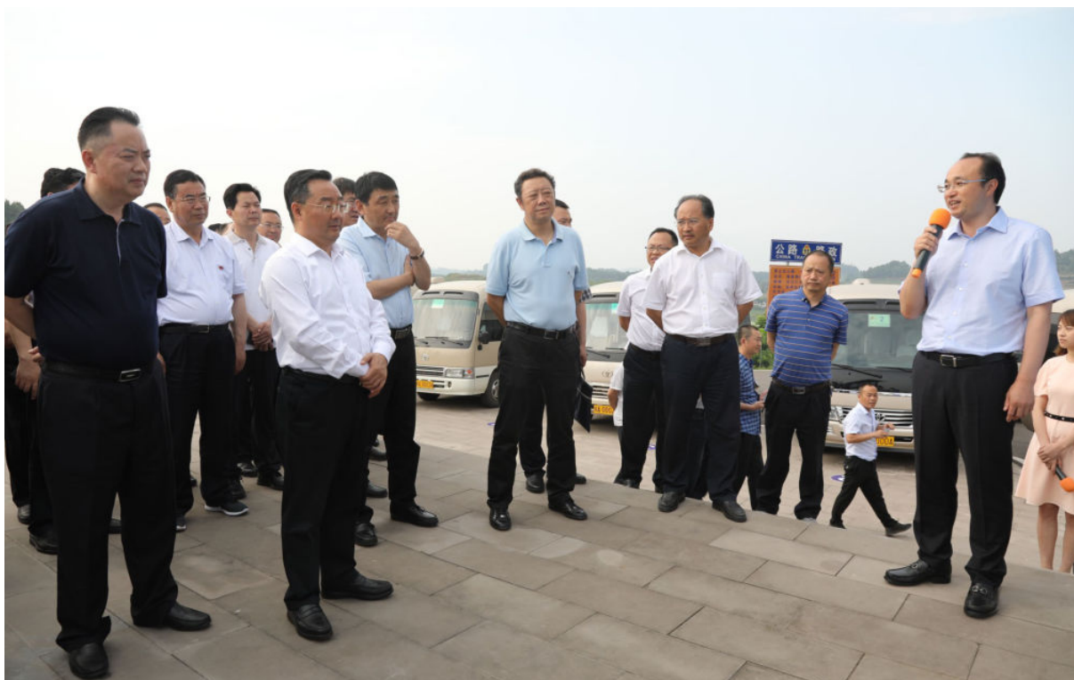
5月31日—6月1日，甘肃省委副书记、省长唐仁健（左二）率甘肃省代表团一行来西充县考察脱贫攻坚工作