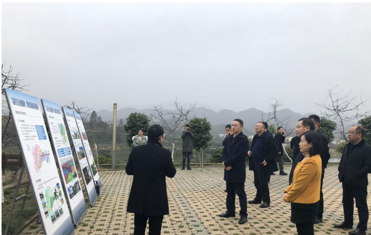
12月4日，西充县委书记孙骏（中）率队到邛峡考察