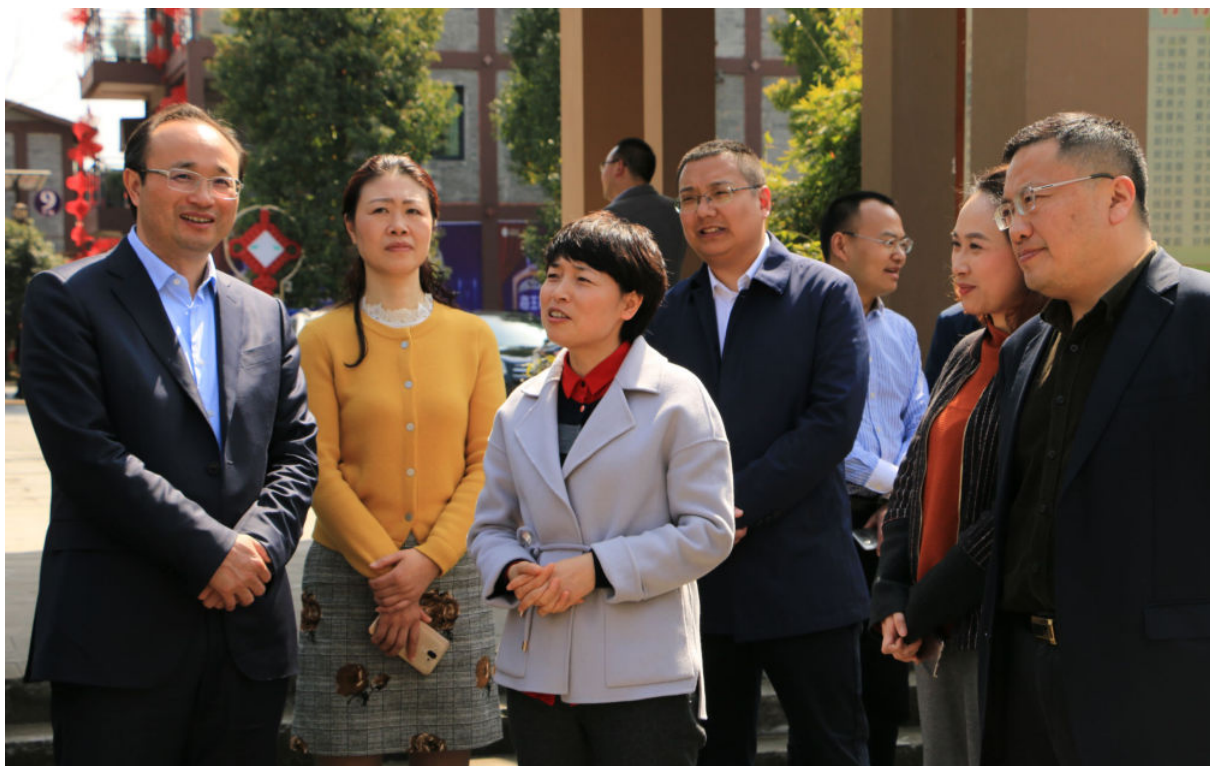
3月8日，四川团省委书记刘会英（中）调研共青团西充县委参与实施乡村振兴战略工作