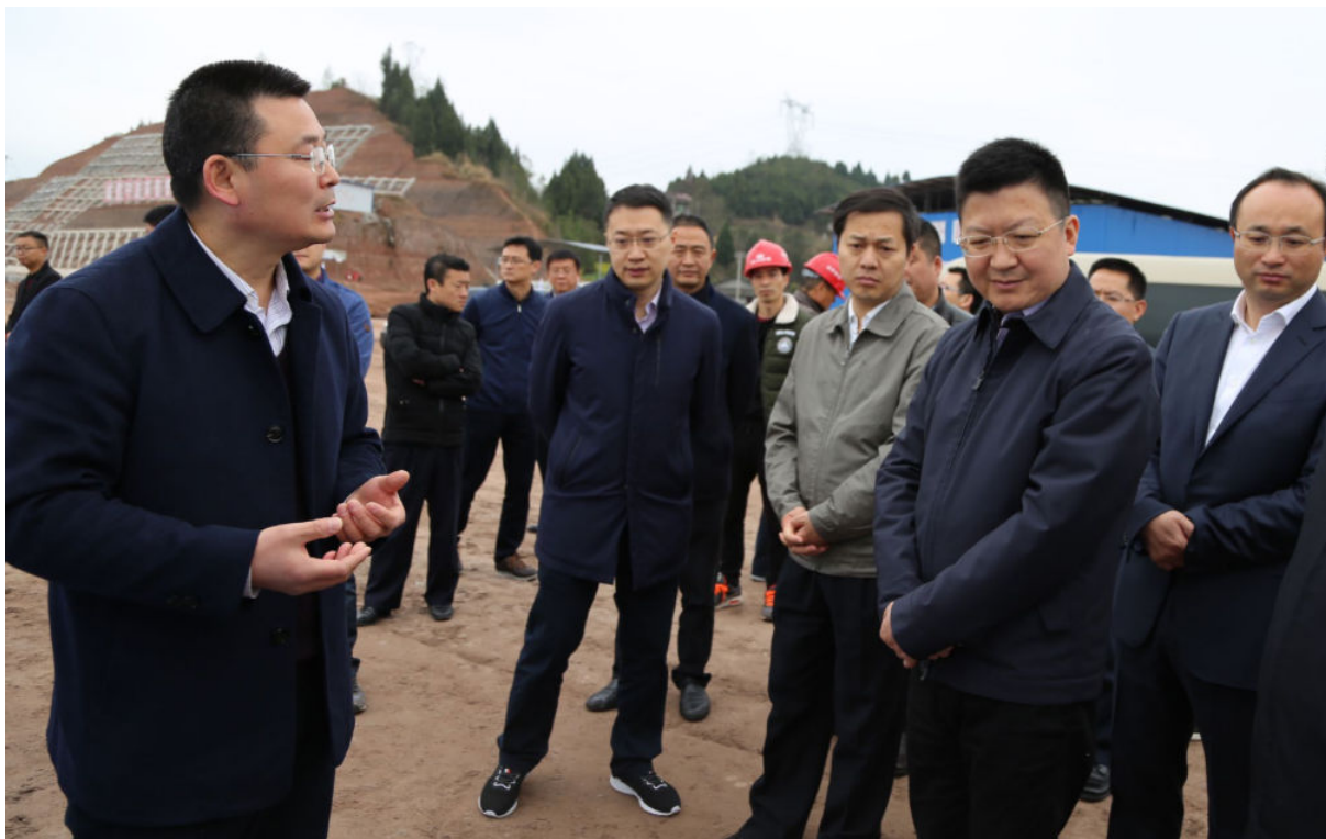
3月5日，四川省交通运输厅厅长汪洋（右二）调研绵（阳）西（充）高速公路进展情况