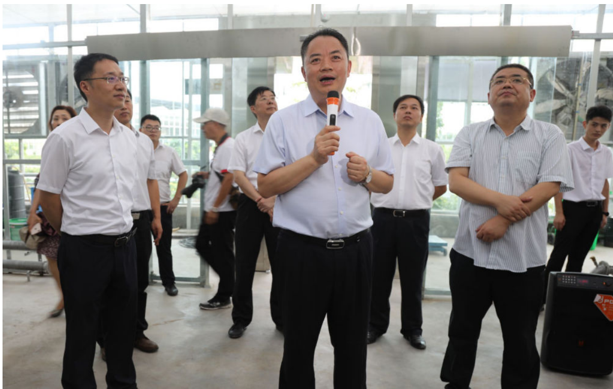
7月27日，南充市委书记宋朝华（中）参加在西充举行的南充市重点项目拉练会