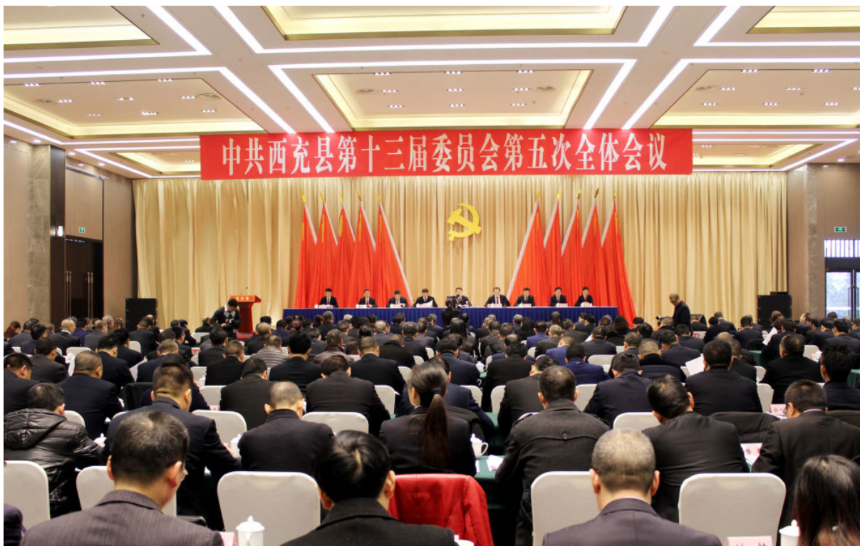
1月17日，中共西充县第十三届委员会第五次全体会议召开