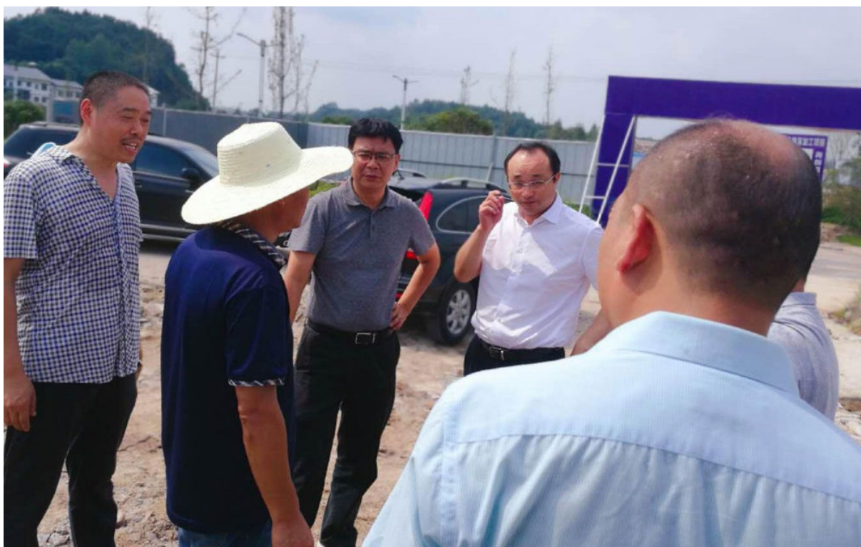
7月18日，新川蒲食品科技成都有限公司到西充考察红薯精深加工项目