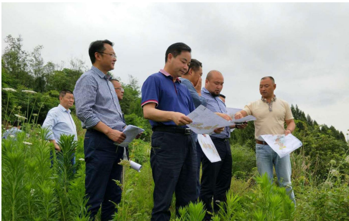
5月22日—23日，丽珀集团领导到西充考察