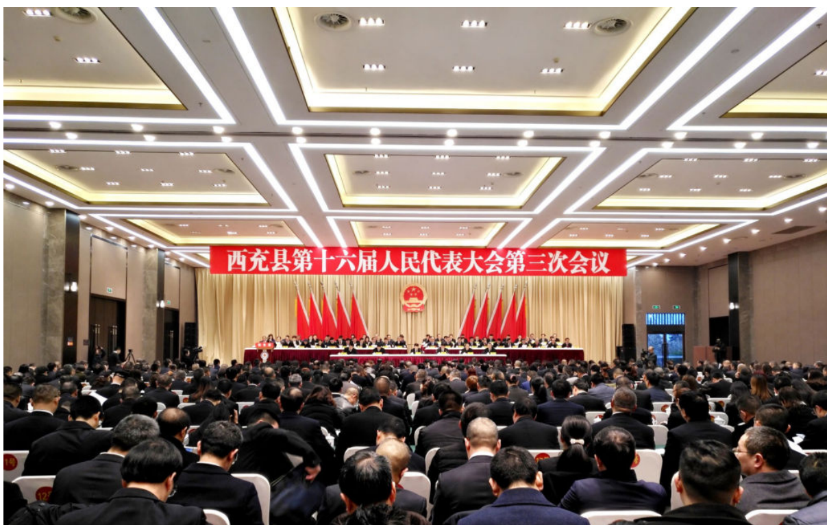
1月23日—25日，西充县第十六届人民代表大会第三次会议召开