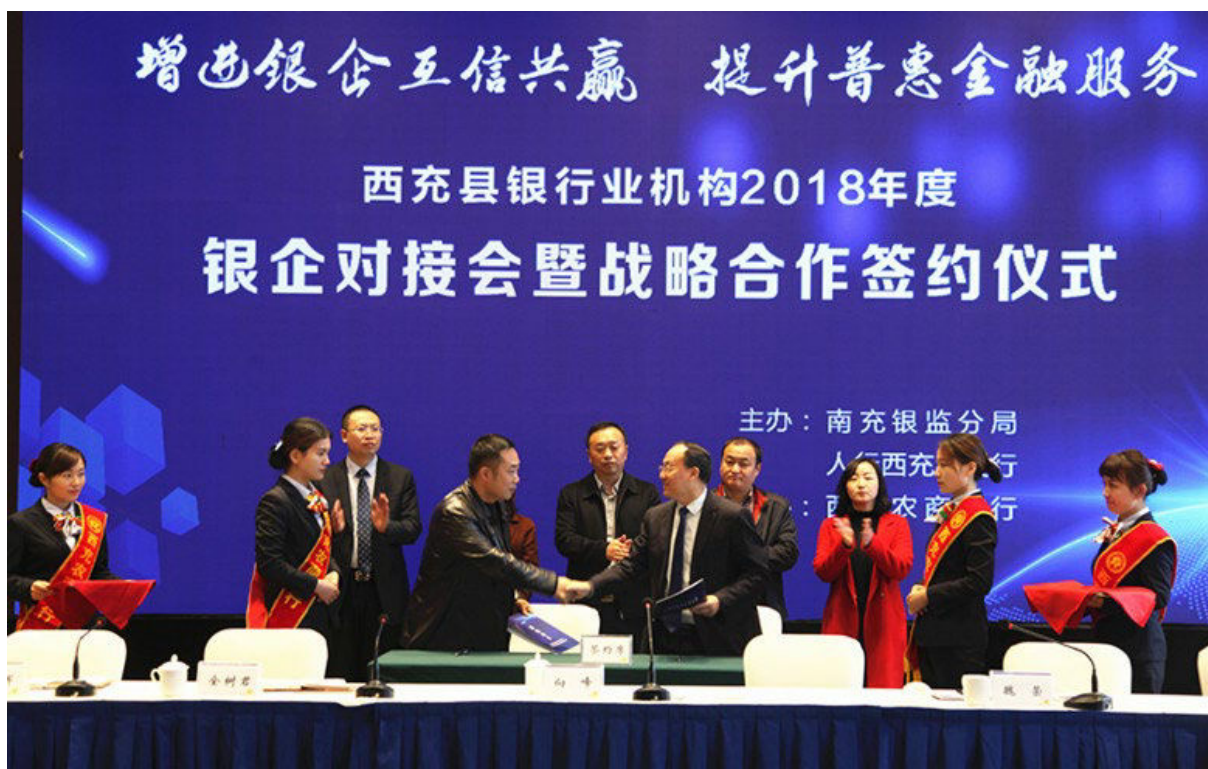
11月9日，召开西充县银行业机构2018年度银企对接会暨战略合作签约仪式