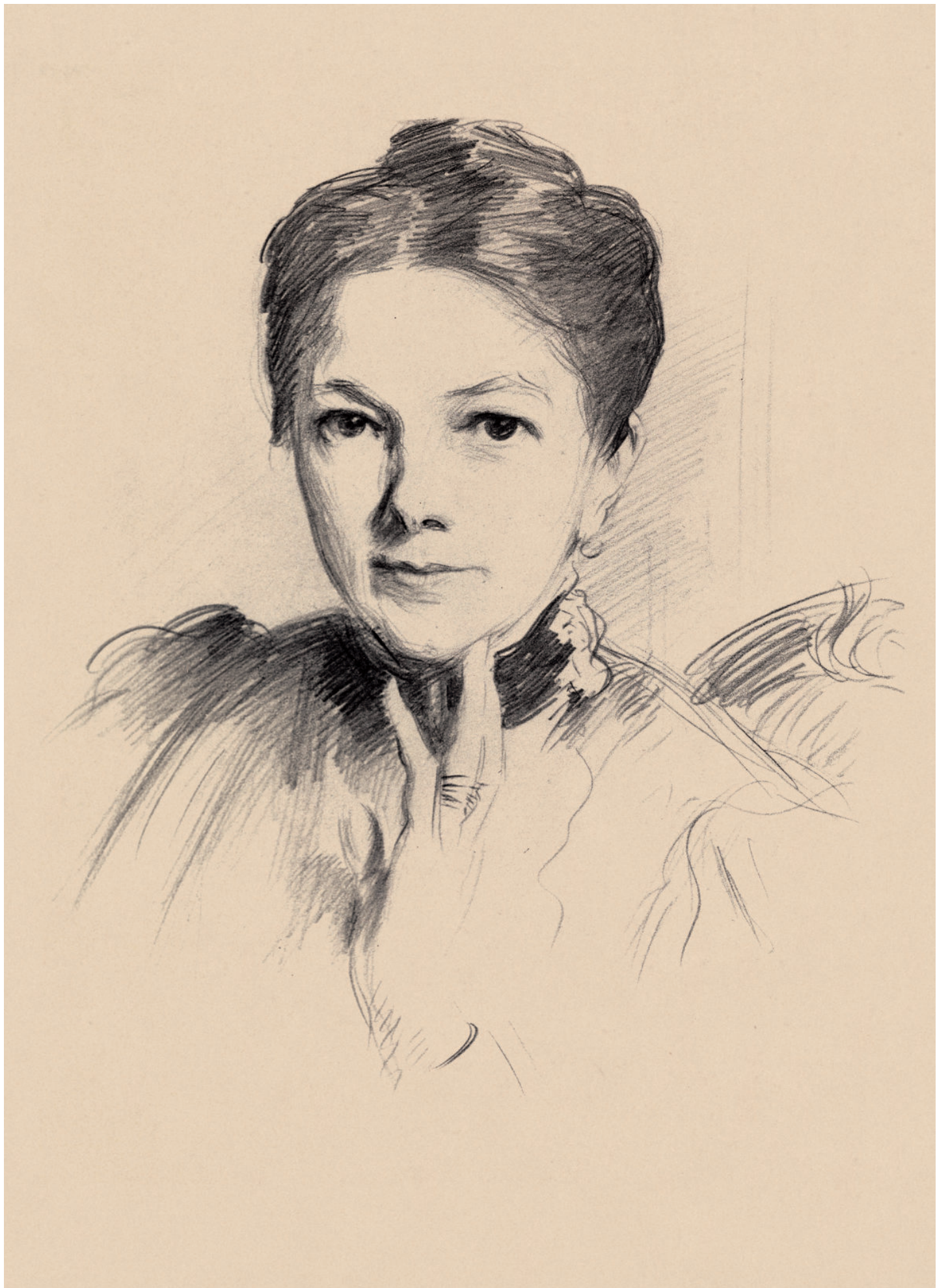
路易斯·奥蒙德夫人