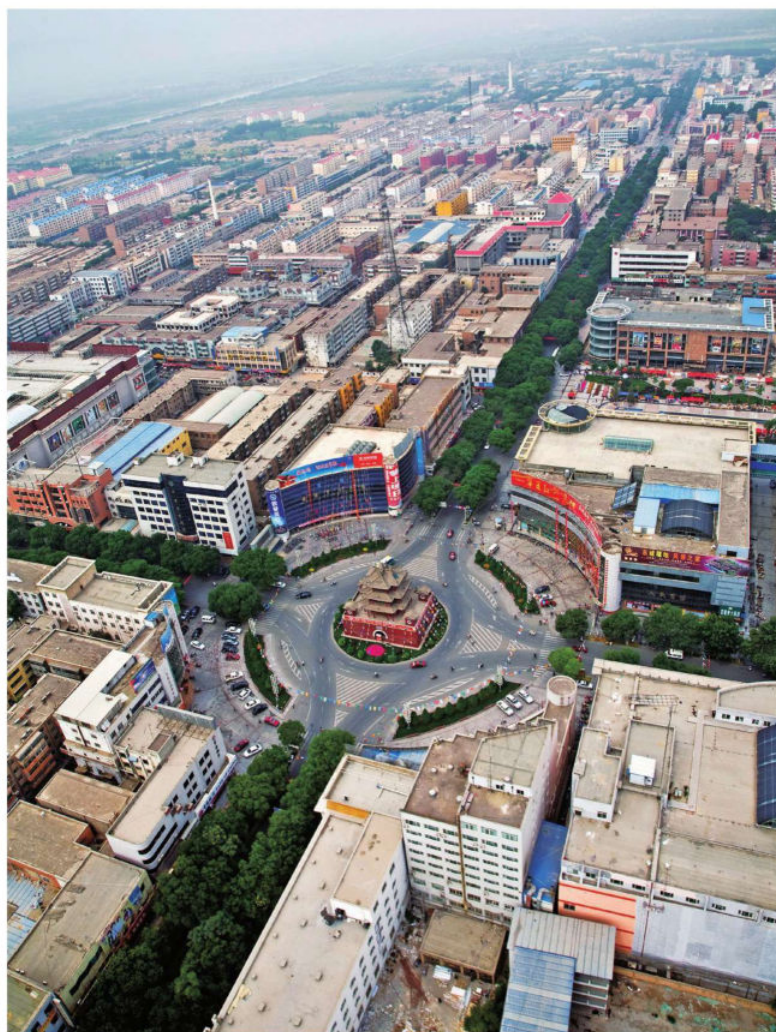
中卫老城区