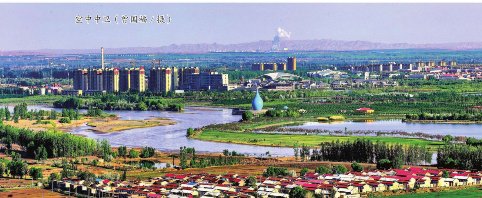
空中中卫