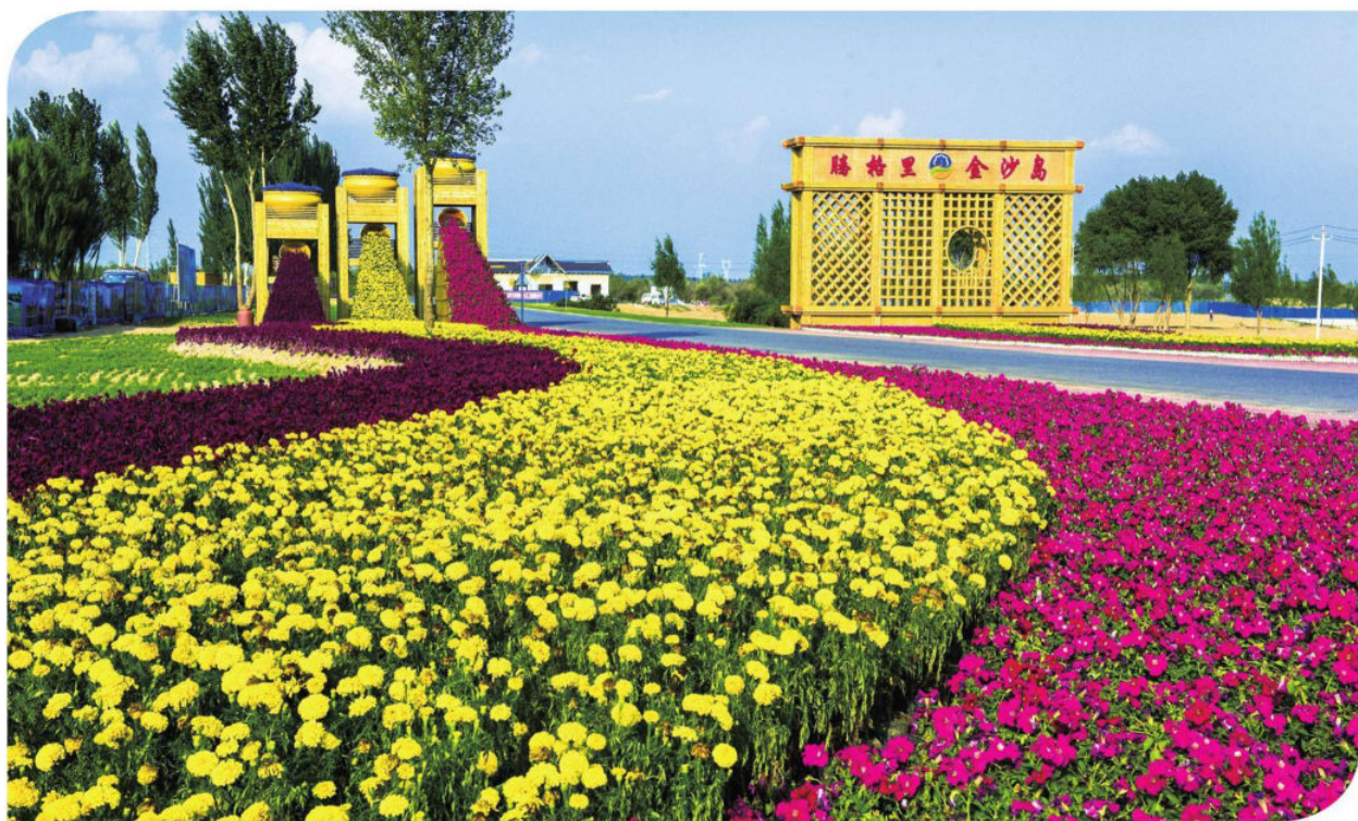
大漠花园金沙岛组照一