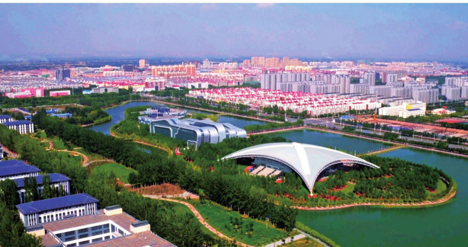
俯瞰中卫