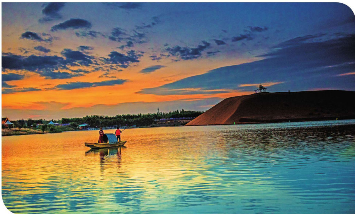
大漠花园金沙岛组照三