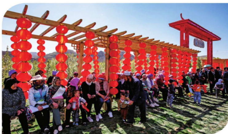
梨花节带动乡村旅游