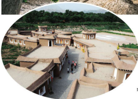
南长滩民俗文化村