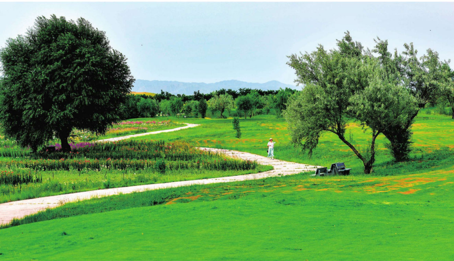
生态金沙岛