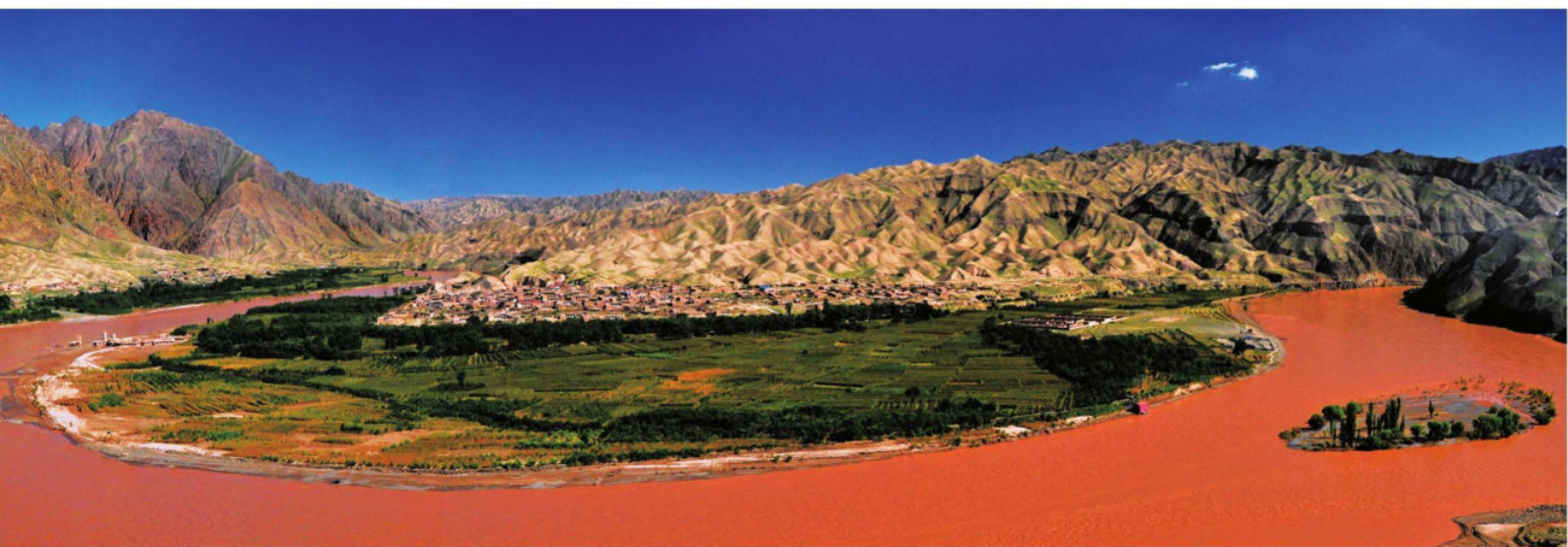
中国历史文化名村——南长滩