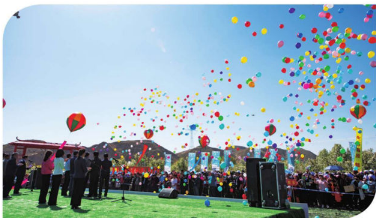
关桥梨花节