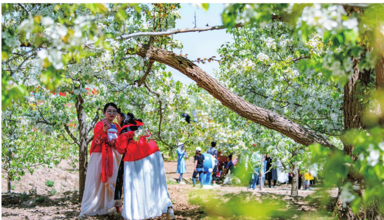
关桥梨花