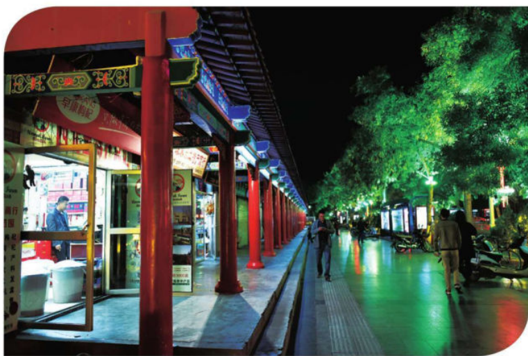
古城夜色