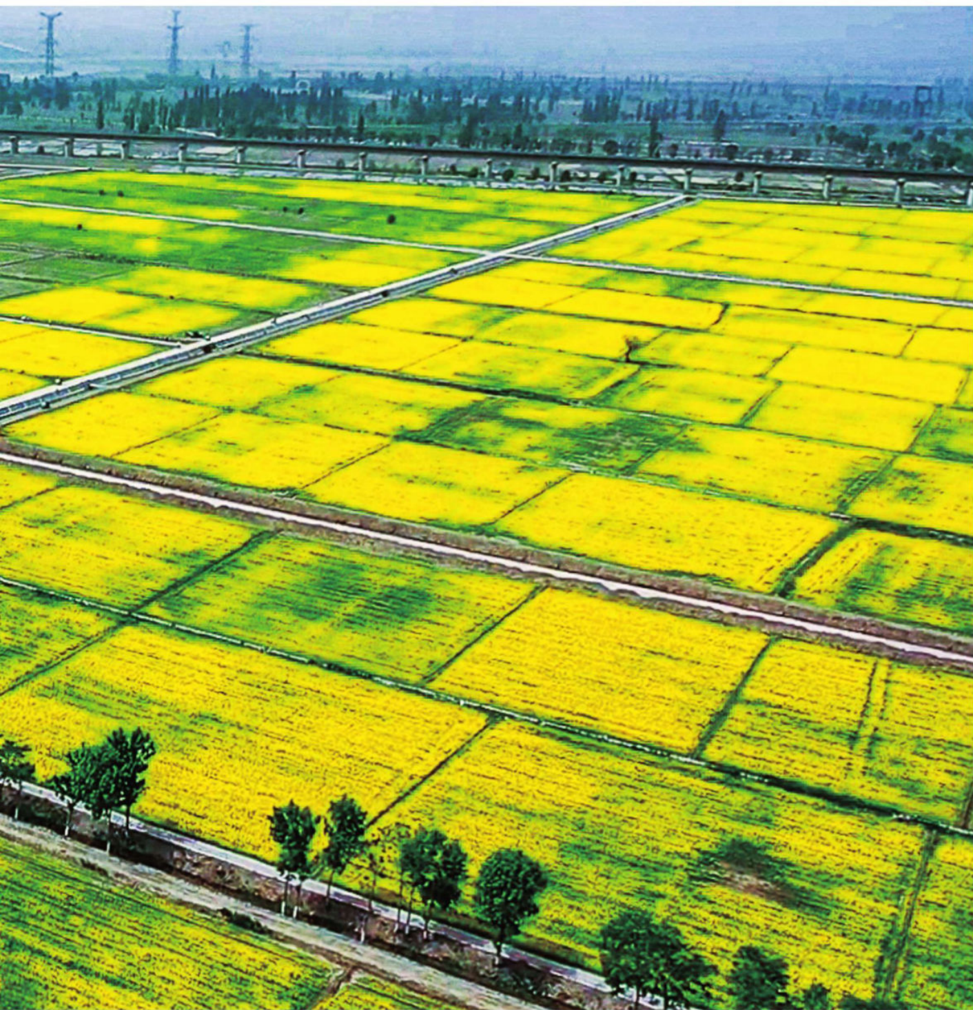
田园风光