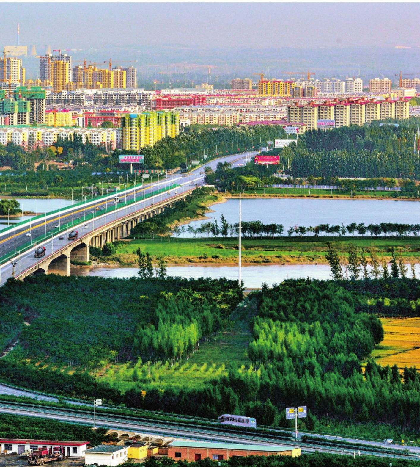
走进中卫