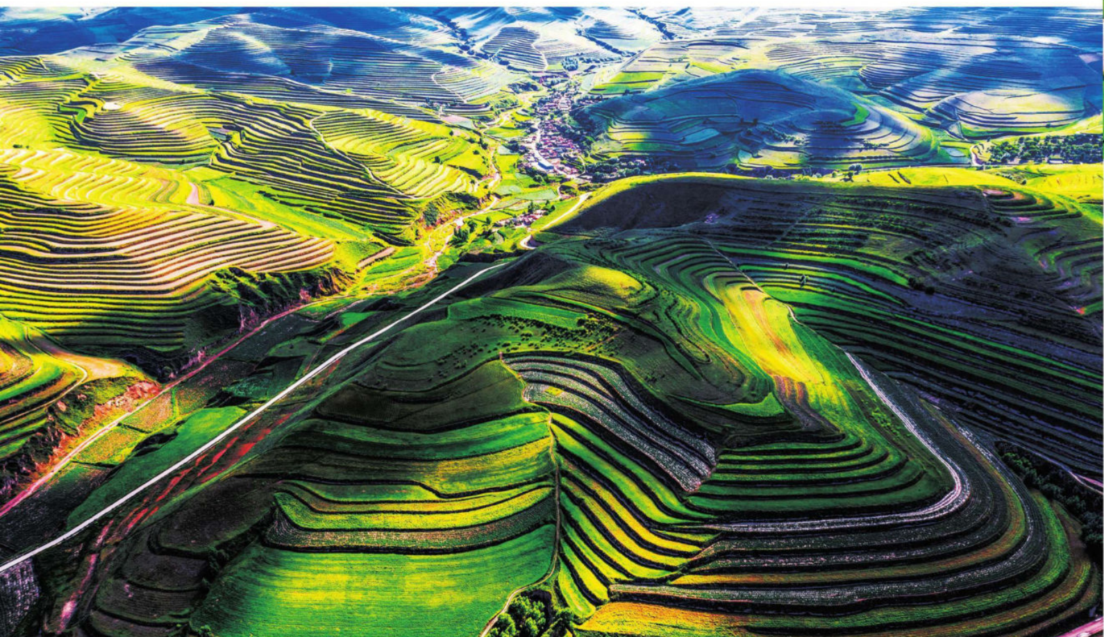
海原梯田