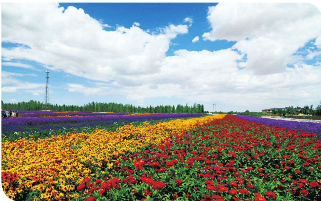
大漠花园金沙岛组照四