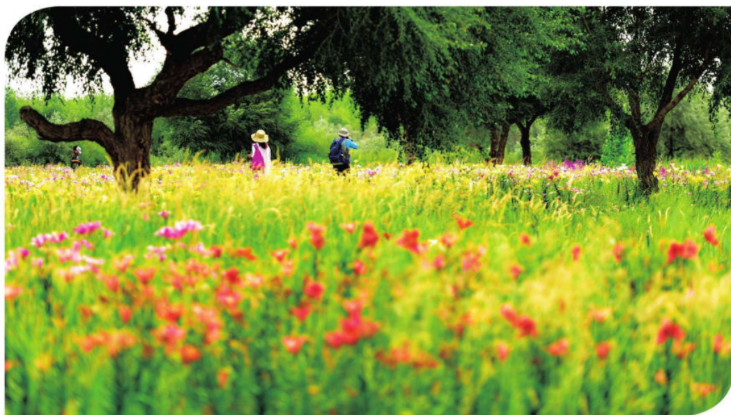
百合盛开金沙岛