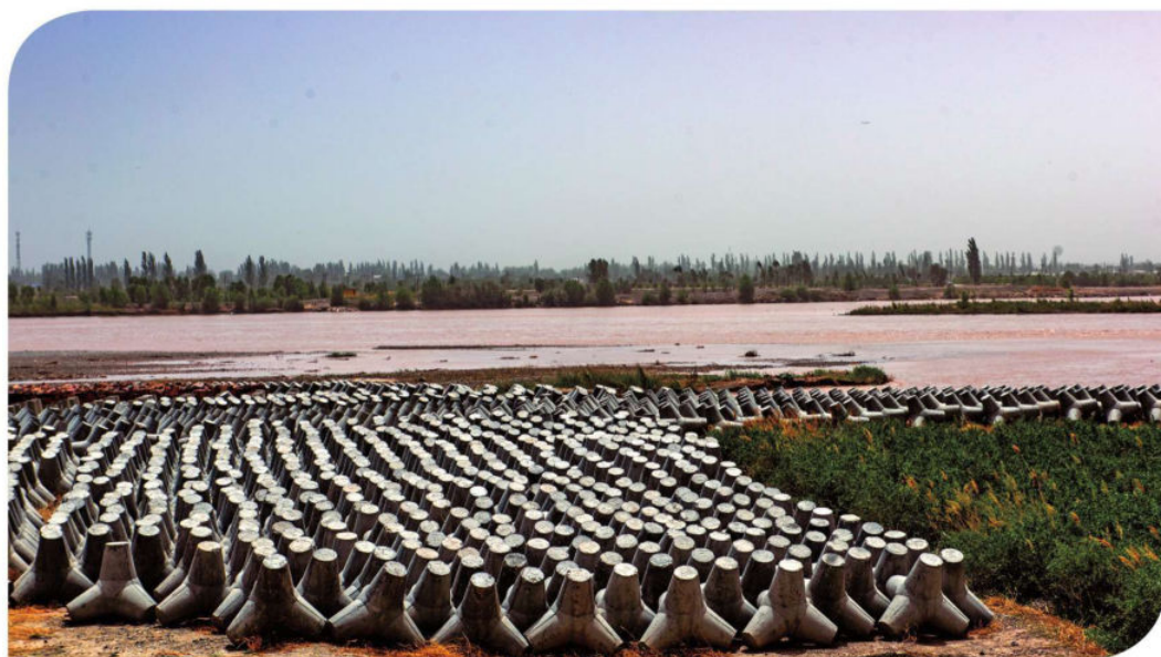
防洪物体