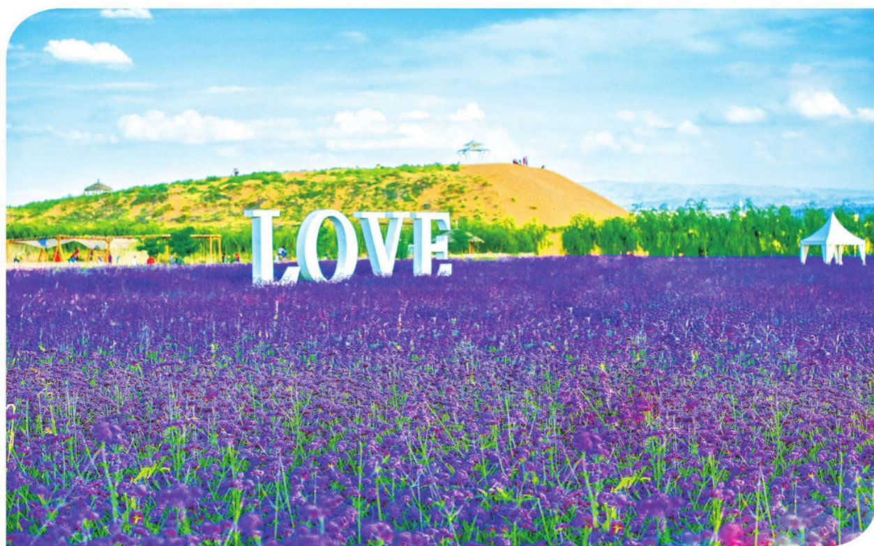
大漠花园金沙岛组照二