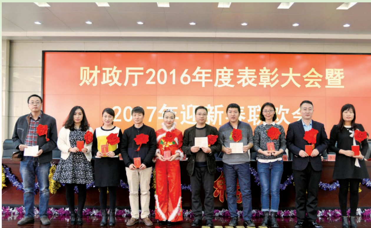
2017年1月24日，自治区财政厅召开2016年度表彰大会暨2017年迎新春联欢会