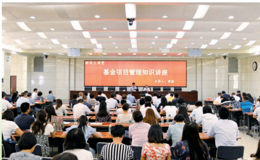
2017年6月22日，自治区财政厅举办基金项目管理知识讲座