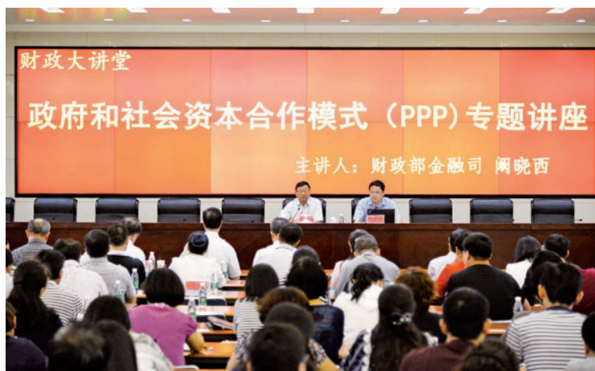
2017年6月8日，自治区财政厅举办政府和社会资本合作模式（PPP）专题讲座