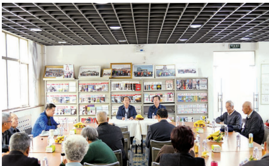
2017年10月25日，自治区财政厅组织离退休老干部欢度重阳节