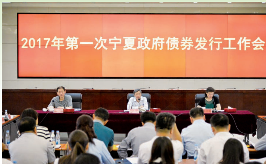
2017年5月27日，自治区财政厅召开2017年第一次宁夏政府债券发行工作会