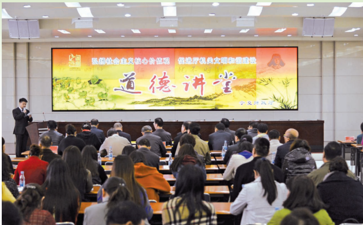
2017年3月30日，自治区财政厅举办道德讲堂活动