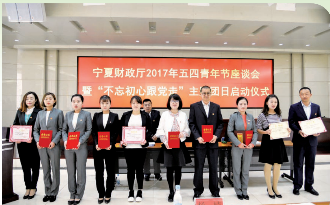
2017年5月4日，自治区财政厅举行2017年五四青年节座谈会暨“不忘初心跟党走”主题团日启动仪式