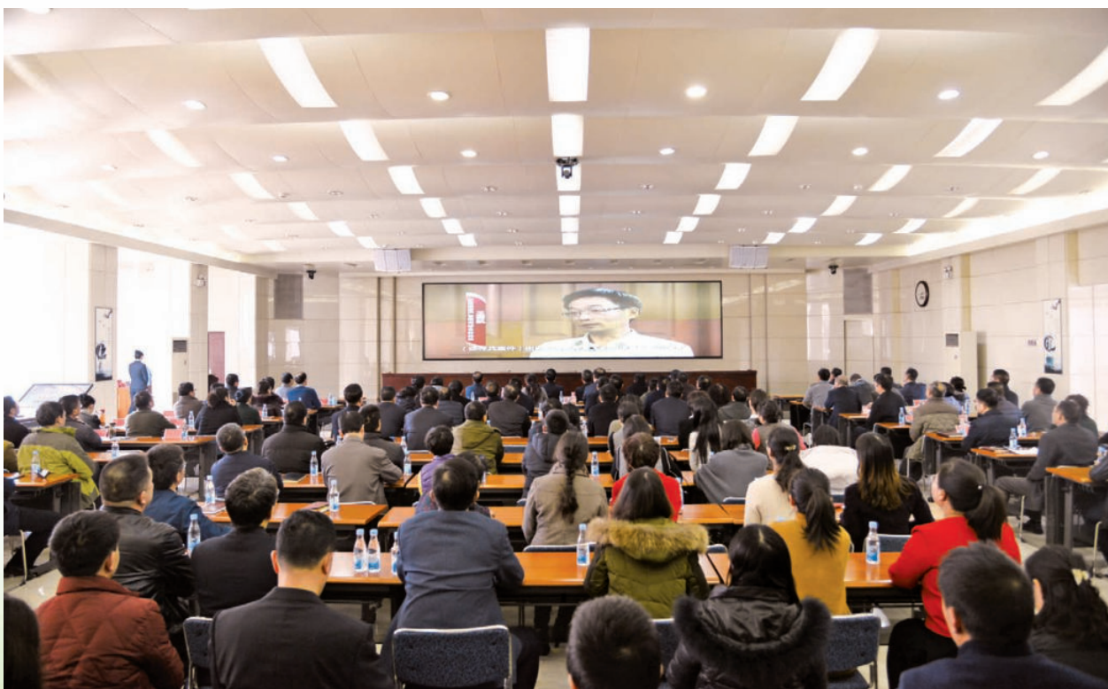
2017年1月18日，自治区财政厅干部职工观看廉政警示教育专题片