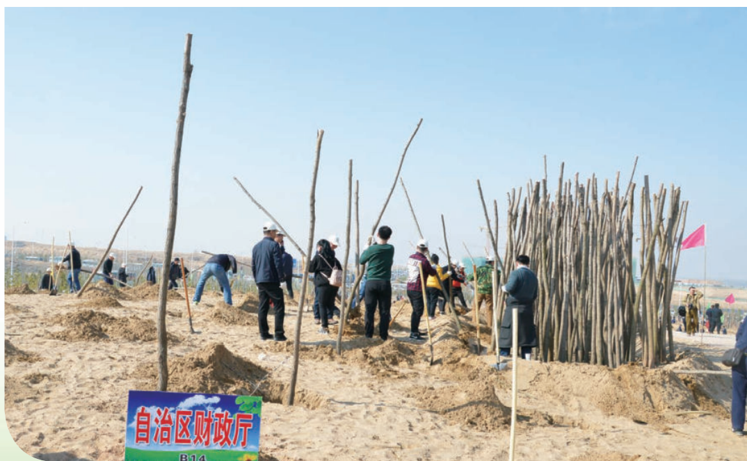
2017年3月31日，自治区财政厅参加植树造林活动