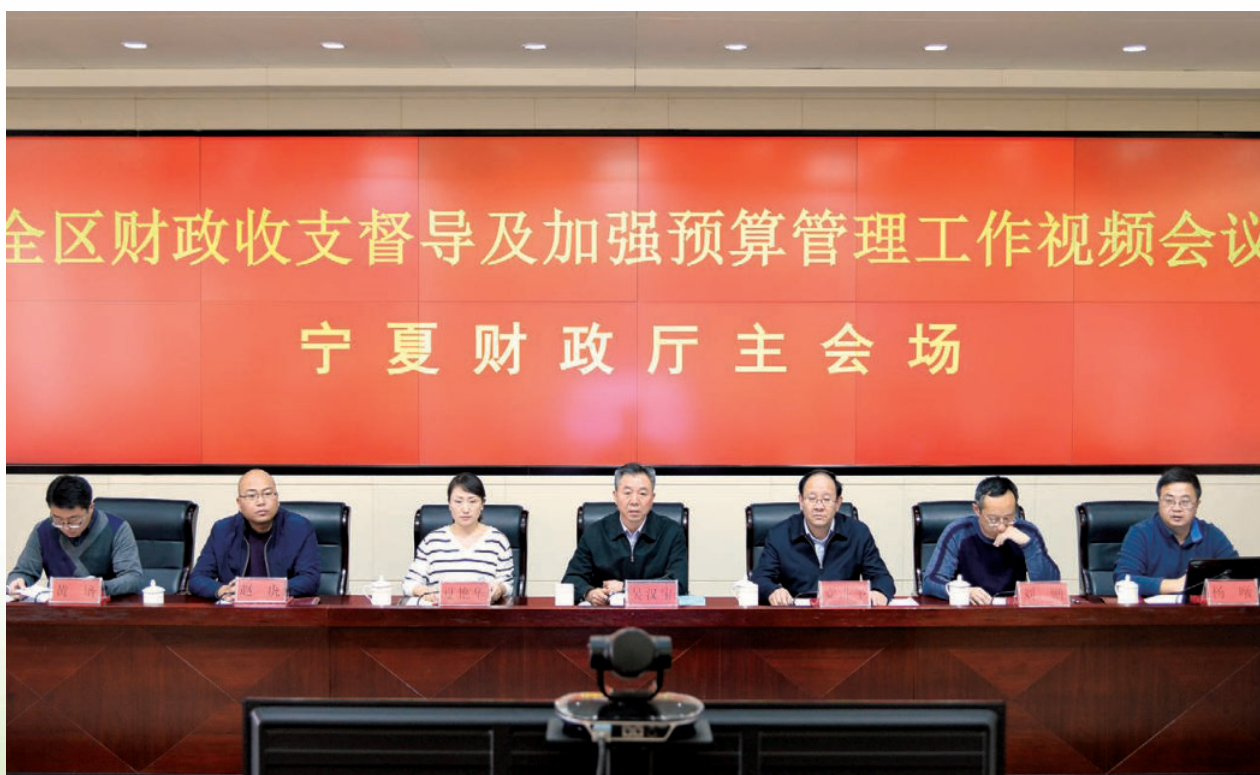
2017年2月15日，自治区财政厅召开全区财政收支督导及加强预算管理工作视频会议