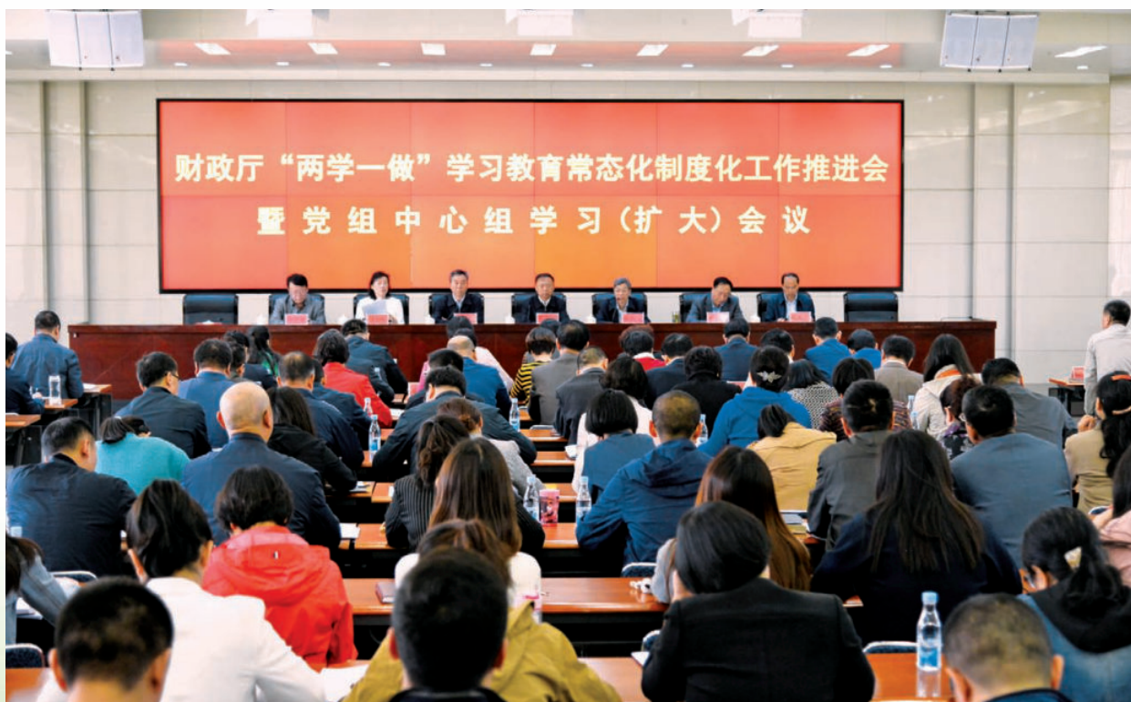
2017年5月5日，自治区财政厅召开“两学一做”学习教育常态化制度化工作推进会暨党组中心组学习(扩大)会议