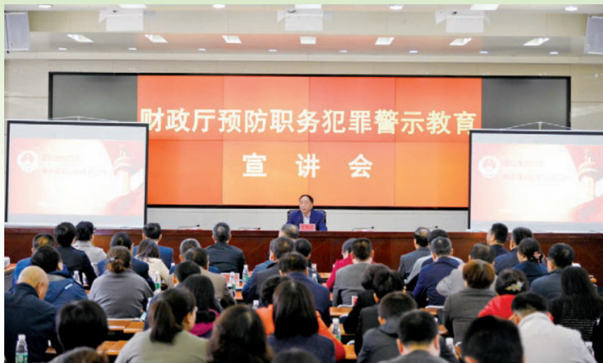
2017年10月10日，自治区财政厅举行预防职务犯罪警示教育宣讲会