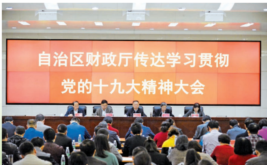
2017年11月1日，自治区财政厅召开传达学习贯彻党的十九大精神大会