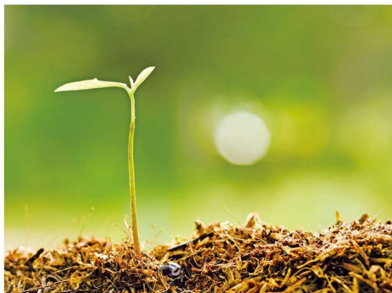
* 肥沃的紫红色土壤

四川盆地夏、秋季雨量充沛，极利于农作物的快速生长，再加上冬季较温暖，因此有很多四季常绿植物。