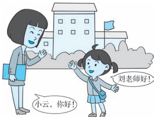
图 1-2 小云向老师问好

tóng bèi zhī jiān yù jiàn zé kě yǐ huī huī 同辈之间遇见，则可以挥挥 shǒu dǎ gè zhāo hu shuō shēng nǐ 手，打个招呼，说声“你 hǎo biǎo shì qīn jìn wò shǒu lǐ shì zuì 好”，表示亲近。握手礼是最 cháng jiàn de lǐ jié wò shǒu shí yīng lì 常见的礼节，握手时，应力 dù shì yí shí jiān bù yí guò cháng 度适宜，时间不宜过长。