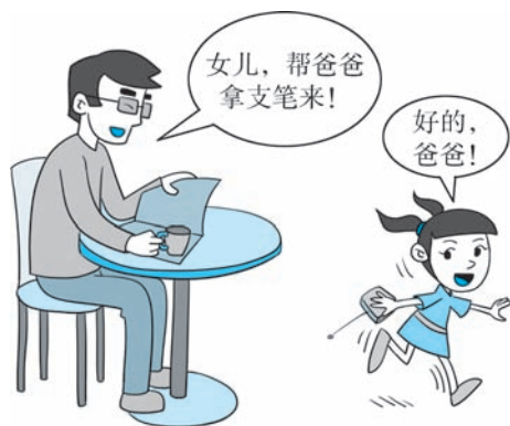
图 2-1 爸爸叫女儿帮忙拿东西

yīng gāi lì jí qǐ lì rèn zhēn huí dá péng you hū jiào yě yīng gāi jí shí yìng dá 应该立即起立，认真回答；朋友呼叫，也应该及时应答。