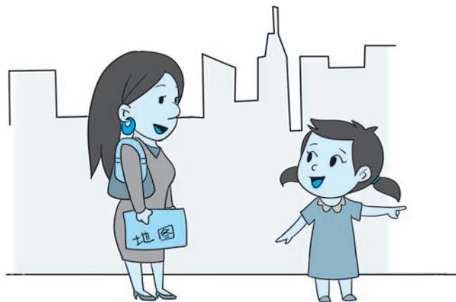
图 2-4 小佳为阿姨指路