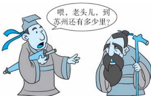
图 1-1 年轻人向老人问路

lǎo xiān sheng xiè xiè nín wèi wǒ zhǐ lù 老先生，谢谢您为我指路。”