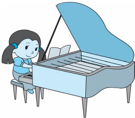
图 2-3 凌凌为大家弹钢琴