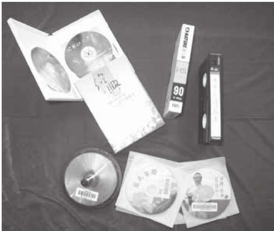
图 1-4 刻录型地方文献——磁盘、VCD、DVD 等数字光盘