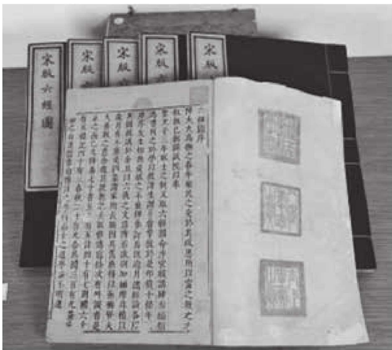
图 1-2 纸质型地方文献——线装古籍