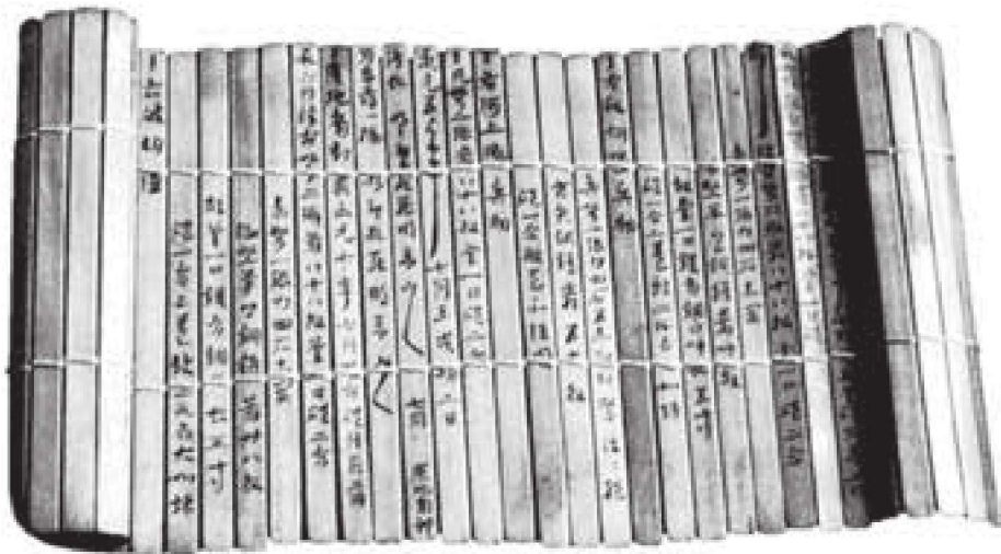
图 1-1 原始材料型地方文献——竹简